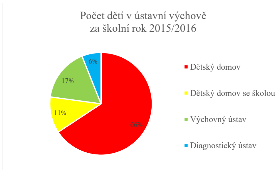
Graf 2 – Počet dětí v ústavní výchově za školní rok 2015–2016