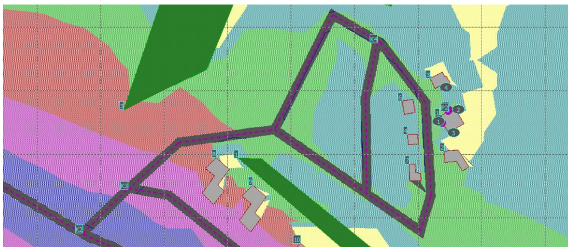
Obrázek 1 Hluková mapa pro denní dobu

V programu Hluk+ byla provedena hluková situace pro den i noc. Ve zvolených kritických bodech bylo posouzeno působení hluku z dopravy a průmyslu. Z porovnání vypočtených předpokládaných hladin akustického tlaku ve sledovaných bodech v chráněném venkovním prostoru stavby s hygienickými limity je zřejmé, že v denní a noční době je limit prokazatelně dodržen.