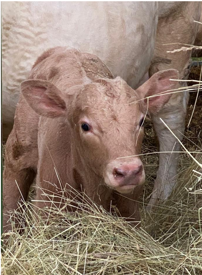
Obrázek 3: Tele cca 3 dny staré (kříženec T50 x Y50).