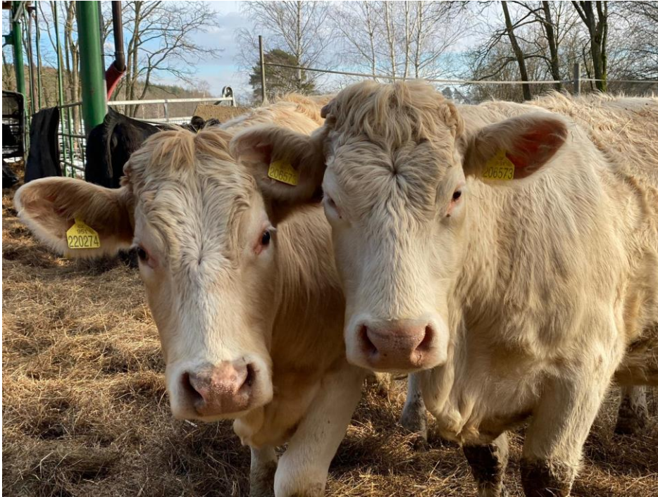
Obrázek 2: Plemenice charolais (T), které byly použity k produkci kříženců Z50 T50 a T50 Y50.