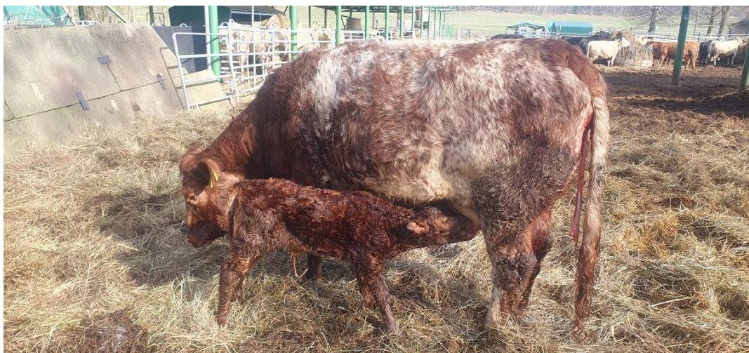
Obrázek 7: Plemenice Z50 T50 (její otec je předchozí býk Z na Obrázku 6) zkřížená s Y, na fotce s čerstvě narozeným teletem Y50 T25 Z25