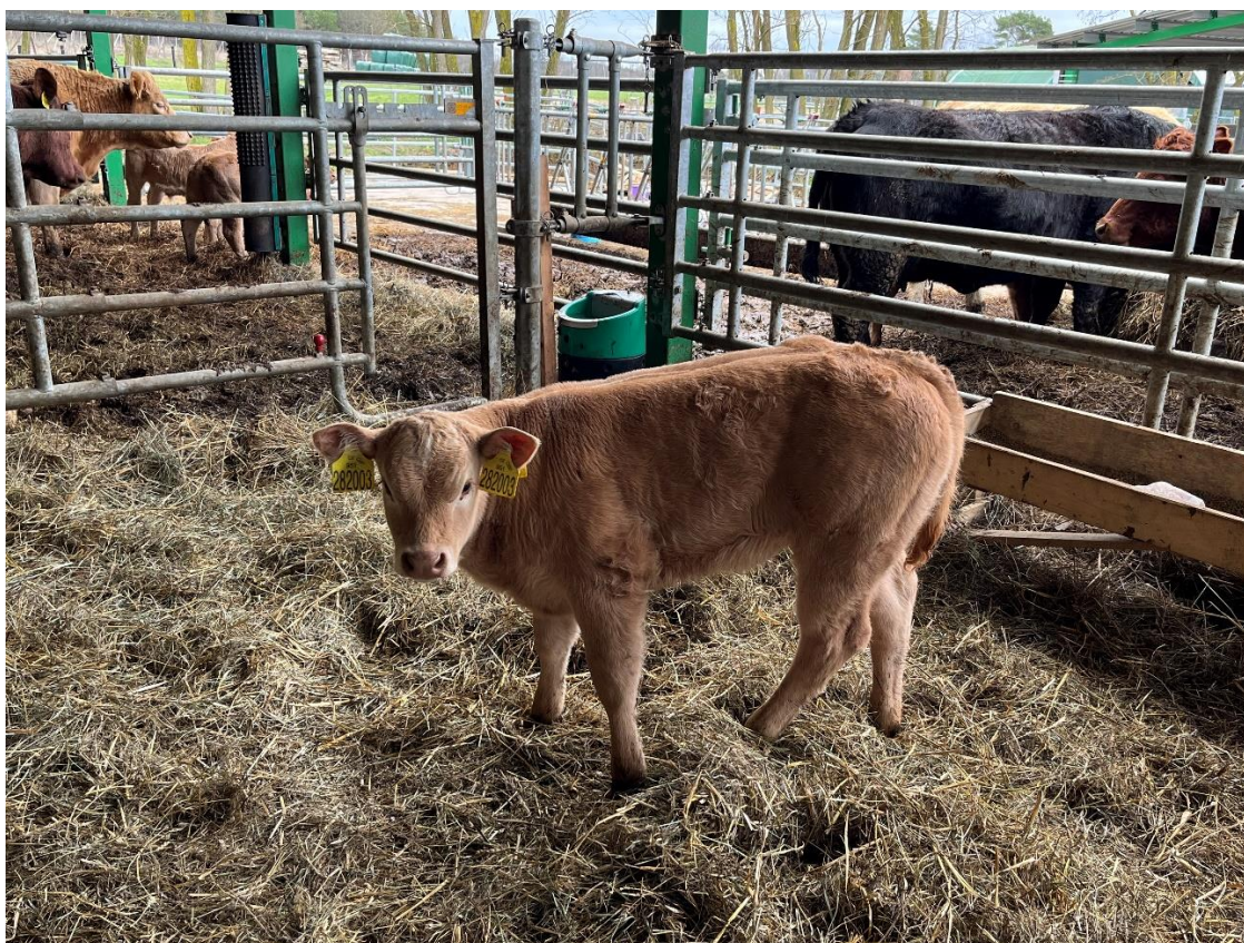
Obrázek 5: Jalovička cca 14 dní stará (terminální kříženka Y75 T25).