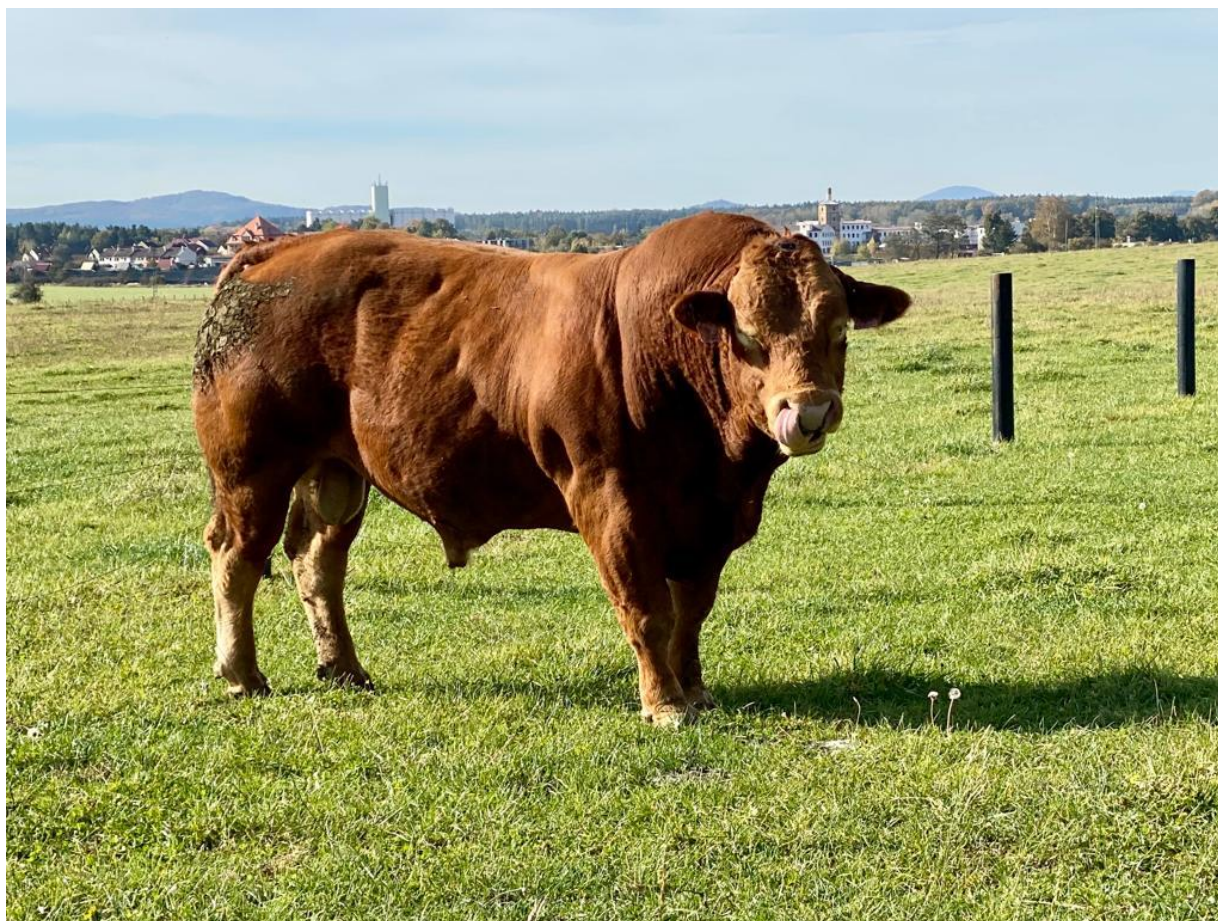
Obrázek 1: Plemenný býk limousine (Y), který byl použitý ke zkřížení s plemenicemi charolais k produkci kříženců T50 Y50.