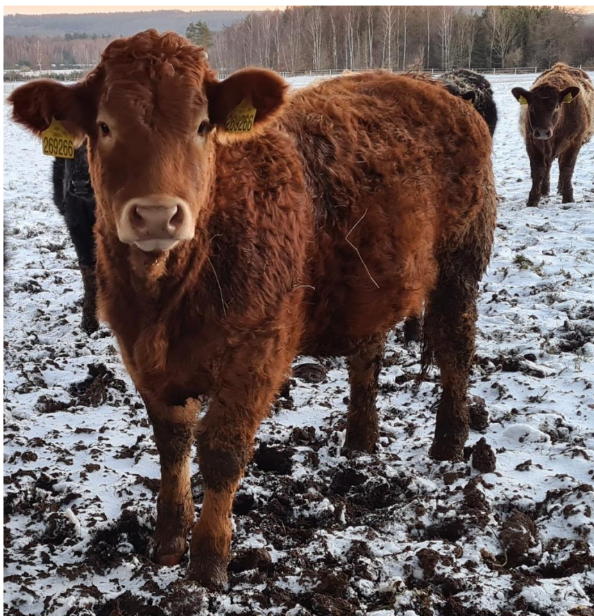
Obrázek 4: Cca roční jalovice (kříženka T50 Y50).