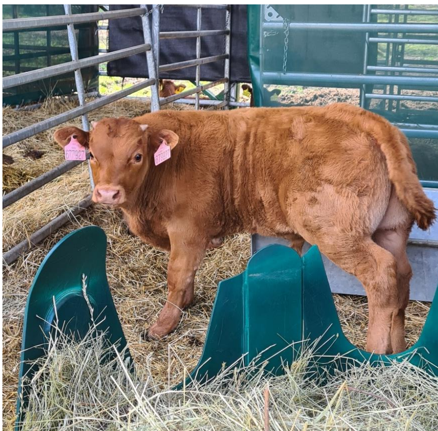
Obrázek 8: Býček 3-4 měsíce starý (terminální kříženec Y50 T25 Z25)