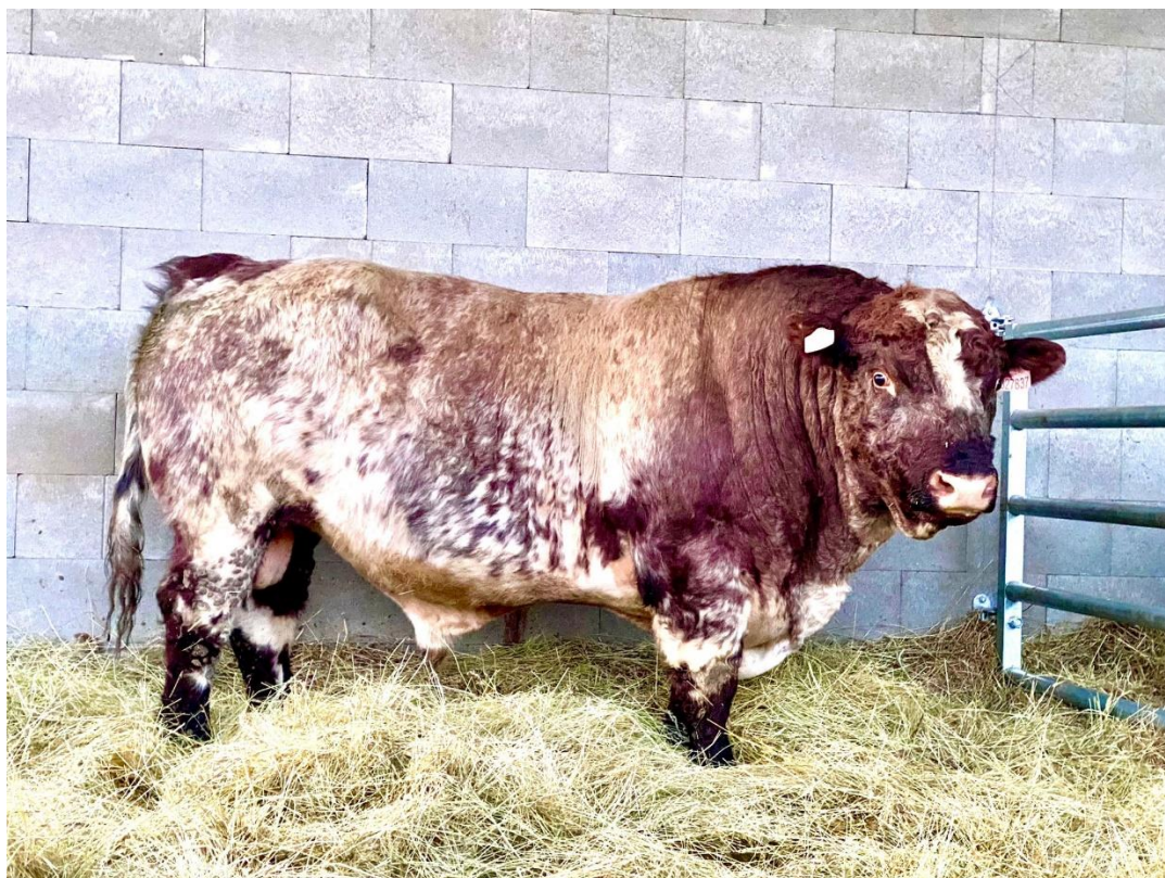
Obrázek 6: Plemenný býk shorthorn (Z), který byl použitý ke zkřížení s plemenicemi charolais k produkci kříženců Z50 T50.