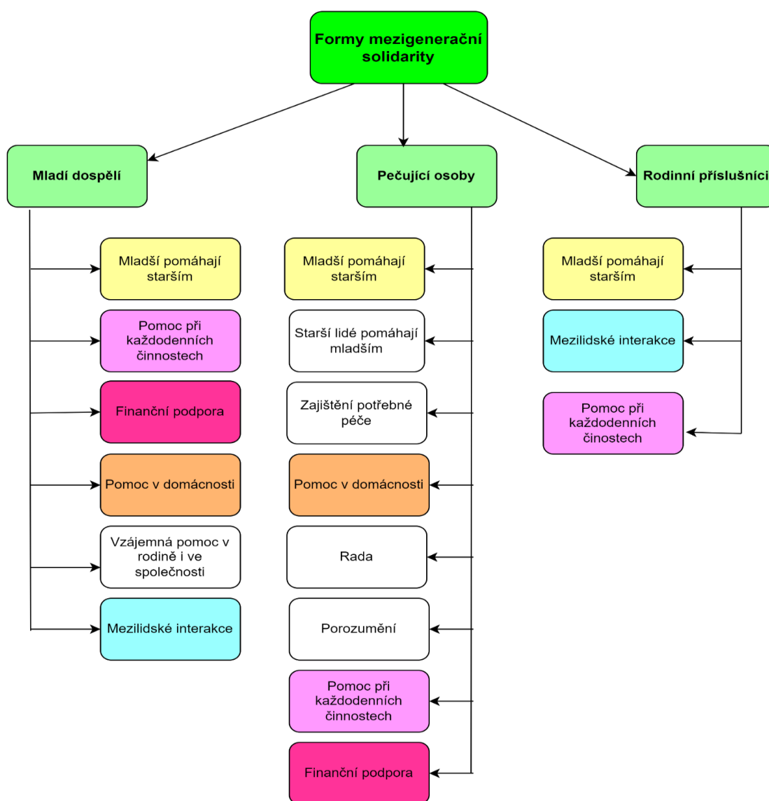
Obrázek č. 1: Formy mezigenerační solidarity

První kategorie je tvořena na identifikaci různých forem mezigenerační solidarity. Tato analýza se soustředí na to, jak vnímají mezigenerační solidaritu pečující osoby, rodinní příslušníci a mladí dospělí, viz obrázek 1.