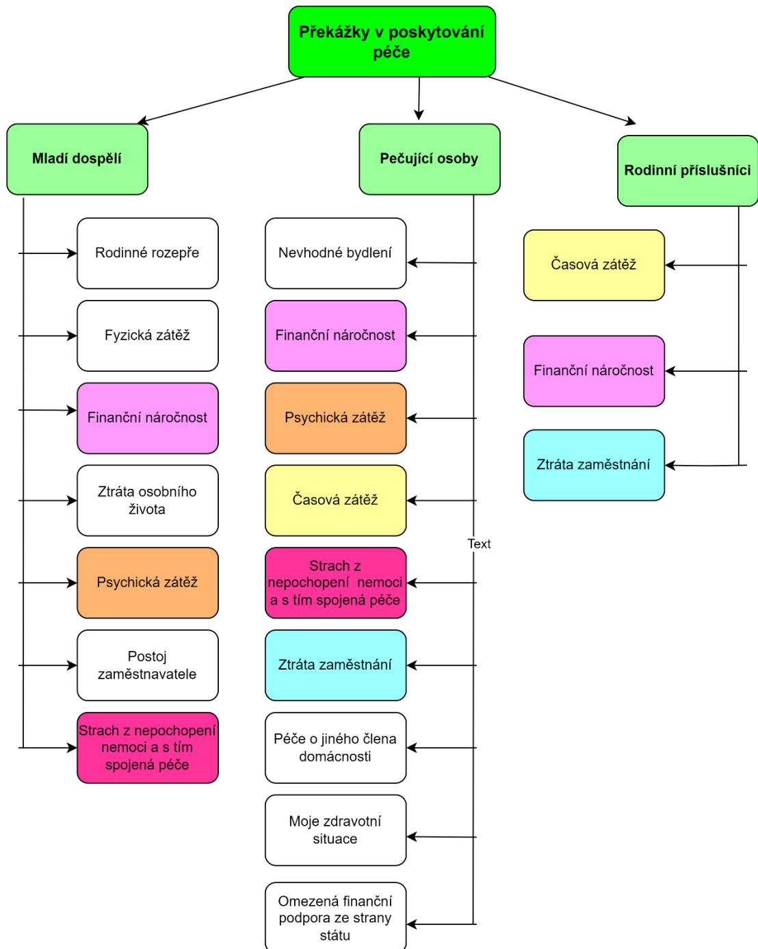
Obrázek č. 2: Překážky v poskytování péče

Druhá kategorie se zaměřuje na překážky, které se vyskytují při péči o osoby trpící Alzheimerovou chorobou, a zkoumá, jak tyto překážky vnímají pečující osoby, rodinní příslušníci a mladí dospělí, viz obrázek 2.