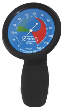
Příloha č. 4: Manometr