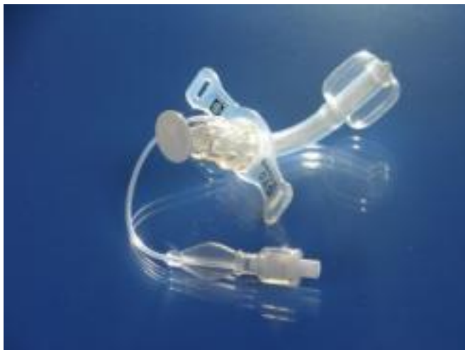
Příloha č. 3: Obrázek TSK s obturační manžetou