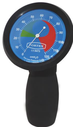
Příloha č. 4: Manometr