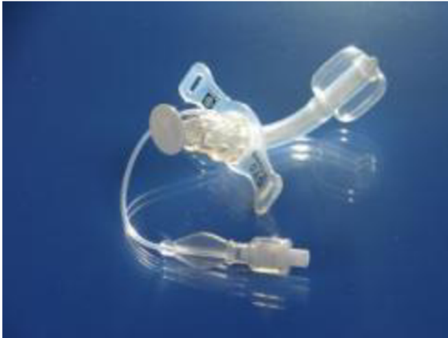
Příloha č. 3: Obrázek TSK s obturační manžetou