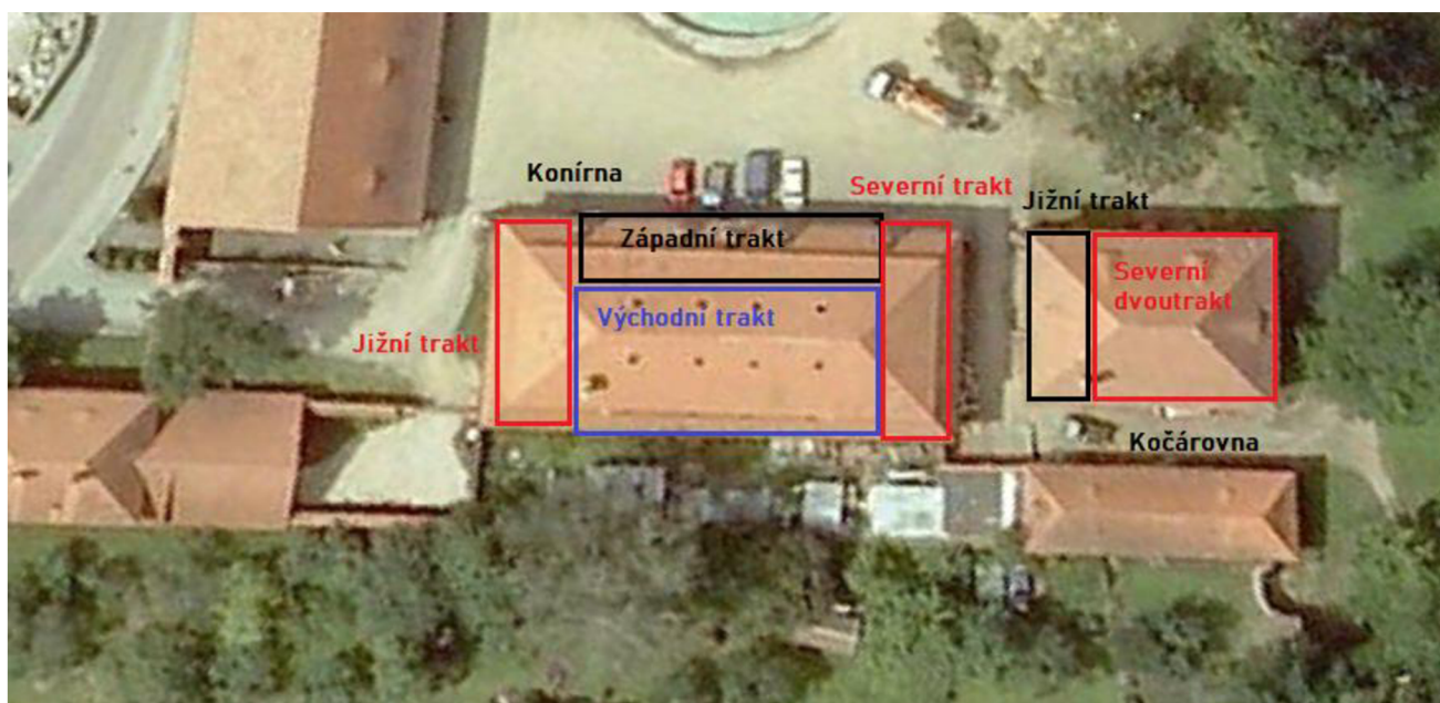
Příloha č. 2: Fotografie současné budovy zámecké konírny a kočárovny s popisem jednotlivých částí