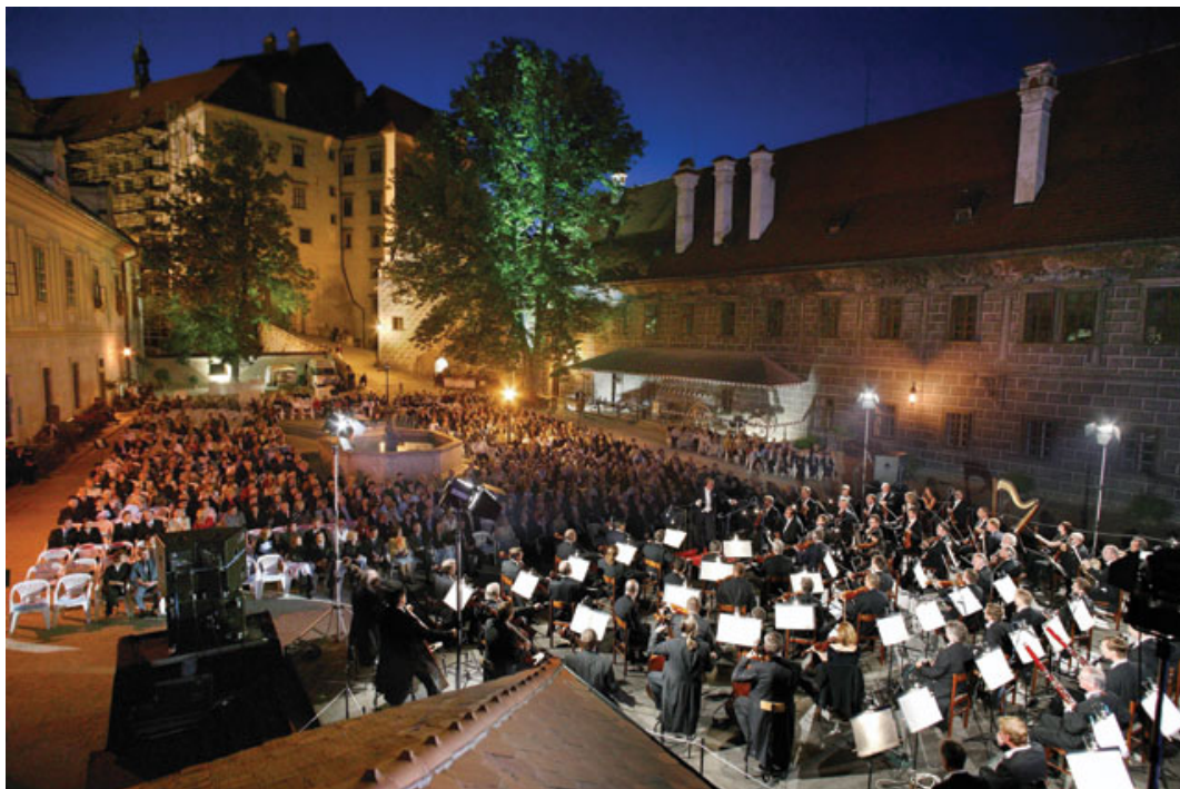
Obr. 19: Mezinárodní hudební festival Český Krumlov. 90