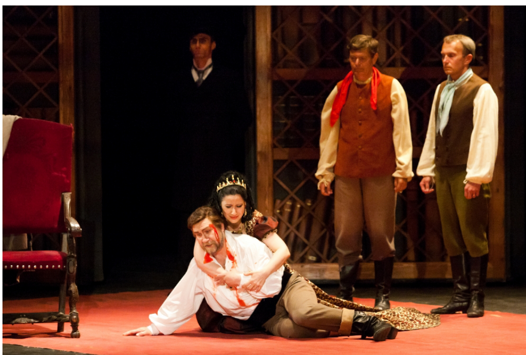
Obr. 13: Opera G. Pucciniho Tosca z roku 2010. 84