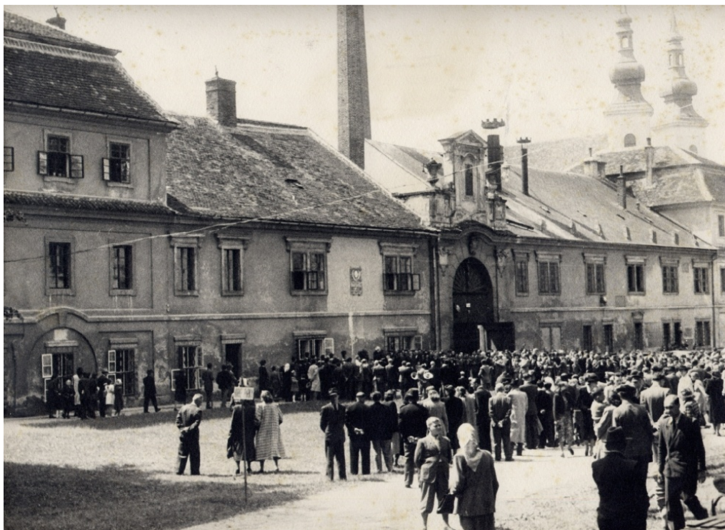
Obr. 2: Otevření rodného bytu Bedřicha Smetany v roce 1949. 73