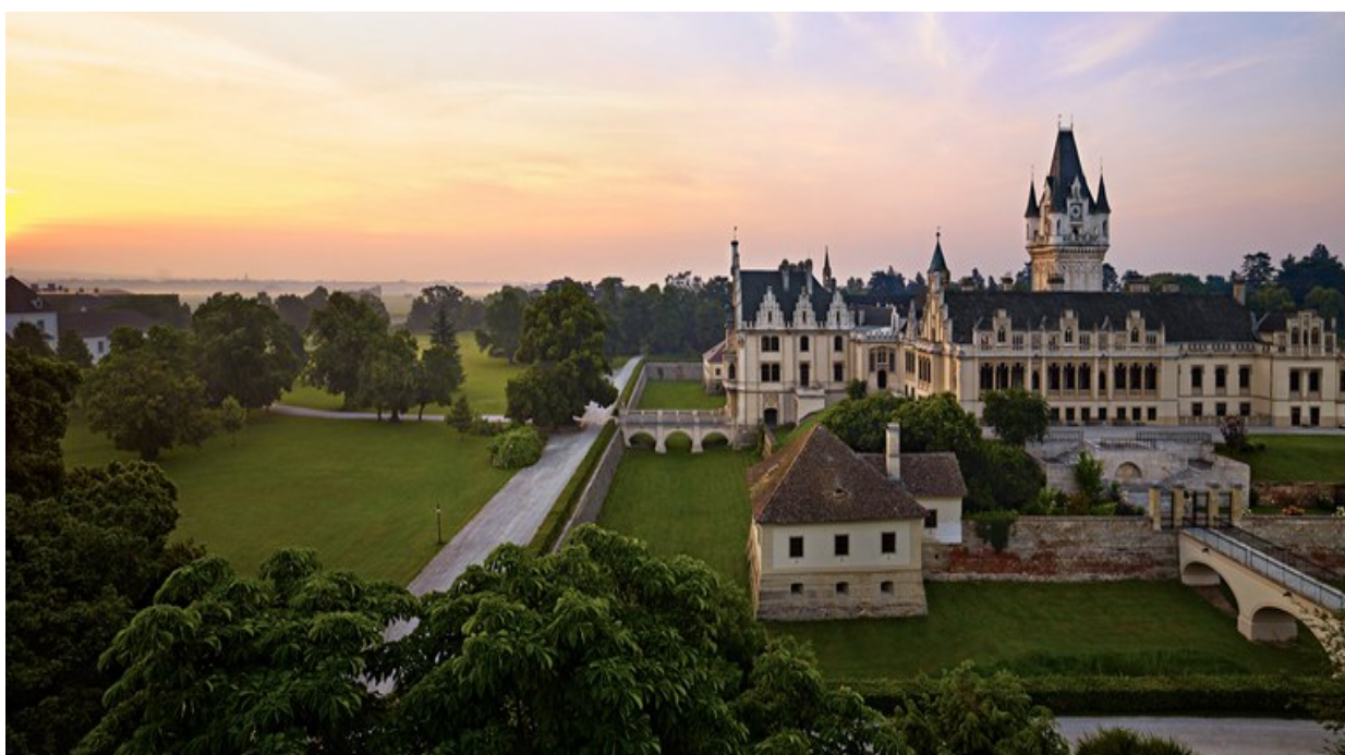
Obr. 21: Zámek v Grafeneggu. 92