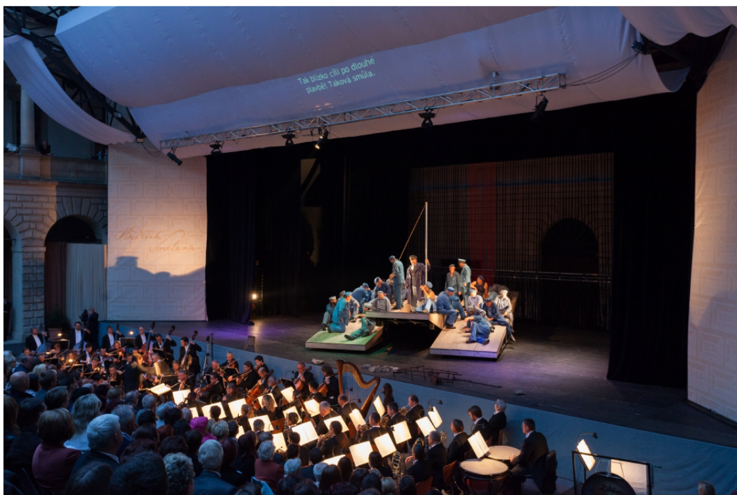
Obr. 14 Richard Wagner: Bludný Holanďan z roku 2014. 85