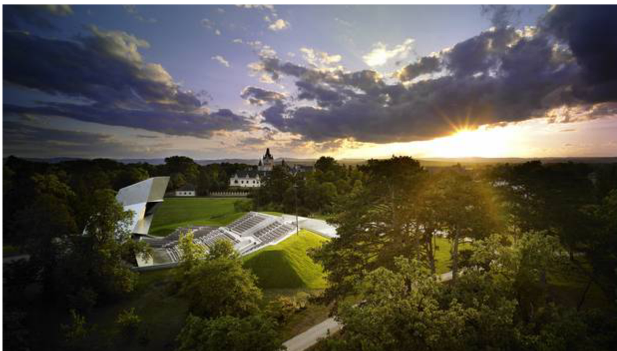
Obr. 20: Wolkenburg – největší aréna pod širým nebem v Evropě. 91