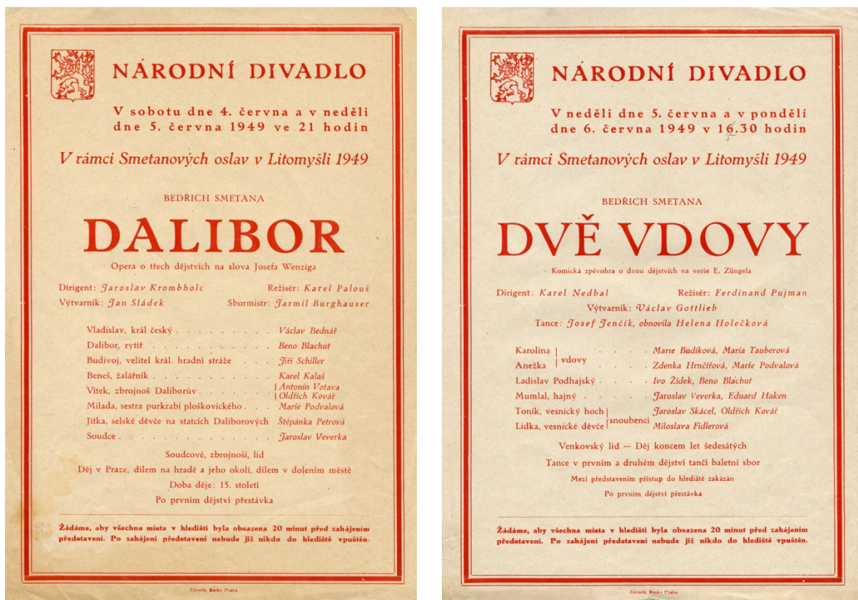
Obr. 1: Ukázka plakátů z roku 1949. 72