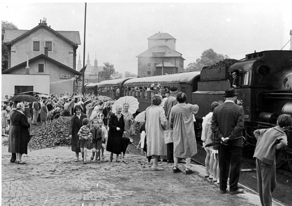
Obr. 6: Odjezd umělců Národního divadla Praha z nádraží v Litomyšli. 77