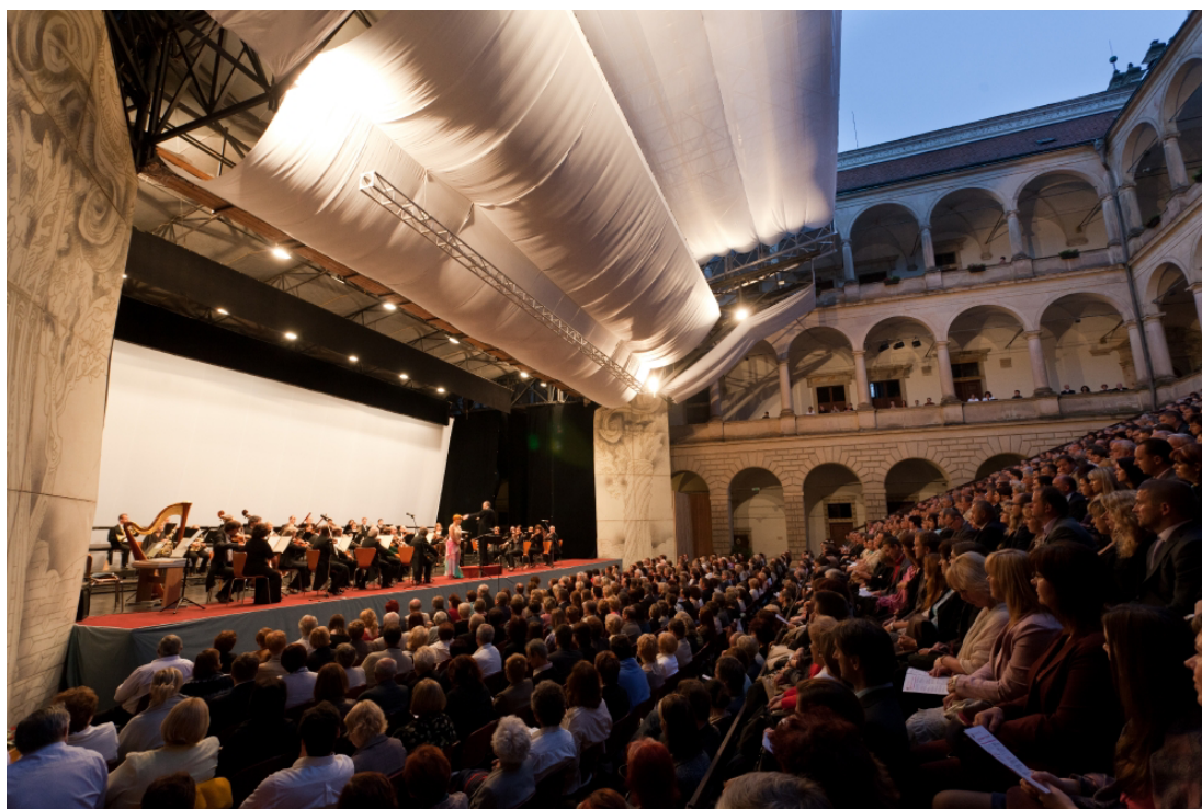
Obr. 17: Druhé zámecké nádvoří, kde se odehrává většina představení. 88