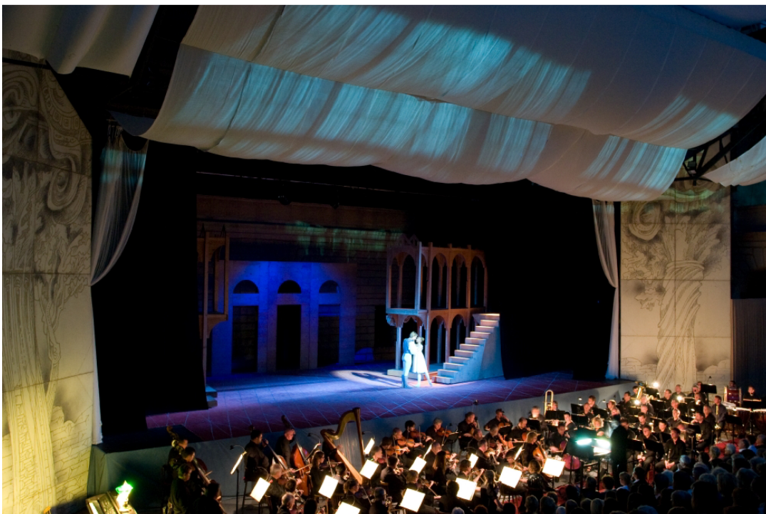
Obr. 12: Balet Romeo a Julie, který proběhl na festivalu v roce 2008. 83