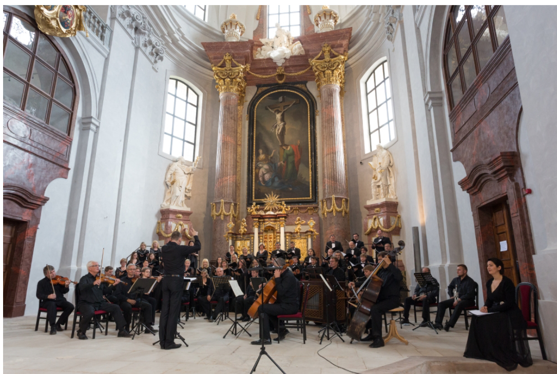
Obr. 15 Georg Friedrich Händel: Mesiáš z roku 2014 86