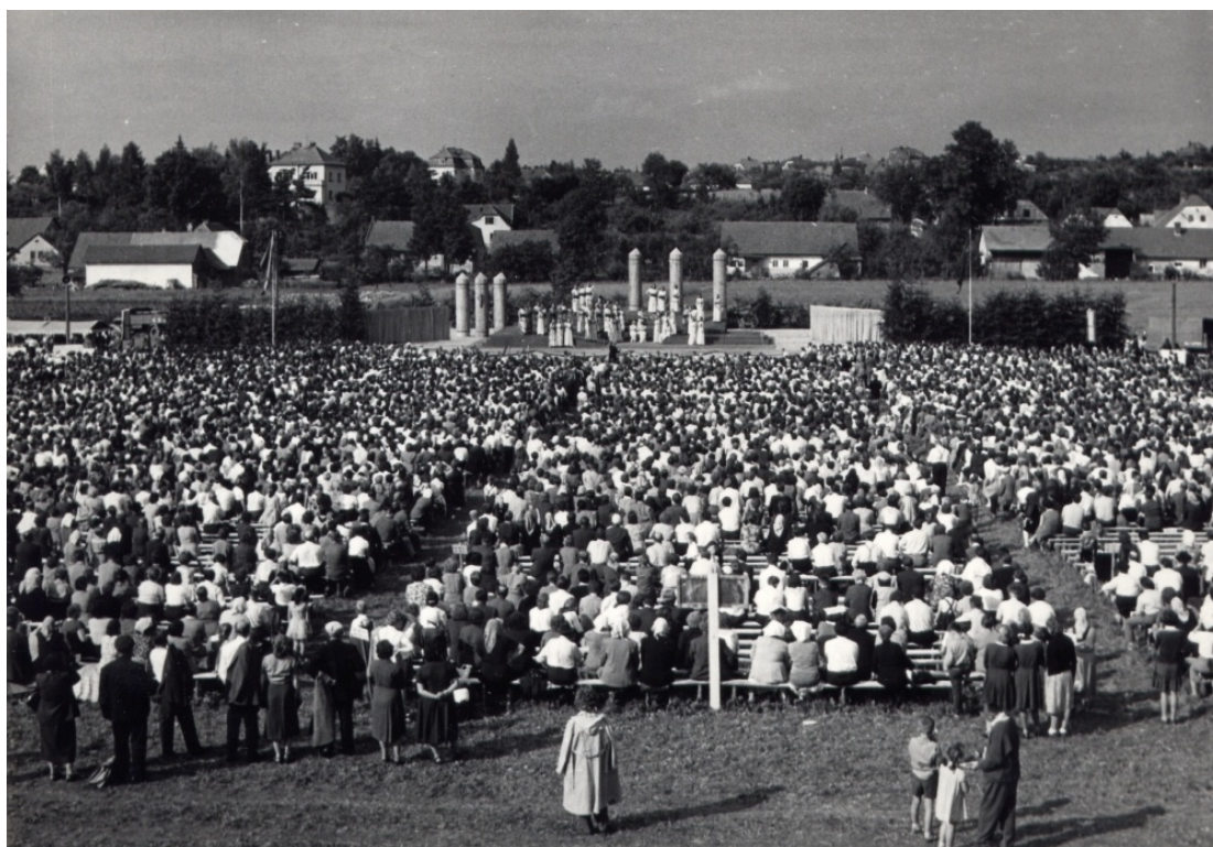
Obr. 3: V roce 1959 byl den hlavních oslav spojen s lidovou manifestací. 74