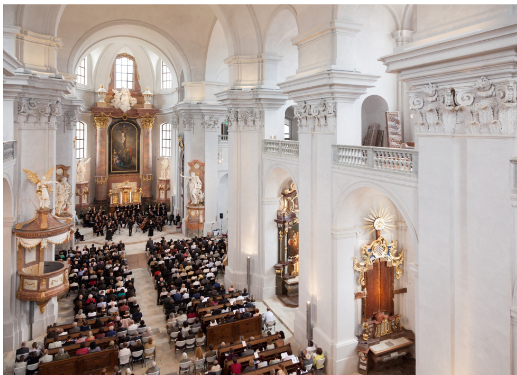
Obr. 18: Piaristický chrám Nalezení sv. Kříže, kde se odehrávají některá představení. 89