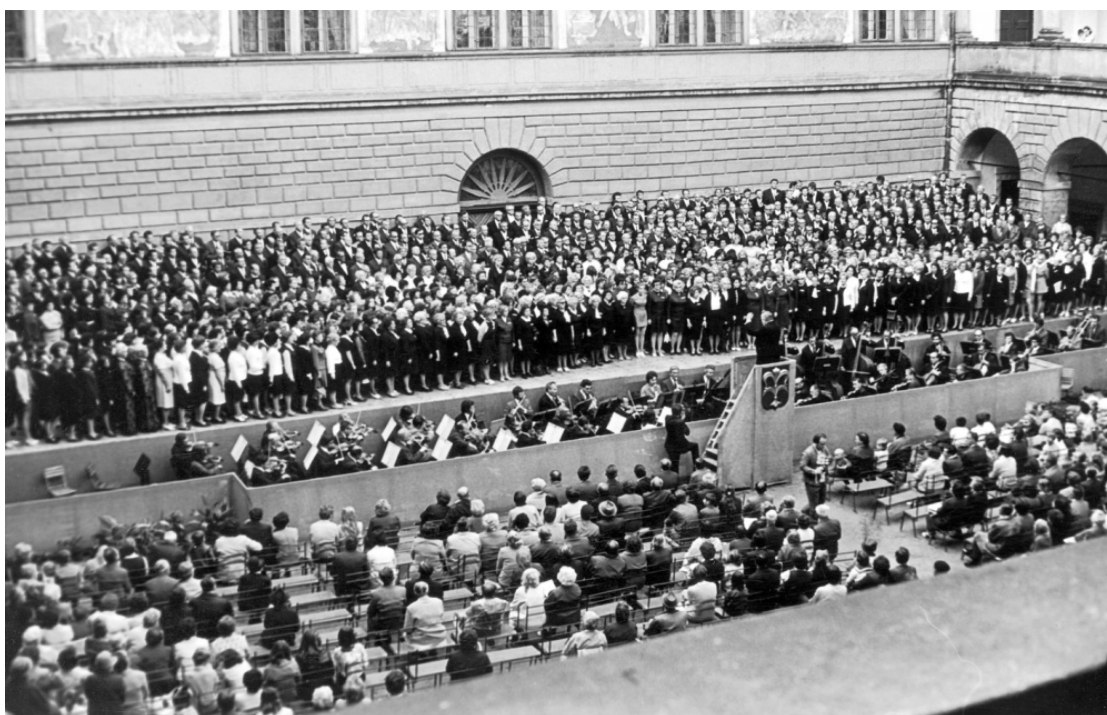
Obr. 7: Na konci 50. let byla součástí festivalu i Krajská slavnost písní a tanců. 78