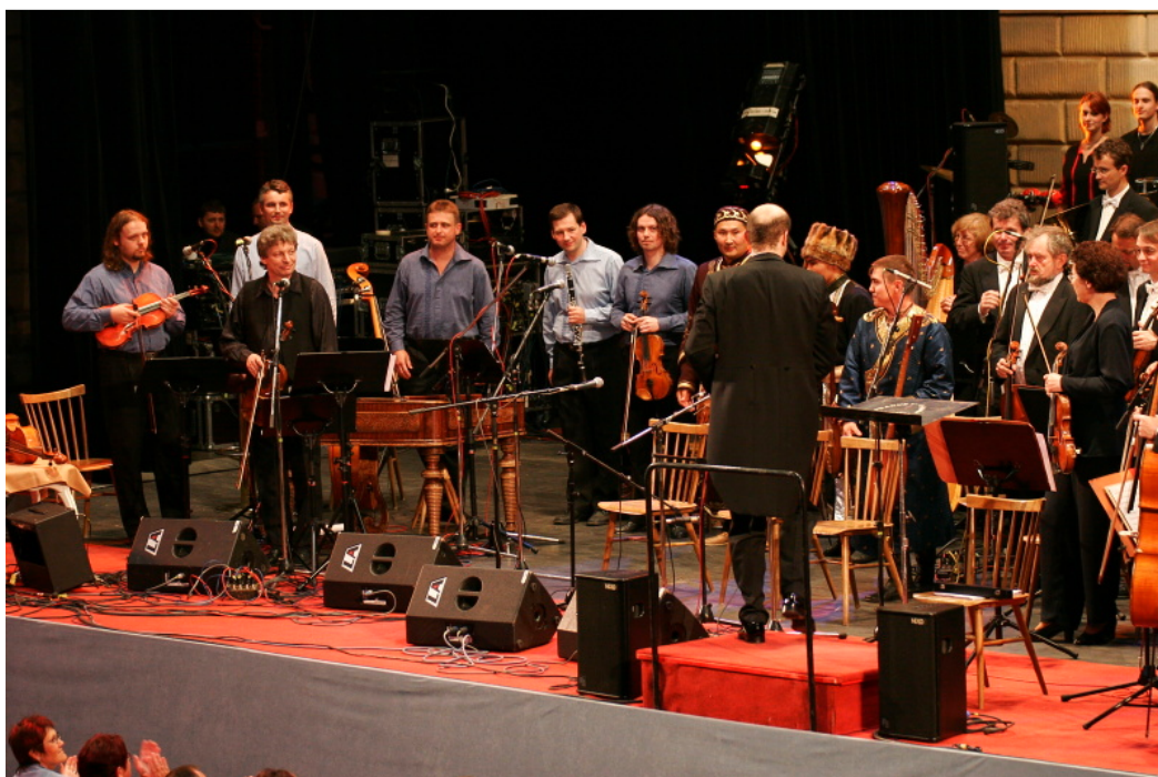
Obr. 10: Autorský projekt Jiřího Pavlici Chvění, který proběhl na festivalu v roce 2006 81