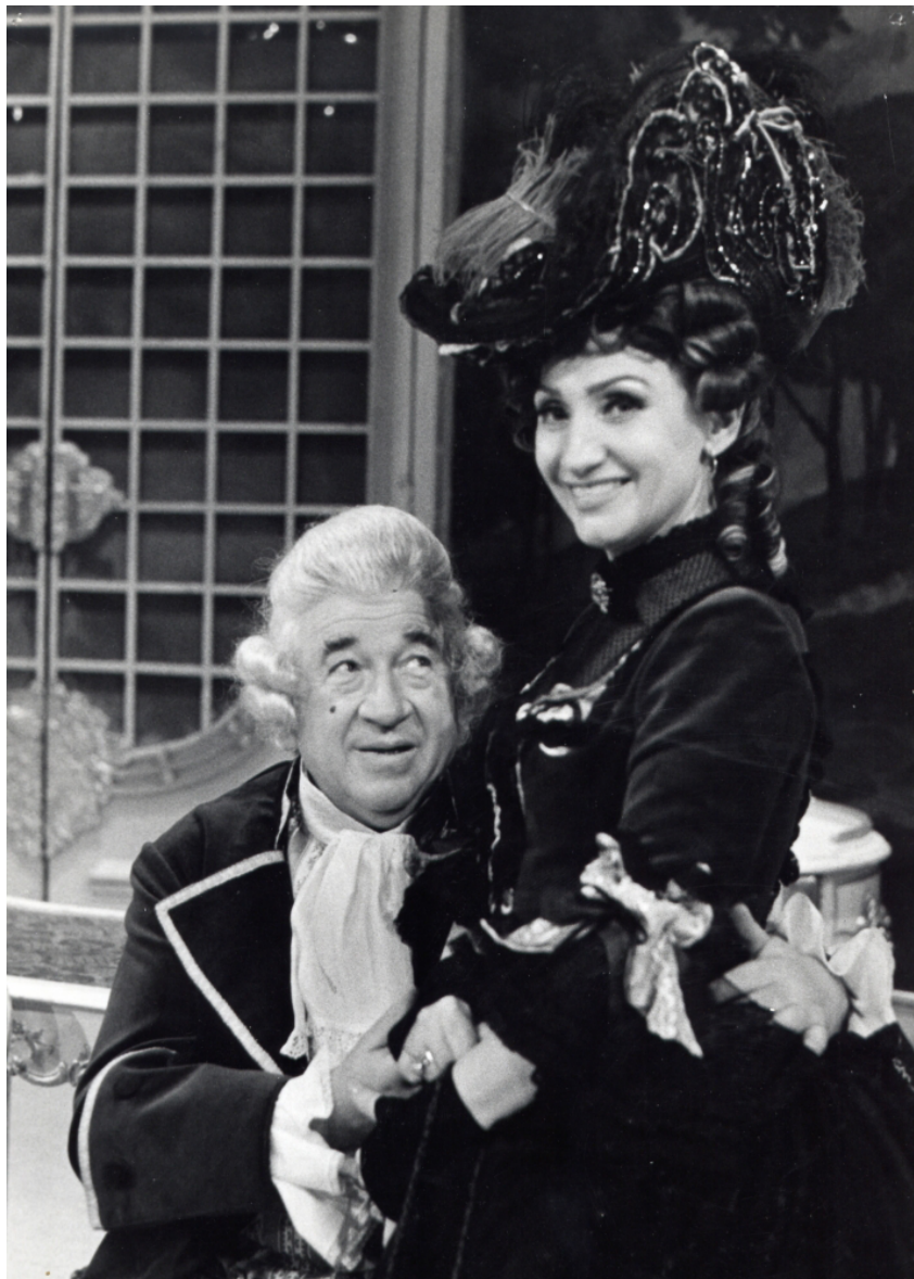
Obr. 9: V roce 1988 zazněla na festivalu první světová opera Figarova svatba. 80