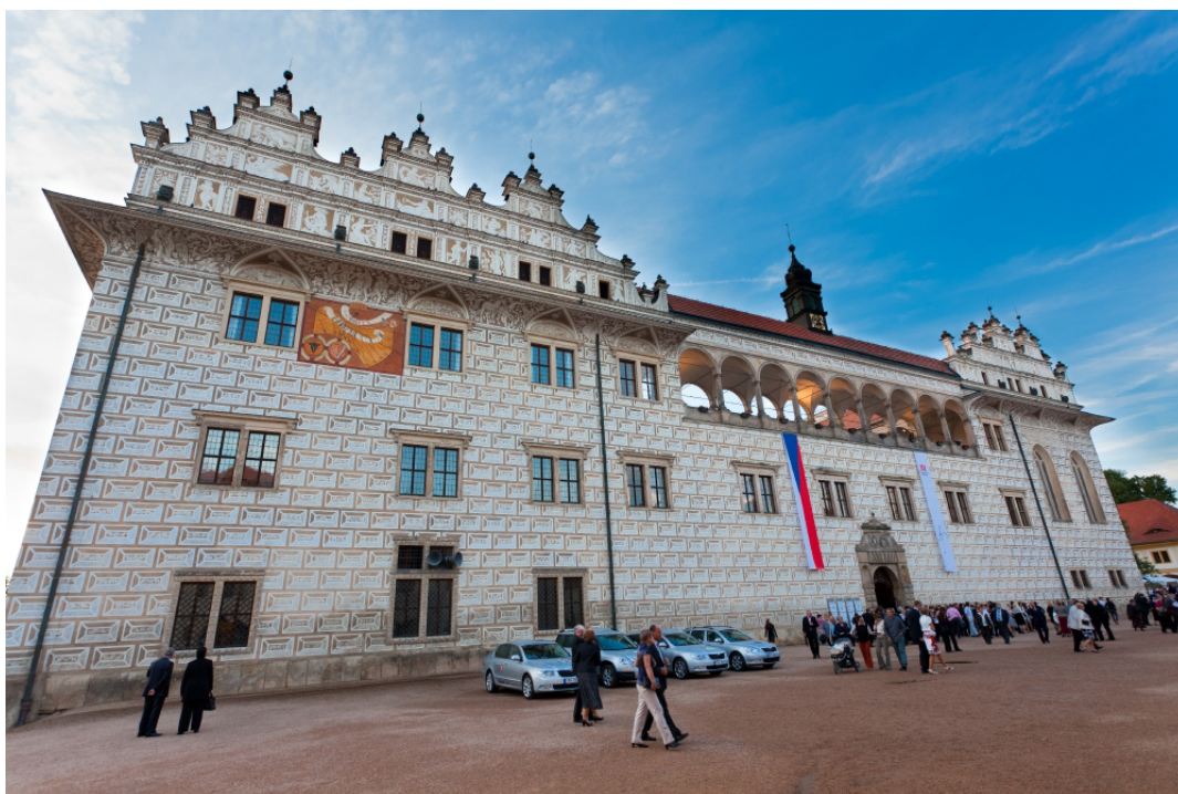
Obr. 16: Státní zámek Litomyšl v době konání festivalu Smetanova Litomyšl. 87