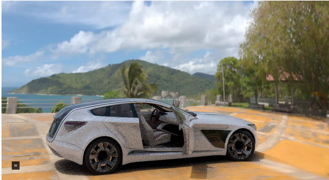
Obr. 12 Stream ve 4K rozlišení

Nejvíce uživatelsky přívětivé nastavení bylo při použití Full HD rozlišení, kdy latence obrazu byla téměř nulová, zároveň také přijatelná hodnota FPS a přijímaný datový tok v rozmezí 18-20 Mb/s. Hodnota FPS je bohužel touto formou neměřitelná, nicméně si troufám říct, že jsme se pohybovali okolo 40 FPS. Co se týče vytížení grafických karet, průměrná hodnota ukazovala 16 % a maximální hodnota 30 %.