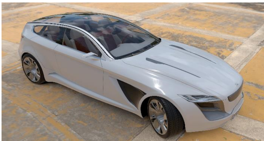
Obr. 3 Vypnutý ray tracing

Porovnání zapnuté a vypnuté funkce ray tracingu je vidět na Obr. 3 a Obr. 4, kde je vyrenderovaný tentýž model automobilu v softwaru VRED. Na Obr. 3 je funkce vypnutá a na Obr. 4 je ray tracing zapnutý včetně globálního osvětlení. Již na první pohled je vidět kvalita osvětlení a stínů modelu.