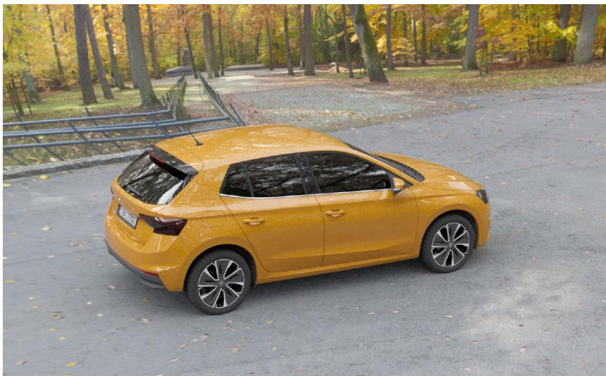
Obr. 17 VRUT Full HD stream

Nejnižším testovaným rozlišením bylo již zmíněné Full HD. Při tomto rozlišení byl obraz naprosto plynulý a bez jakýchkoliv záseků nebo latence. I hodnota snímků za sekundu se pohybovala okolo přijatelných dvaceti FPS, což je ale ještě daleko od požadavku. Snížila se také náročnost na datový přenos, kdy přijímaný datový tok činil 17 Mb/s. Nižší rozlišení mělo samozřejmě negativní vliv na kvalitu obrazu, kdy nebyl model tak detailně vykreslen, jako ve vyšších rozlišeních. Vyrenderovaný model ve Full HD rozlišení je zachycen na Obr. 17. Procesory clusteru byly při renderování tohoto modelu vytíženy průměrně z 81 %.