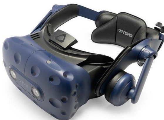
Obr. 7 HTC VIVE Pro Headset [17]

rozlišením 5120 x 1440 pixelů, tedy 5K, jak již plyne z názvu. U novějšího modelu XTAL 8K jsou to dva 4K LCD displeje s celkovým rozlišením 7680 x 2160 pixelů. Oba modely mají obnovovací frekvenci 75 Hz a zorné pole 180 stupňů. Jejich další velice užitečnou funkcí je senzor sledující pohyb rukou uživatele, který může interagovat se scénou bez použití ovladačů. Je nezbytné také zmínit, že XTAL headset podporuje softwary, jako jsou Autodesk VRED nebo Unreal Engine a je optimalizován pro profesionální grafické karty NVIDIA Quadro, takže je schopen zvládat vysoce náročné VR projekty, například design aut, kde jen malá nepřesnost může být katastrofální. [18]