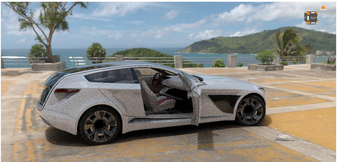
Obr. 11 Výchozí model pro streamování

Tento software je v současné době ve společnosti Škoda Auto nejvíce používaný pro práci s 3D modely. Streamování ve VREDu je uživateli zobrazeno pomocí rozhraní ve webovém prohlížeči, ke kterému se připojí na základě IP adresy zařízení, které streamuje. Veškerá základní nastavení streamu, jako jsou jeho zapnutí, zadání IP adresy pro přístup ke streamu, anebo také omezení k jeho přístupu na základě nastavení přihlašovacích údajů, je k dispozici přímo v softwaru VRED. Pro zapnutí streamu je potřeba pouze zapnout webový server. Nastavení týkající se kvality videa si uživatel volí přímo v rozhraní webového prohlížeče. K dispozici je volba kodeku, CPU nebo GPU vykreslování, bitrate videa či rozlišení videa.