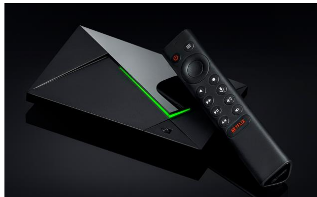
Obr. 9 NVIDIA Shield Pro [29]

Zařízení Shield, viz Obr. 8 využívá procesor NVIDIA Tegra X1 s grafickou kartou s 256 jádry a 2 GB RAM, u verze NVIDIA Shield Pro, které je na Obr. 9, činí paměť RAM 3 GB. Dále nabízí výstup videa v rozlišení 4K HDR při 60 FPS a vylepšení HD videa na 4K pomocí upscalingu na základě umělé inteligence. Pro připojení k internetu podporuje gigabitový Ethernet a Wi-Fi, pro připojení ostatních periférií jsou použity dva USB porty a Bluetooth. Celá konzole je ovládána pomocí bezdrátového dálkového ovladače nebo s využitím hlasového asistenta.