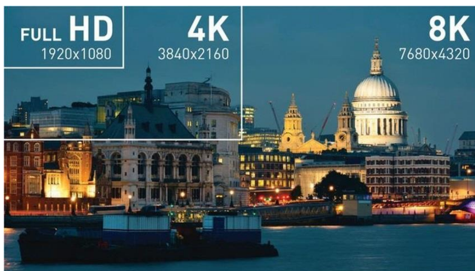
Obr. 5 Jednotlivá rozlišení obrazu [13]

přenosu. Například pro streamování videa v 8K bude potřeba rychlost linky 50–100 Mb/s, přesná přenosová rychlost záleží na kodeku videa. [12]