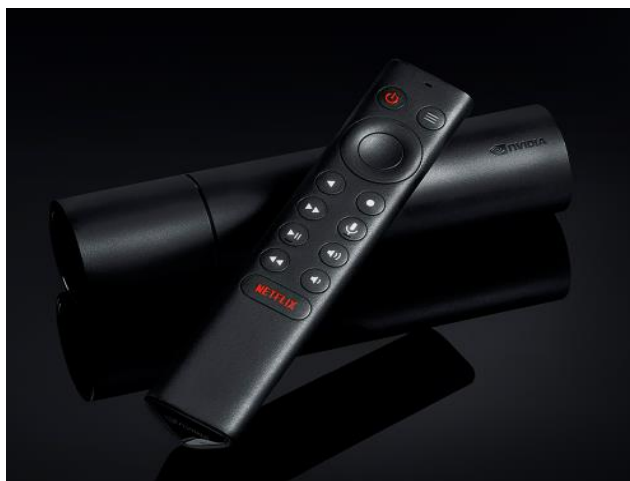
Obr. 8 NVIDIA Shield [29]

Nvidia Shield TV je digitální přehrávač médií založený na Android TV, který vyrábí společnost Nvidia. Stejně jako všechny ostatní zařízení Android TV může také streamovat obsah z cloudu, počítače a ostatních zařízení. Toto zařízení je vyráběno ve dvou modelech, přičemž se model Shield TV Pro vyznačuje především zvětšeným vnitřním úložištěm.