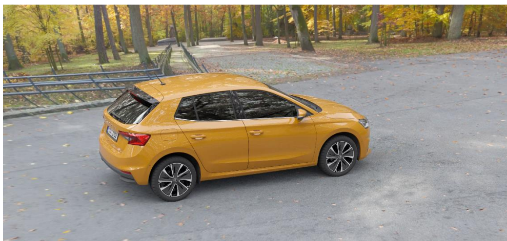
Obr. 15 VRUT 4K stream

Při zvoleném rozlišení 4K bylo dosaženo velmi kvalitního obrazu, viz Obr. 15. Při pohybu uživatele ve scéně neměl obraz tendenci rozpadu či kostičkování, nicméně docházelo k mírným zásekům obrazu s odhadovanou latencí jedné sekundy. Přijímaný datový tok činil 25 Mb/s. Procesory clusteru dosáhly maximálního vytížení 96 %, s průměrnou hodnotou 94 %. Hodnota FPS se pohybovala kolem hodnoty šest, což je velmi málo a následkem byla samozřejmě horší plynulost streamu.