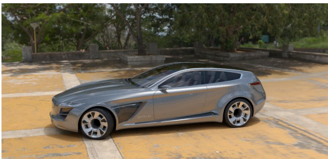
Obr. 21 VDI Full HD stream

Při nejnižším testovaném rozlišení Full HD opět klesla výrazně kvalita streamu, zároveň však navíc zůstala celkem vysoká latence, která činila jednu sekundu. Dle mého názoru a v porovnání s předchozími kódéry je to na tak nízké rozlišení docela vysoká latence, proto si myslím, že ani toto rozlišení by u uživatele neobstálo. Latence měla samozřejmě vliv i na celkovou plynulost streamu, který ukazoval hodnoty 10 FPS a přijímaný datový tok 13 Mb/s. Stream v tomto rozlišení je k dispozici na Obr. 21.