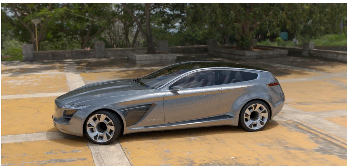
Obr. 20 VDI QHD stream

Při nejnižším testovaném rozlišení Full HD opět klesla výrazně kvalita streamu, zároveň však navíc zůstala celkem vysoká latence, která činila jednu sekundu. Dle mého názoru a v porovnání s předchozími kódéry je to na tak nízké rozlišení docela vysoká latence, proto si myslím, že ani toto rozlišení by u uživatele neobstálo. Latence měla samozřejmě vliv i na celkovou plynulost streamu, který ukazoval hodnoty 10 FPS a přijímaný datový tok 13 Mb/s. Stream v tomto rozlišení je k dispozici na Obr. 21.