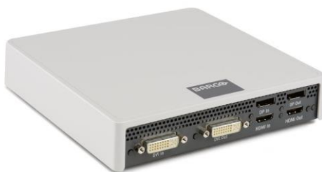
Obr. 10 Barco NGS-D320 Lite [32]

Tato společnost má také širokou nabídku hardwarových kodérů/dekodérů a v rámci spolupráce se společností Škoda Auto jsem měl možnost prokonzultovat přímo se zástupcem Barca vhodný hardwarový kodér pro korporátní využití. Konkrétně mi byl doporučen již zmiňovaný kodér NGS-D320 Lite (viz Obr. 10), který je v podstatě jediným řešením pro Streaming.