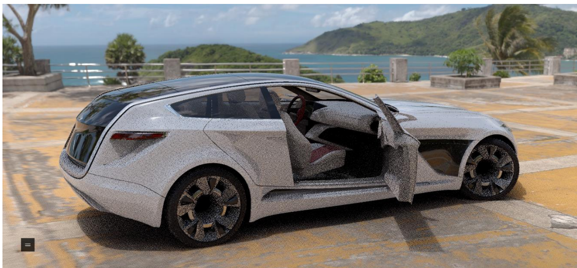
Obr. 14 Stream ve QHD rozlišení

Nejlépších výsledků zde z mého hlediska dosáhlo rozlišení Quad HD (QHD), kdy při manipulaci s modelem nedocházelo téměř k žádné latenci. Výsledný obraz měl přijatelnou kvalitu bez tendence kostičkování. Průměrné vytížení grafických karet bylo 8 % a maximální hodnota dosáhla 24 %. Výsledný stream v této kvalitě je zachycen na Obr. 14.