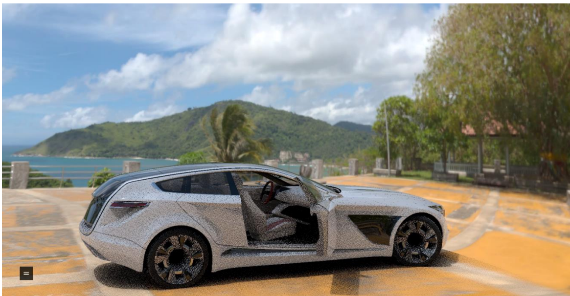
Obr. 13 Stream ve Full HD rozlišení

Nejvíce uživatelsky přívětivé nastavení bylo při použití Full HD rozlišení, kdy latence obrazu byla téměř nulová, zároveň také přijatelná hodnota FPS a přijímaný datový tok v rozmezí 18-20 Mb/s. Hodnota FPS je bohužel touto formou neměřitelná, nicméně si troufám říct, že jsme se pohybovali okolo 40 FPS. Co se týče vytížení grafických karet, průměrná hodnota ukazovala 16 % a maximální hodnota 30 %.