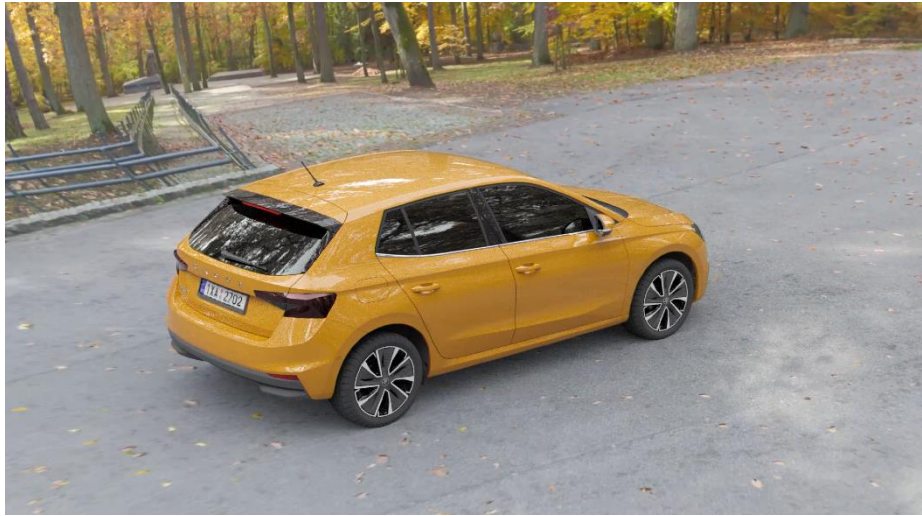
Obr. 16 VRUT QHD stream

Nejnižším testovaným rozlišením bylo již zmíněné Full HD. Při tomto rozlišení byl obraz naprosto plynulý a bez jakýchkoliv záseků nebo latence. I hodnota snímků za sekundu se pohybovala okolo přijatelných dvaceti FPS, což je ale ještě daleko od požadavku. Snížila se také náročnost na datový přenos, kdy přijímaný datový tok činil 17 Mb/s. Nižší rozlišení mělo samozřejmě negativní vliv na kvalitu obrazu, kdy nebyl model tak detailně vykreslen, jako ve vyšších rozlišeních. Vyrenderovaný model ve Full HD rozlišení je zachycen na Obr. 17. Procesory clusteru byly při renderování tohoto modelu vytíženy průměrně z 81 %.