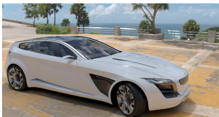
Obr. 2 CPU renderování