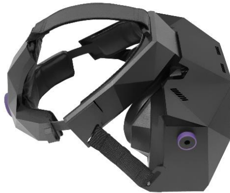
Obr. 6 XTAL 8K Headset [18]

Profesionální VR headsety XTAL od české firmy VRgineers jsou v podstatě jedny z nejlepších na světě. Model XTAL 5K má k dispozici dva 2K OLED displeje s celkovým