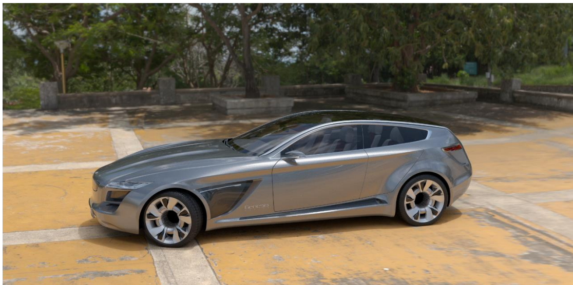
Obr. 19 VDI 4K stream

Při rozlišení 4K docházelo k velkým zásekům obrazu, které byly způsobeny zhruba dvou sekundovou latencí. Výhodou však bylo, že se obraz ani přes větší záseky nerozpadal a ani neměl tendenci kostičkování. Nicméně z uživatelského hlediska bylo toto rozlišení nepřijatelné, zejména kvůli malému počtu snímků za sekundu, které ukazovaly hodnotu 3 a způsobovaly tak horší plynulost streamu. Přijímaný datový tok na straně uživatele činil 25 Mb/s, což je víceméně totožné, jako u předešlých kodérů. Vyrenderovaný model v tomto rozlišení je znázorněn na Obr. 19.