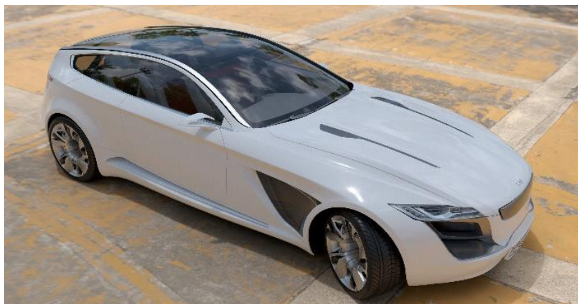
Obr. 4 Zapnutý ray tracing