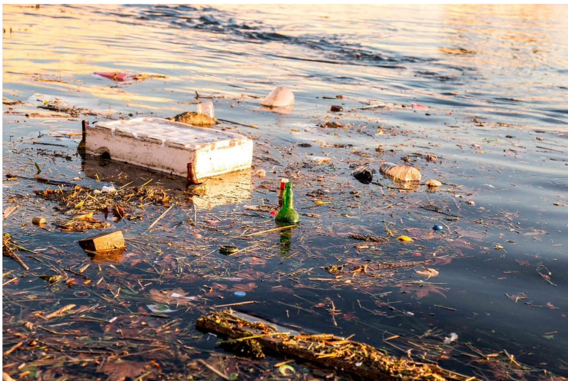
Obr. č. 3 Znečištěný rybník [27]

Bohužel, jednou z největších příčin znečišťování rybníků je stále člověk. Ne nadarmo se říká, že je člověk největší hrozbou sám sobě. Na obrázku číslo jedna lze vidět, jak lidská nátura může být bezohledná k životnímu prostředí [7].