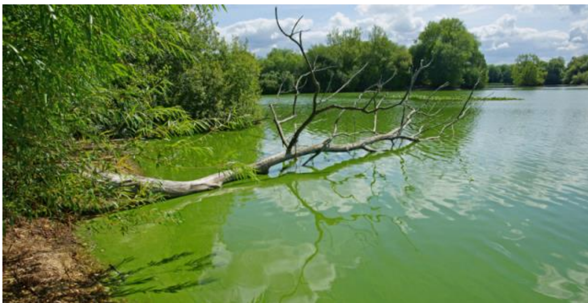
Obr. č. 2 Znečištění vody sinicemi [25]

Za poslední století se zhoršení kvality vody působení lidské činnosti stalo jedním ze zásadních problémů, které ovlivňují kvalitu života ve vodě a její využitelnost nejen pro rybářské účely, ale také pro účely hospodářské a rekreační. I když došlo za poslední desetiletí k výraznému zlepšení, tak i přes to zůstává znečištění problémem v řadě evropských řek a povodí [7].