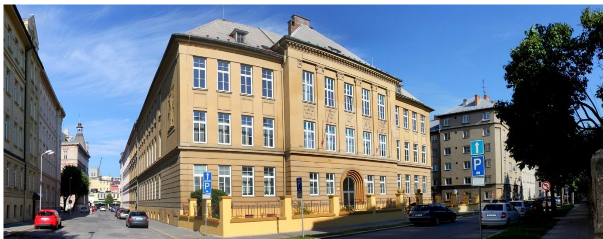
Příloha č. 4 – Budova Obchodní akademie Olomouc

(< oaol.cz. [online]. [cit. 2014-06-10]. Dostupné z http://www.oaol.cz/cs >.)