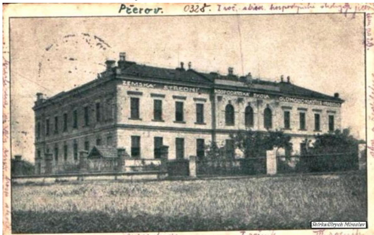
Příloha č. 3 – Zemská střední hospodářská škola (Střední škola zemědělská), rok 1922