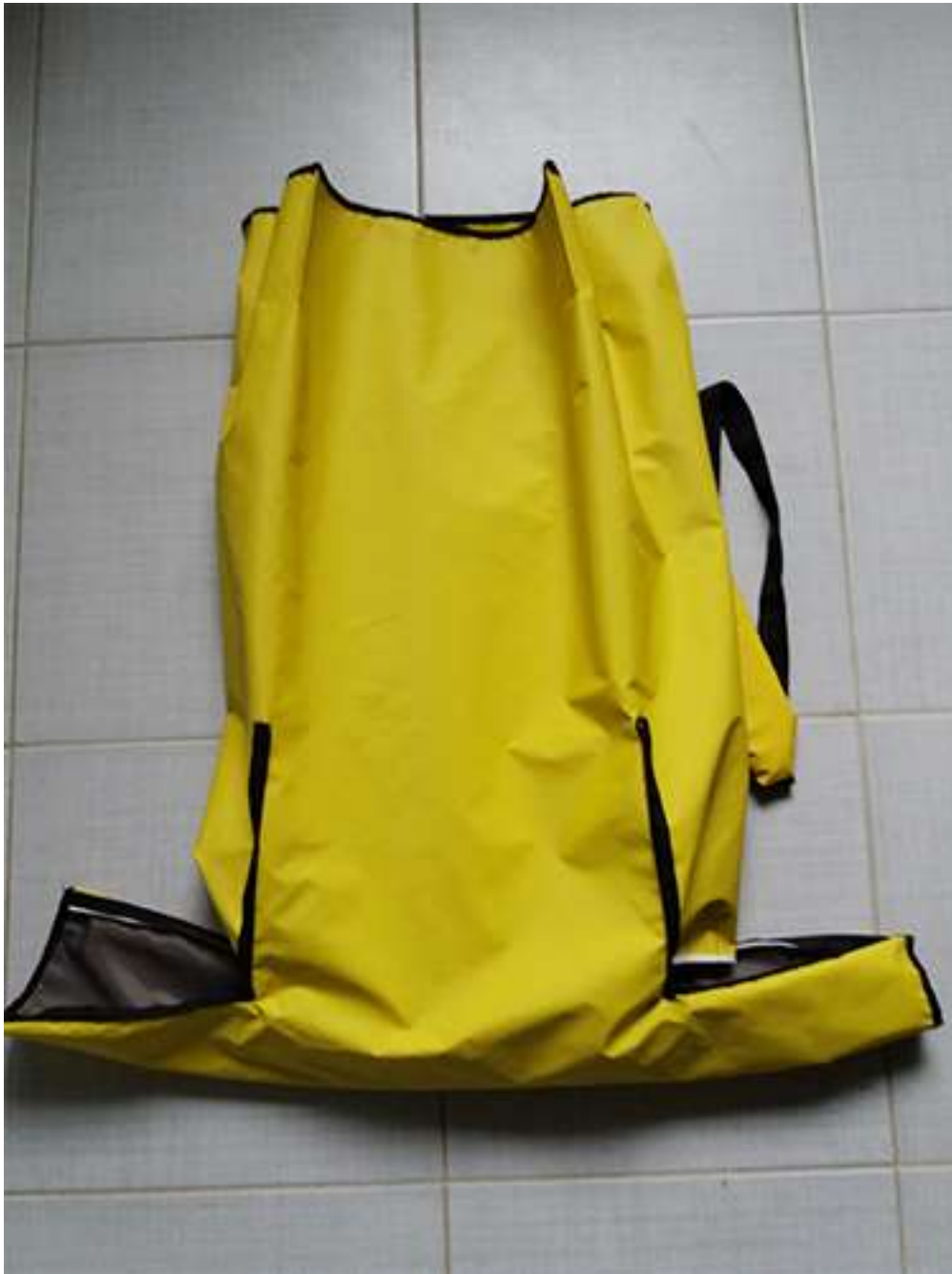
Obrázek 2 Rozkladací batoh, batohovina s PVC záterom, 47x30x20 cm, 2017