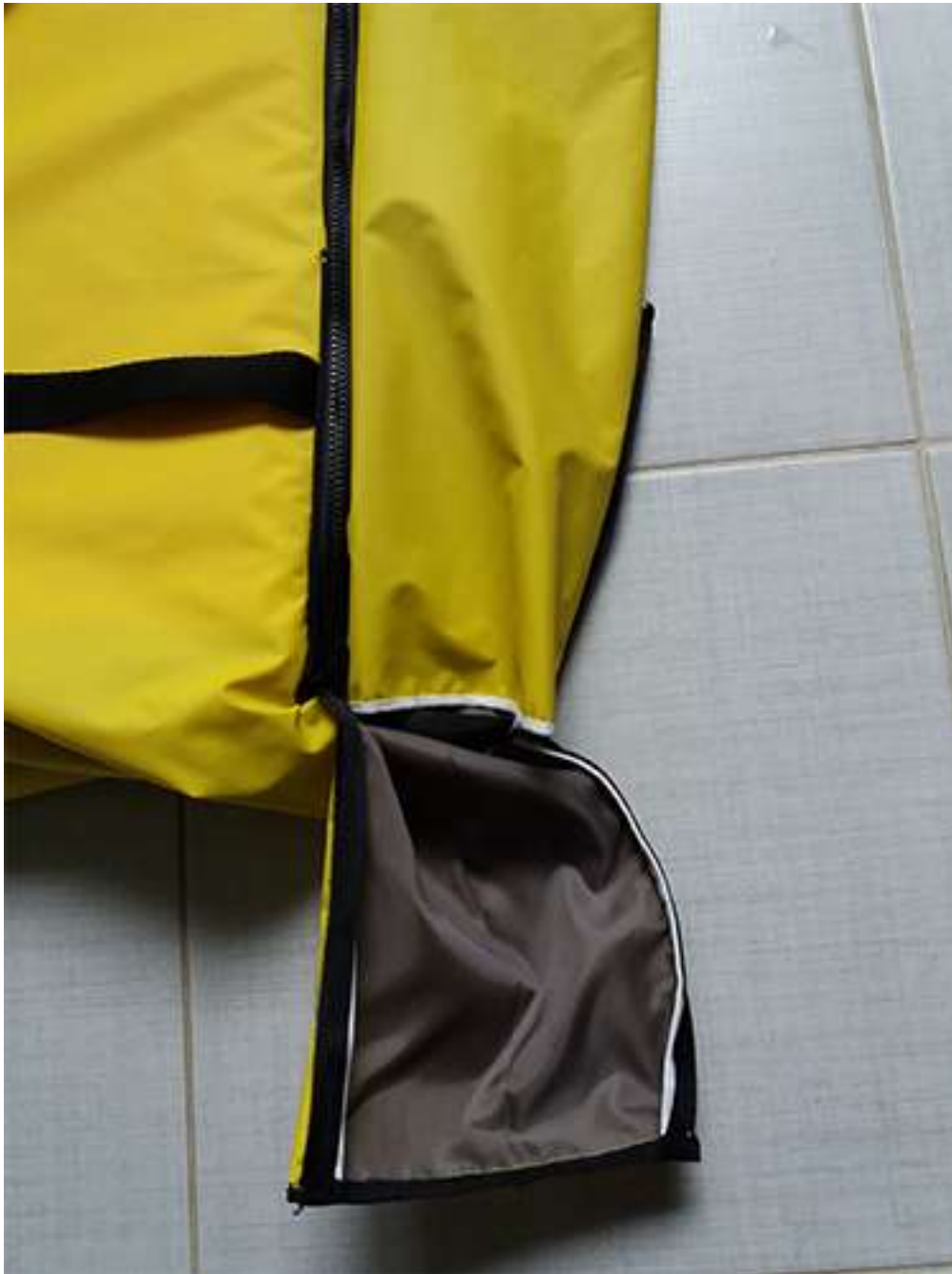
Obrázek 7 Rozkladací batoh, batohovina s PVC záterom, 47x30x20 cm, 2017