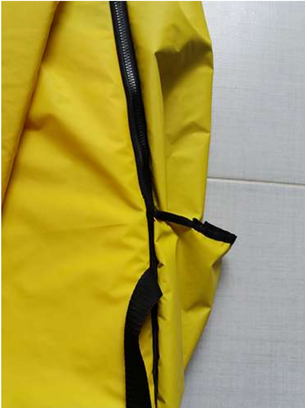
Obrázek 9 Rozkladací batoh, batohovina s PVC záterom, 47x30x20 cm, 2017