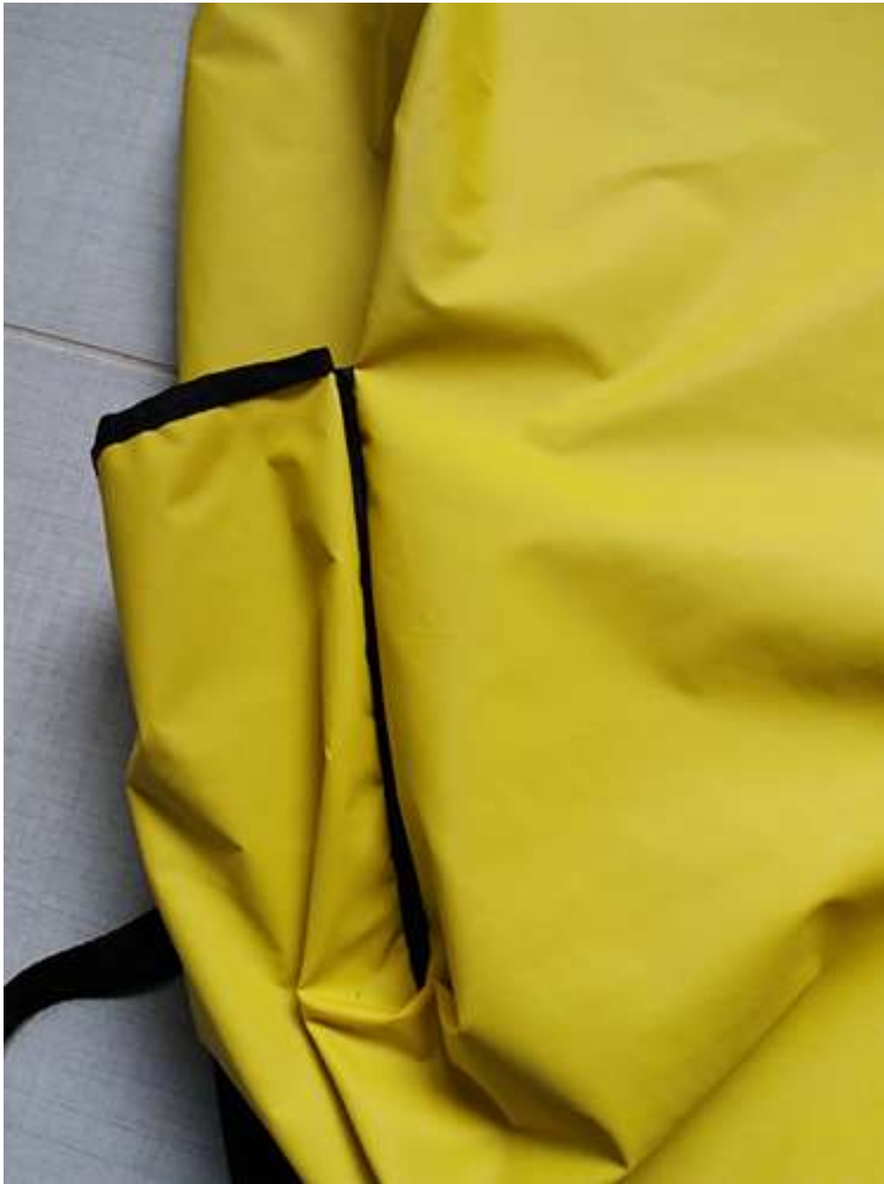
Obrázek 10 Rozkladací batoh, batohovina s PVC záterom, 47x30x20 cm, 2017