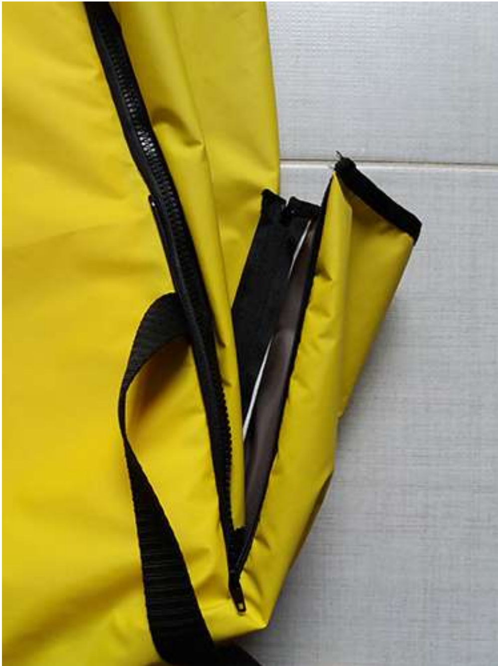
Obrázek 8 Rozkladací batoh, batohovina s PVC záterom, 47x30x20 cm, 2017