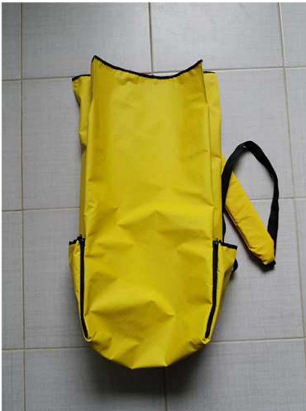
Obrázek 1 Rozkladací batoh, batohovina s PVC záterom, 47x30x20 cm, 2017