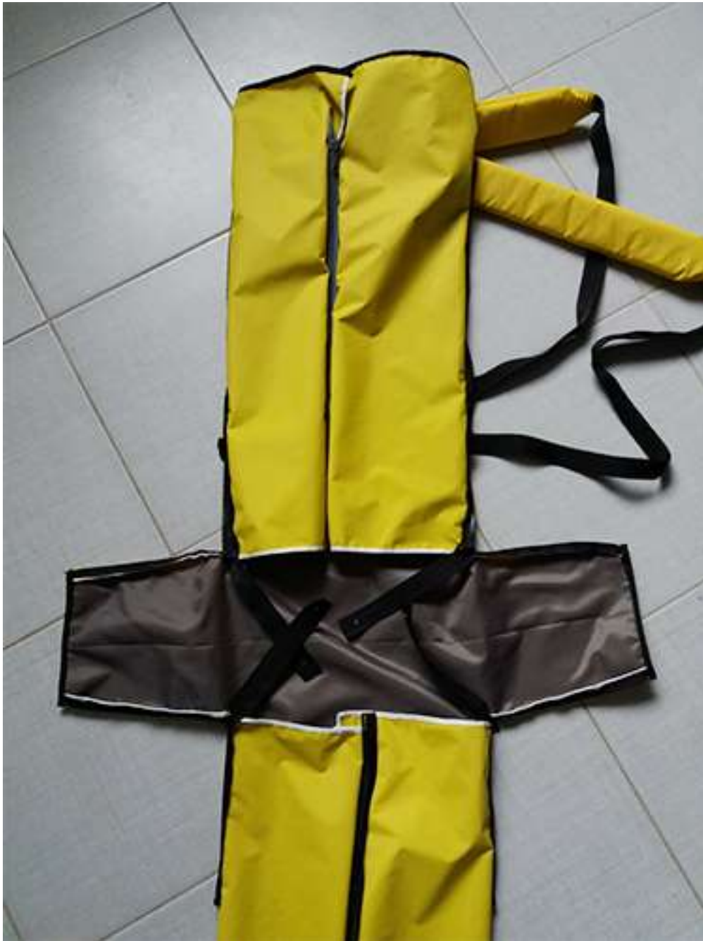
Obrázek 5 Rozkladací batoh, batohovina s PVC záterom, 47x30x20 cm, 2017