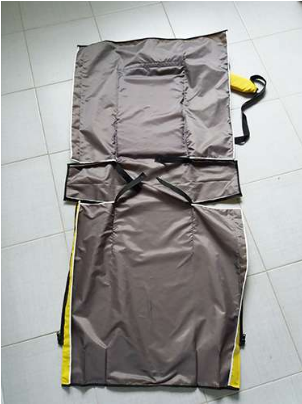
Obrázek 3 Rozkladací batoh, batohovina s PVC záterom, 47x30x20 cm, 2017