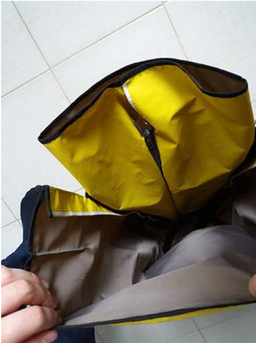
Obrázek 6 Rozkladací batoh, batohovina s PVC záterom, 47x30x20 cm, 2017