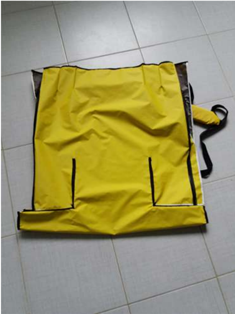
Obrázek 4 Rozkladací batoh, batohovina s PVC záterom, 47x30x20 cm, 2017