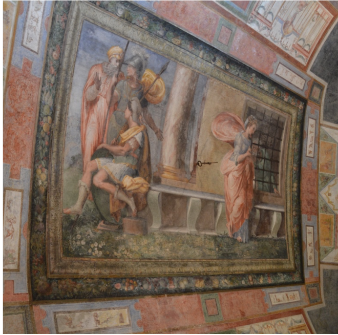
Obr. [12] Cimon se v zájmu přežití nechává kojit svou dcerou Pero Rytířský sál, zámek Nelahozeves, třetí čtvrtina 16. století. (vlevo), Cimon a Pero, Villa Doria, Janov, 30. léta 16. století.