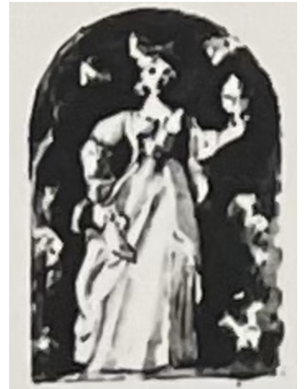
Obr. [30] Pošetilé Panny Franckreich, Severní fasáda zámku Nelahozeves, 60. léta 16. století. (vlevo), Grafická předloha Pošetilé Panny Franckreich, Virgil Solis. (uprostřed), Detail výzdoby fasády zámku Nelahozeves z roku 1822. (vpravo)