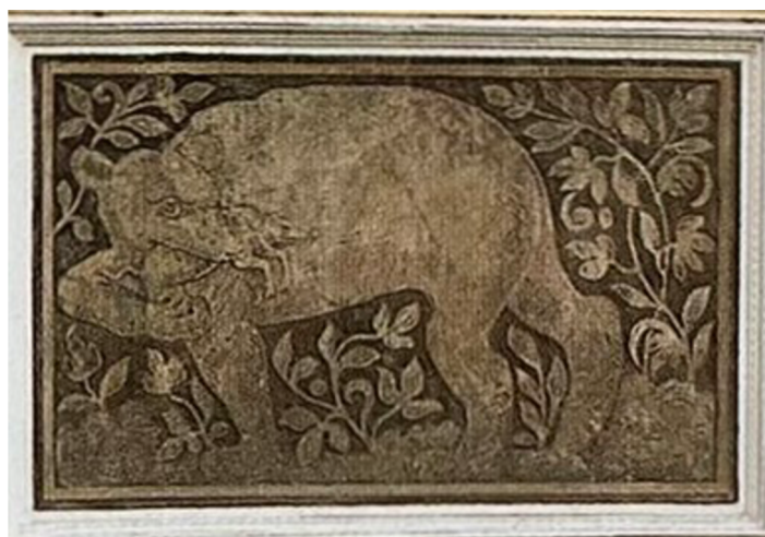
Obr. [33] Stěna západního křídla, Medvěd s hlodavcem v tlamě, Arcibiskupský palác Praha, 50. léta 16. století.