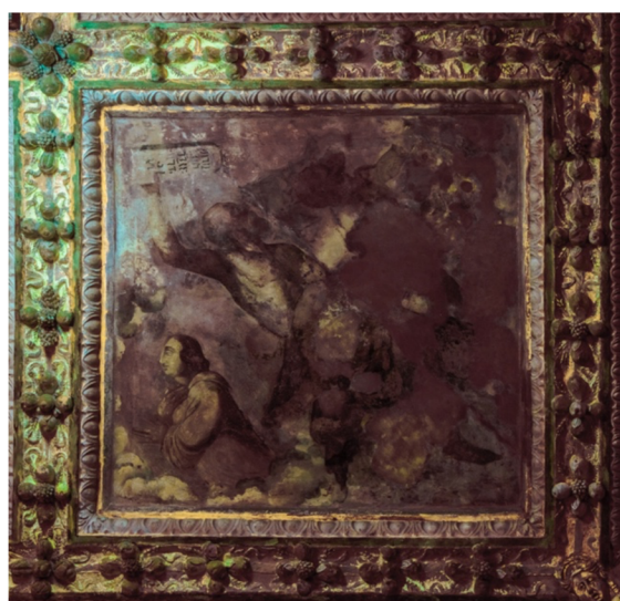
Obr. [19] UV snímek Bůh Otec (vlevo), Mojžíš (vpravo), Rytířský sál zámku Nelahozeves, třetí čtvrtina 16. století.