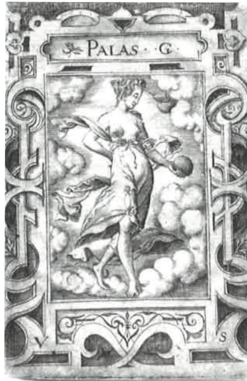
Obr. [24] Palas Athena, Severní fasáda zámku Nelahozeves, 60. léta 16. století. (vlevo), Grafická předloha Palas Athena, Virgil Solis.