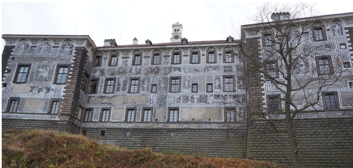
Obr. [22] Severní průčelí zámku Nelahozeves.