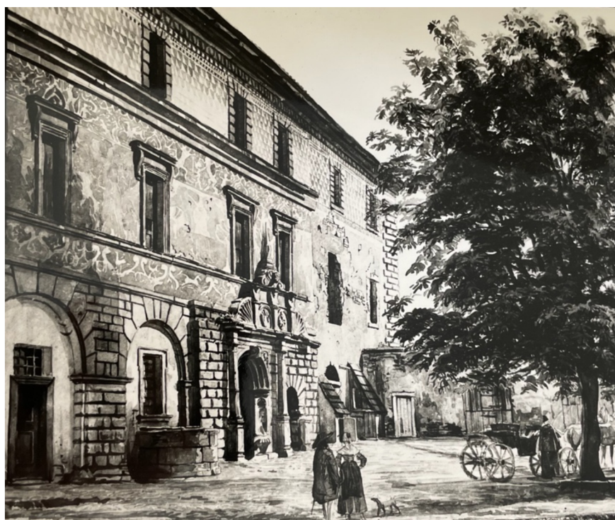
Obr. [21] Nádvoří zámku s portálem východního křídla od severozápadu, anonym z poloviny 18. století, akvarel.