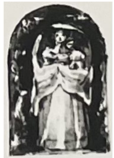
Obr. [31] Pošetilé Panny Flandern, Severní fasáda zámku Nelahozeves, 60. léta 16. století. (vlevo), Grafická předloha Pošetilé Panny Flandern, Virgil Solis. (uprostřed), Detail výzdoby fasády zámku Nelahozeves z roku 1822. (vpravo)