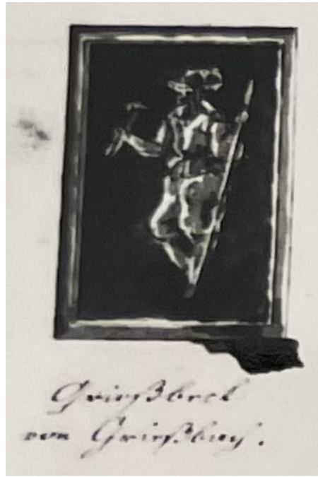
Obr. [34] Podobizna Floriana Gryspeka, Severní fasáda zámku Nelahozeves, 60. léta 16. století. (vlevo), Nákres podobizny Floriana Gryspeka zachycen na detaily výzdoby průčelí z roku 1822.