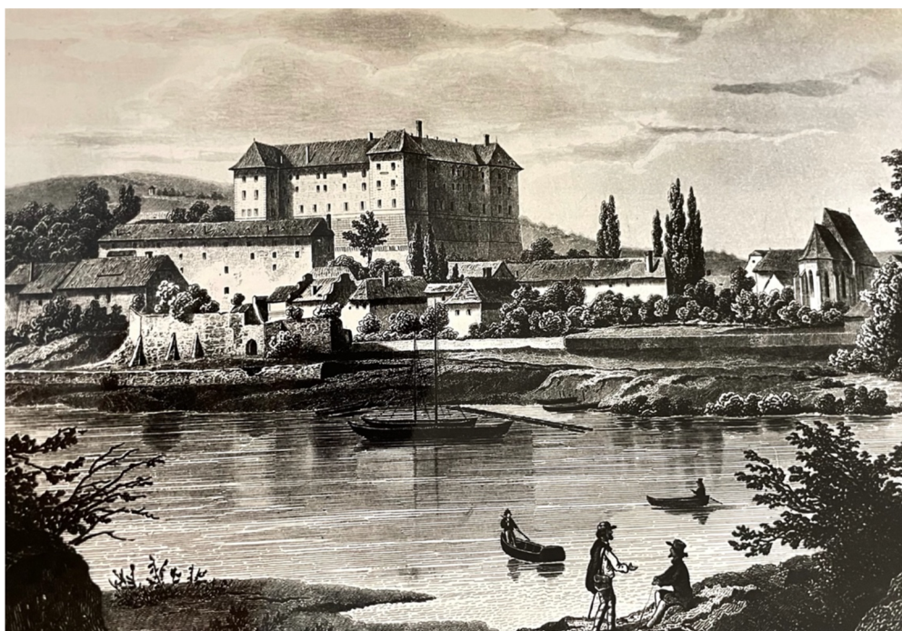
Obr. [9] Zámek Nelahozeves, veduta, mědirytina, pohled od východu, Německý rytec před polovinou 19. století.