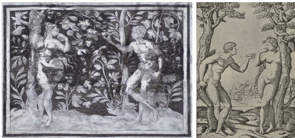
Obr. [27] Adam a Eva, Severní fasáda zámku Nelahozeves, 60. léta 16. století. (vlevo), Grafická předloha Adam a Eva, Marcantonio Raimondi podle Raffaela. (vpravo)