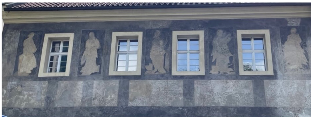
Obr. [5] Levá část horní etáže výzdoby severovýchodního průčelí domu v Jindřišské ulici čp. 974/II, soukromá škola Matouše Kollina, 2. polovina 16. století Jindřišské ulici čp. 974/II.