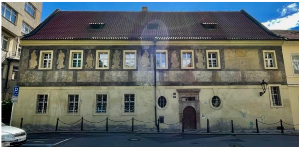
Obr. [3] Severovýchodní průčelí domu v Jindřišské ulici čp. 974/II, soukromá škola Matouše Kollina, 2. polovina 16. století.