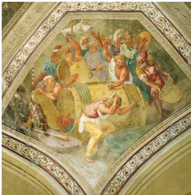
Obr. [13] Konzul Attilus Regulus je uvězněn Kartaginci v sudu pobytém uvnitř obrácenými hřeby Rytířský sál, zámek Nelahozeves, třetí čtvrtina 16. století. (vlevo), Konzul Attilus Regulus je uvězněn Kartaginci v sudu pobytém uvnitř obrácenými hřeby, Palazzo del Te, Mantova. (vpravo)