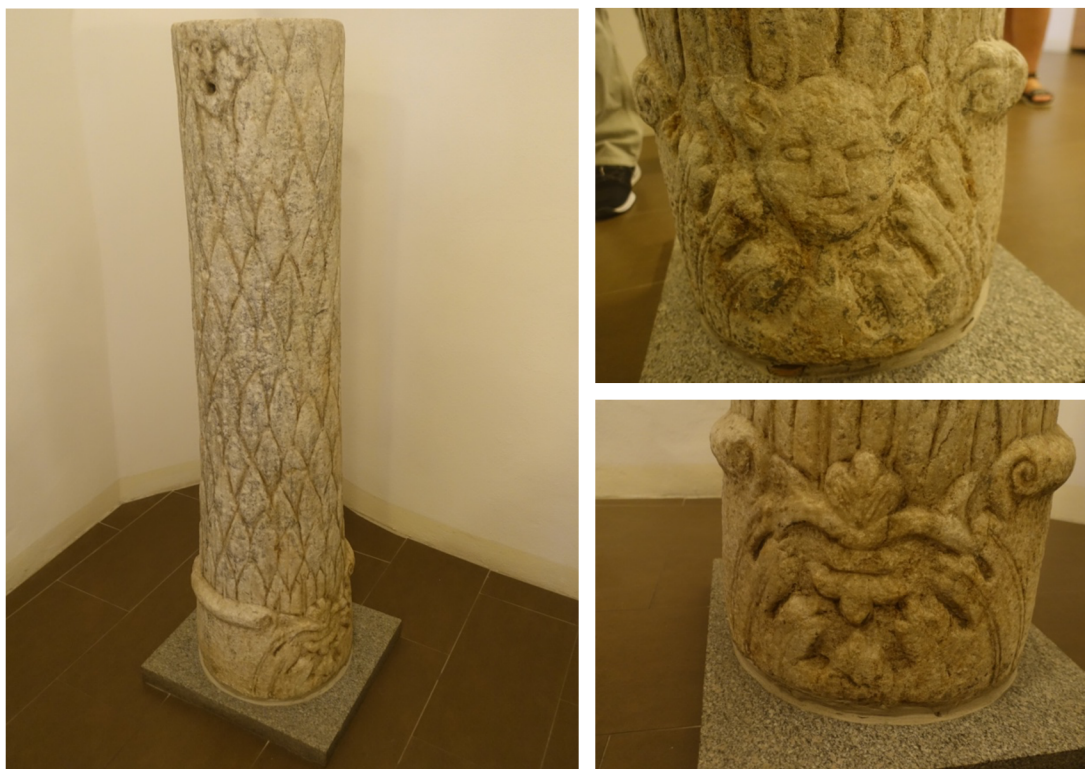
Obr. [8] Sloup Řepice, 2. polovina 16. století, v majetku Jana st. Hodějovského z Hodějova.