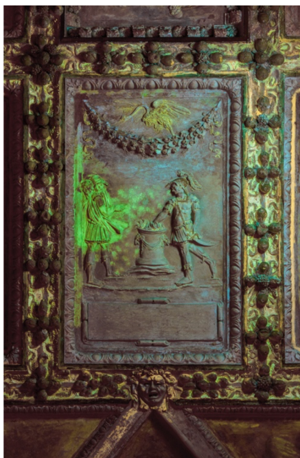
Obr. [14] Mucius Scaevola si před králem upaluje pravou ruku Rytířský sál, zámek Nelahozeves, třetí čtvrtina 16. století. (vlevo), UV snímek, Mucius Scaevola si před králem upaluje pravou ruku Rytířský sál, zámek Nelahozeves, třetí čtvrtina 16. století. (vpravo)