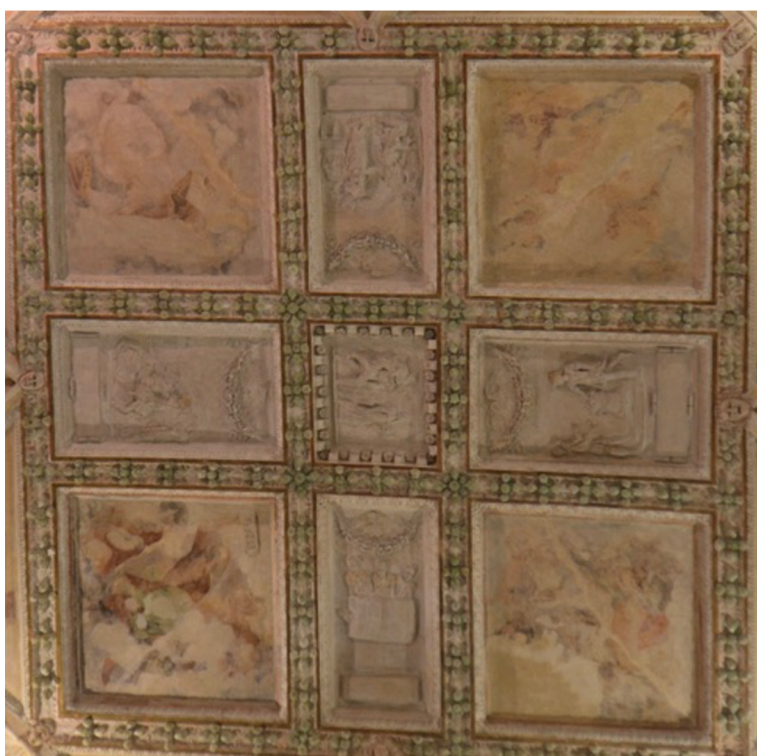
Obr. [11] Štukový rám stropu Rytířského sálu zámku Nelahozeves, třetí čtvrtina 16. století.