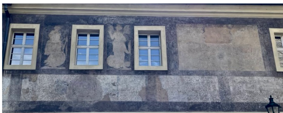
Obr. [6] Pravá část horní etáže výzdoby severovýchodního průčelí domu v Jindřišské ulici čp. 974/II, soukromá škola Matouše Kollina, 2. poloviny 16. století v Jindřišské ulici čp. 974/II.