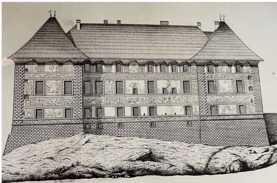
Obr. [20] Severní průčelí zámku Nelahozeves – návrh rekonstrukce, publikováno 1876.