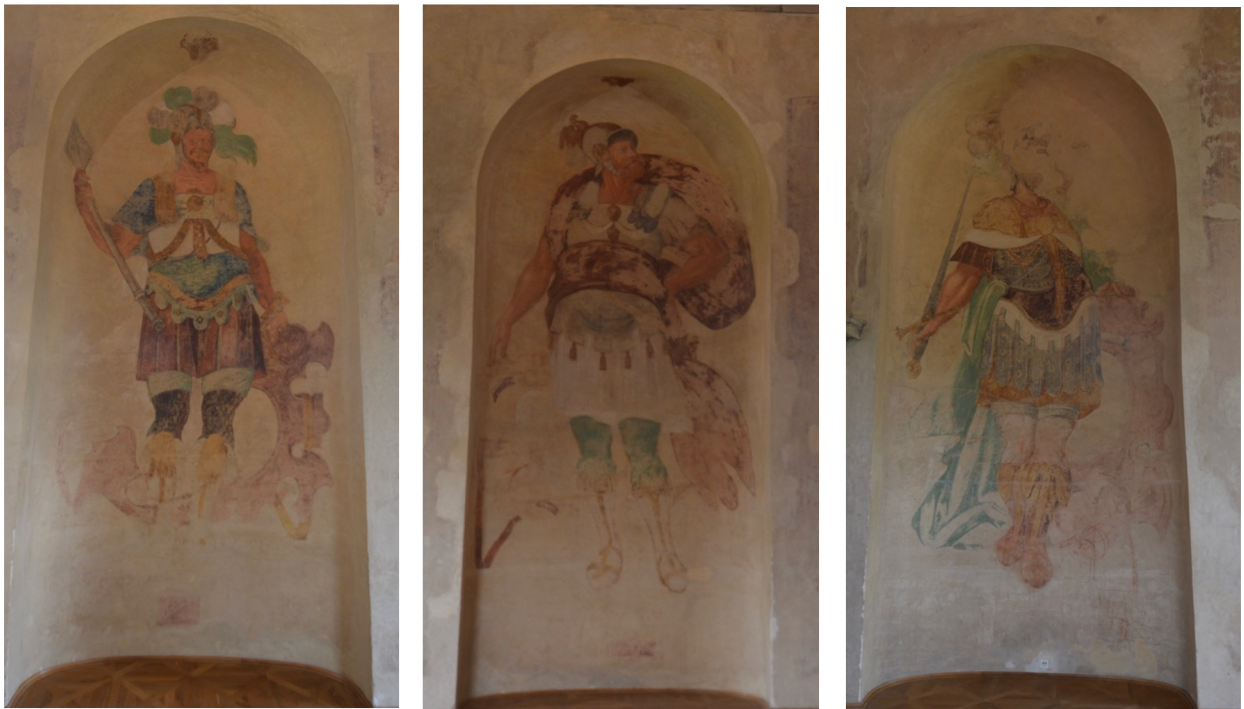
Obr. [16] Tři postavy antických válečníků Rytířský sál zámku Nelahozeves, třetí čtvrtina 16. století.