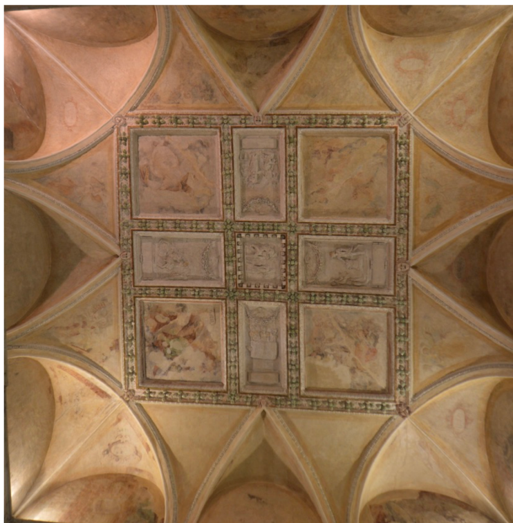
Obr. [10] Strop Rytířského sálu zámku Nelahozeves, třetí čtvrtina 16. století.