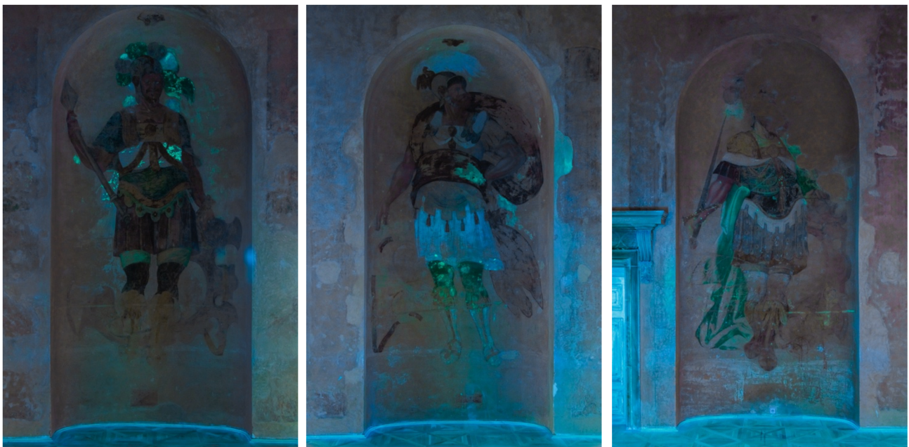
Obr. [17] UV snímek Tři postavy antických válečníků Rytířský sál zámku Nelahozeves, třetí čtvrtina 16. století.