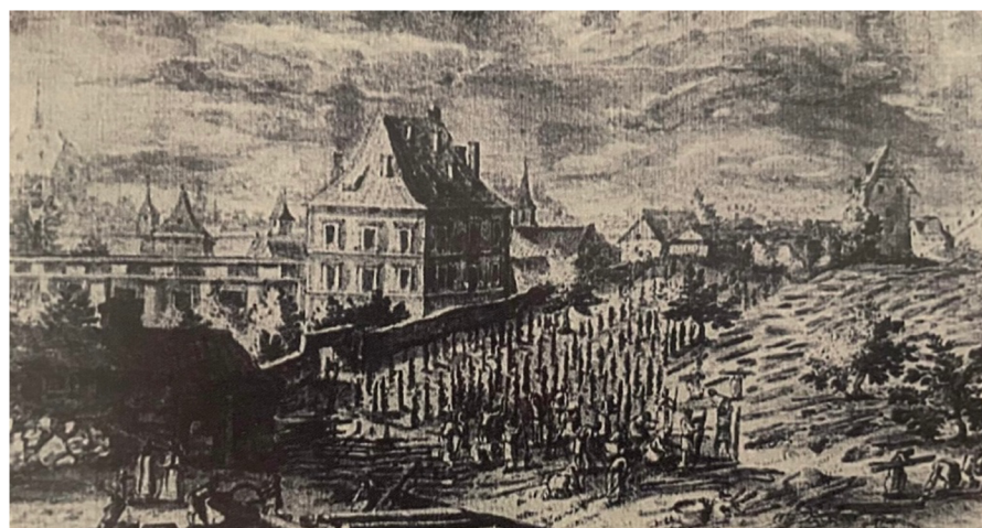
Obr. [7] Gryspekův dům v Karmelitské ulici, Kresba Aegidia Sadelera, 1540–1620.