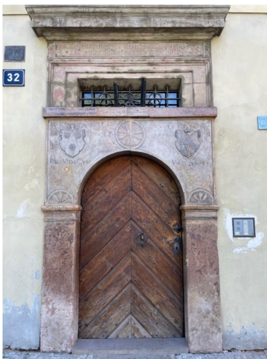
Obr. [4] Portál severovýchodního průčelí domu v Jindřišské ulici čp. 974/II, soukromá škola Matouše Kollina, 2. polovina 16. století domu v Jindřišské ulici, polovina 14. století.