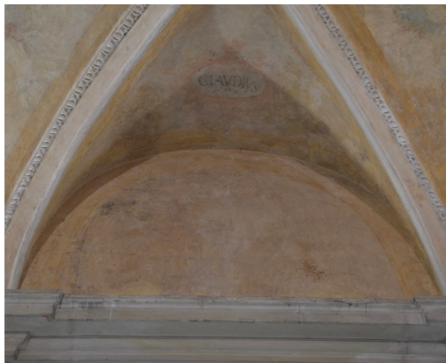
Obr. [15] Fragment lunetových výsečí, Domitianus (vlevo), Claudius (vpravo), Rytířský sál zámku Nelahozeves, třetí čtvrtina 16. století