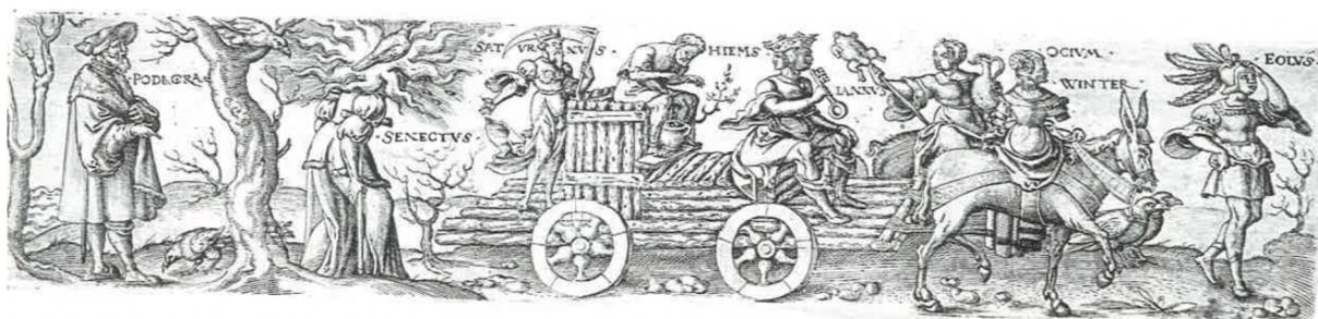
Obr. [23] Triumfální průvod zimy, Severní fasáda zámku Nelahozeves, 60. léta 16. století. (horní pás), Grafická předloha Triumfální průvod zimy, Virgil Solis (dolní pás).