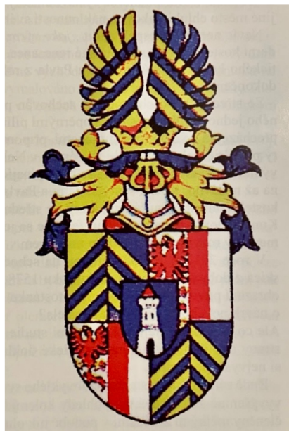
Obr. [1] Erb české větve rodu Gryspeků z Gryspachu.