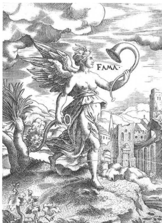
Obr. [25] Fáma / Sláva, Severní fasáda zámku Nelahozeves, 60. léta 16. století. (vlevo), Grafická předloha Fáma / Sláva, Virgil Solis. (vpravo)