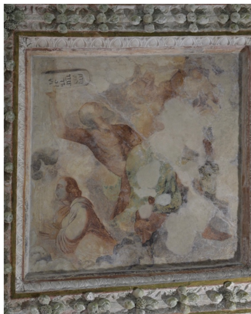
Obr. [18] Bůh Otec (vlevo), Mojžíš (vpravo), Rytířský sál zámku Nelahozeves, třetí čtvrtina 16. století.