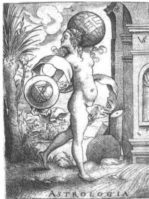
Obr. [29] Astronomie, Severní fasáda zámku Nelahozeves, 60. léta 16. století. (vlevo), Grafická předloha Astronomie, Virgil Solis. (vpravo)