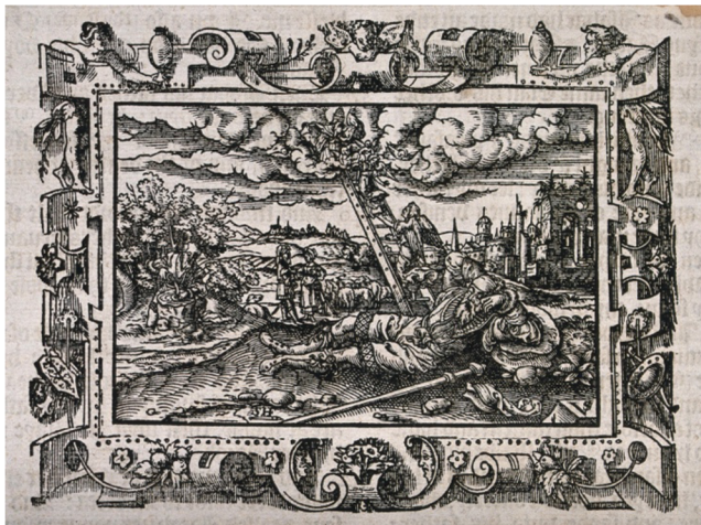
Obr. [32] Jákobův žebřík, stěna západního křídla Arcibiskupský palác Praha, 50. léta 16. století (vlevo) Grafická předloha Jákobův žebřík, Virgil Solis. (vpravo)