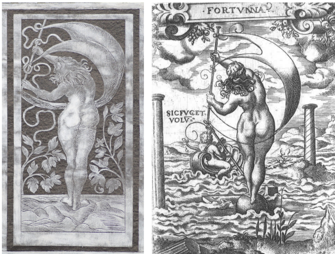
Obr. [26] Fortuna / Štěstí, Severní fasáda zámku Nelahozeves, 60. léta 16. století. (vlevo), Grafická předloha Fortuna / Štěstí, Virgil Solis. (vpravo)