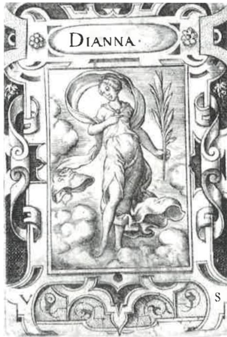
Obr. [28] Diana, Severní fasáda zámku Nelahozeves, 60. léta 16. století. (vlevo), Grafická předloha Diana, Virgil Solis. (vpravo)