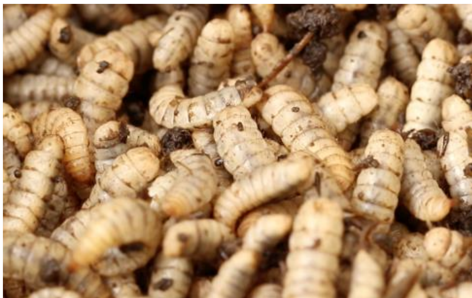
Obrázek 3 Larvy mouchy bráněnky

Mnoho studií odhalilo, že hmyzí moučky a olej mohou částečně nebo zcela nahradit rybí a sójové moučky a oleje, které se běžně používají v akvakultuře (Nogales-Merida et al. 2018). Hmyz, jako je bráněnka, byl intenzivně studován nejen v chovech ryb, ale také u drůbeže a prasat (Sogari et al. 2019). V akvakultuře odhalilo mnoho studií pozitivní výsledky, když byla moučka z bráněnek použita jako náhrada rybí moučky pro mnoho druhů, jako jsou například krevetka bělonohá ( Litopenaeus vannamei Boone, 1931), barramundi ( Lates calcarifer , Bloch, 1790), tilapie nilská ( Oreochromis niloticus Linnaeus, 1758) losos obecný ( Salmo salar , Linnaeus, 1758) jeseter sibiřský ( Acipenser baerii , Brandt, 1869) a pstruh duhový ( Oncorhynchus mykiss Walbaum, 1792) k produkci krmných ryb. U výše uvedených druhů bráněnka zlepšila různé růstové parametry i imunitní reakci na některé choroby postihující vodní druhy. Rovněž potemník moučný prokázal pozitivní výsledky při využití v dietě mnoha vodních druhů, jako je cejn velký ( Abramis brama , Linnaeus, 1758), okounek pstruhový ( Micropterus salmoides , Lacépède, 1802), mořčák evropský ( Dicentrarchus labrax Linnaeus, 1758) a pstruh duhový. Potemník moučný má poměrně vysokou nutriční hodnotu a je bohatým zdrojem esenciálních aminokyselin, lipidů a mastných kyselin, které se liší v závislosti na vývojovém stádiu larev (Shafique et al. 2021).