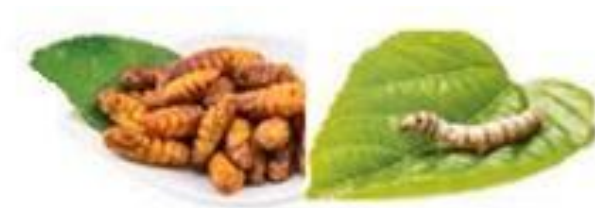
Obrázek 4 Larvy bource morušového (Alfiko 2021)