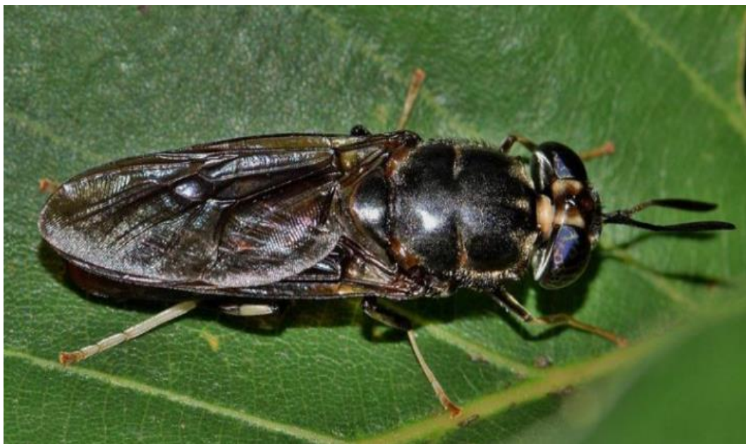
Obrázek 2 Moucha bráněnka ( https://www.poultryworld.net/ accesed 2020)

V důsledku toho byly některé z nich začleněny do receptur krmiv pro různé akvakulturní živočichy, což přineslo zajímavé výsledky. Mezi nejslibnější druhy hmyzu, jejichž moučka byla použita jako náhrada rybí moučky nebo rybího tuku, patří bráněnka, potemník moučný a moucha domácí (Belforti et al. 2015). Výše vyjmenované druhy mají dobře zdokumentované produkční procesy. Ačkoli je známo, že některé druhy hmyzu, jako například moucha domácí, jsou parazité a jsou přenašeči různých nemocí, jiné druhy, jako například bráněnka, jsou považovány za symbiotické, protože se mohou množit, aniž by způsobovaly jakoukoli známou újmu člověku nebo jiným živočichům (Menino a Murta 2021). Bráněnka a její larvy patří mezi nejdůležitější hmyz v oblasti krmiv (Mousavi 2020). Můžeme je vidět v obrázcích 2 a 3.