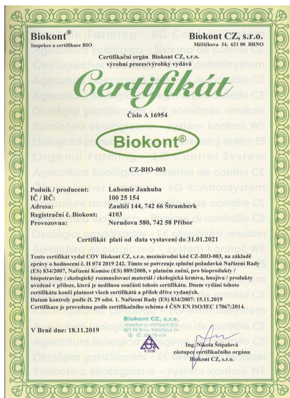
Obrázek č. 5.: Certifikát. Biokont CZ, s.r.o.