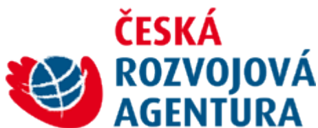
Obr. 2 Logo ČRA CZ.

Dalším cílem této agentury je prezentace a to jak v ČR, tak ve světě. Organizace spadá pod MZV ČR pod ekonomickou sekci. Logo ČRA slouží k propagaci ZRS ČR. Logo pro Českou republiku na Obrázku 2, logo pro světovou propagaci na Obrázku 3 (ČRA, 2014b).