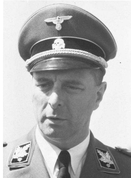
Hanns Albin Rauter 181