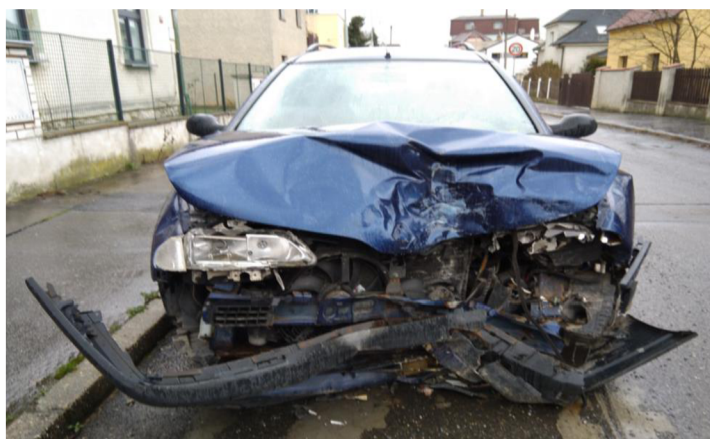
Obrázek č. 4 – VRAK