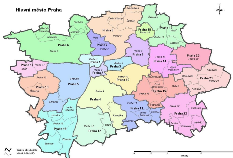
Obrázek č. 2 – Územní obvody hl. m. Prahy