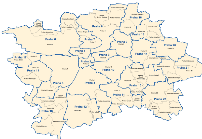
Obrázek č. 3 – Správní obvody hl. m. Prahy