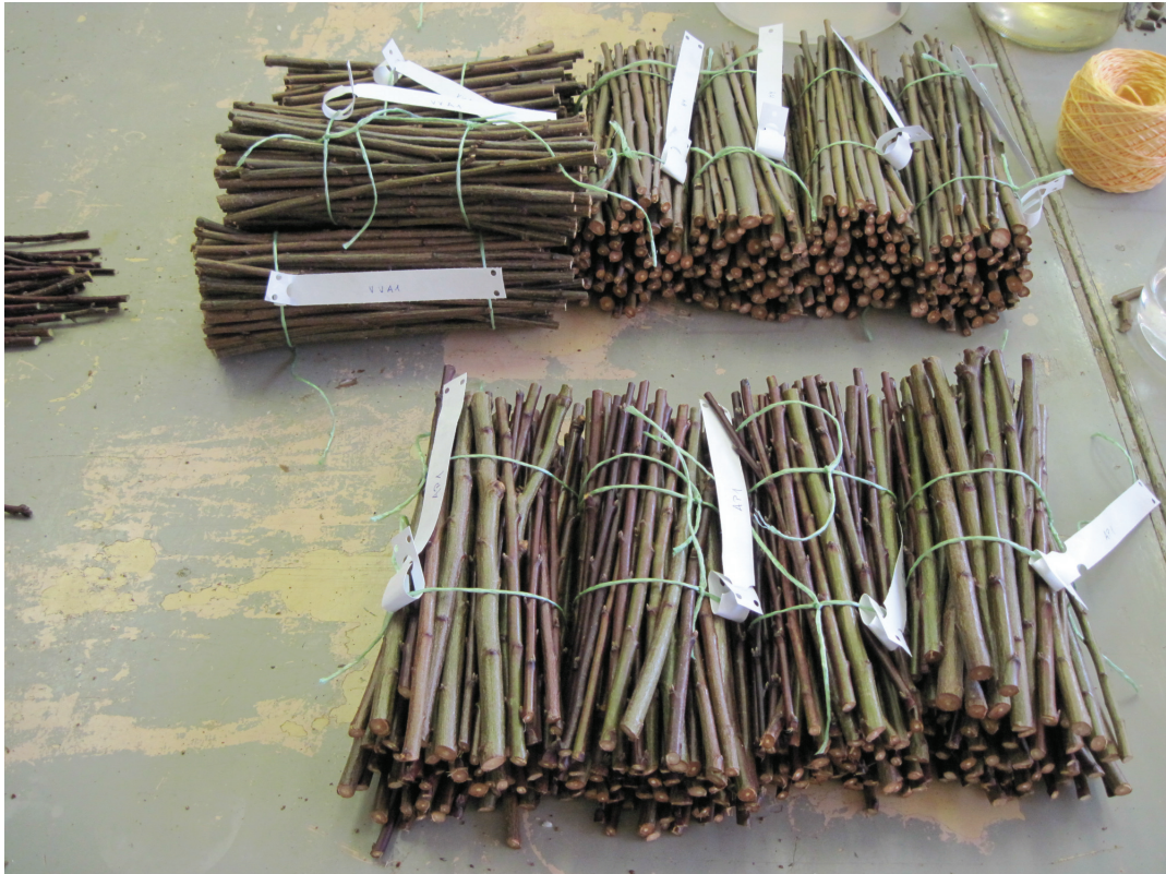
Obrázek P.1: Dřevité řízky nasvazkované podle variant