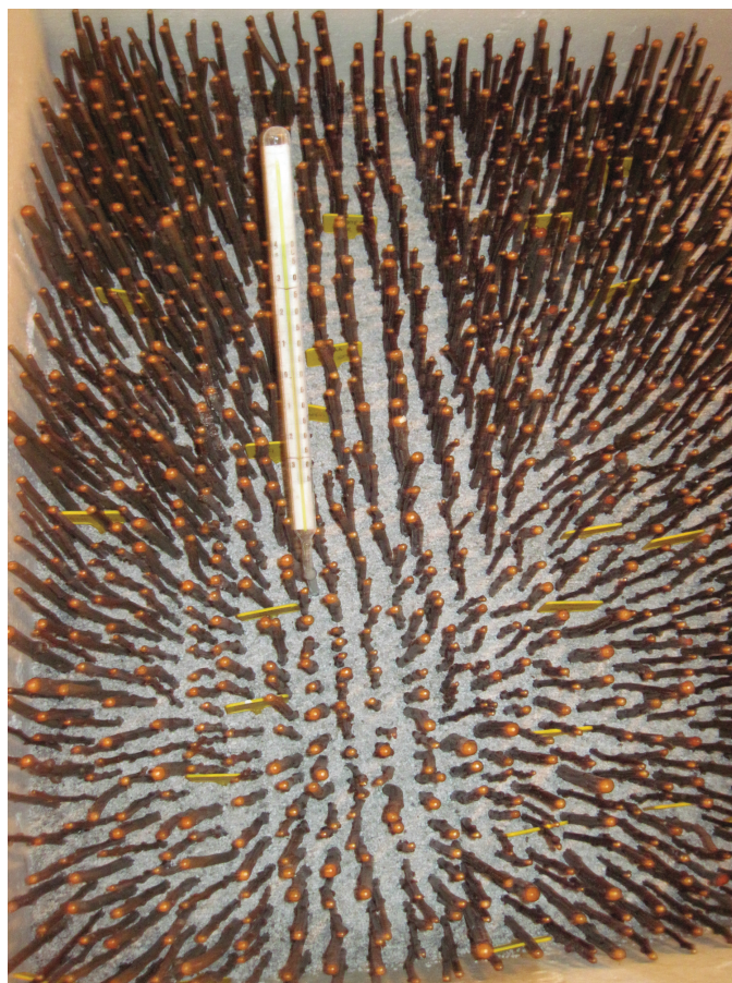
Obrázek P.6: Detail řízků ve stratifikační bedně