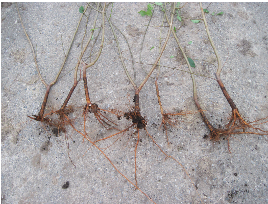
Obrázek P.14: Ukázka zakořenění – varianta IBA (pudr)/MY-KL-A