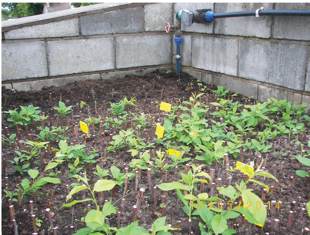
Obrázek P.12: Kontrola 16. 5. 2014