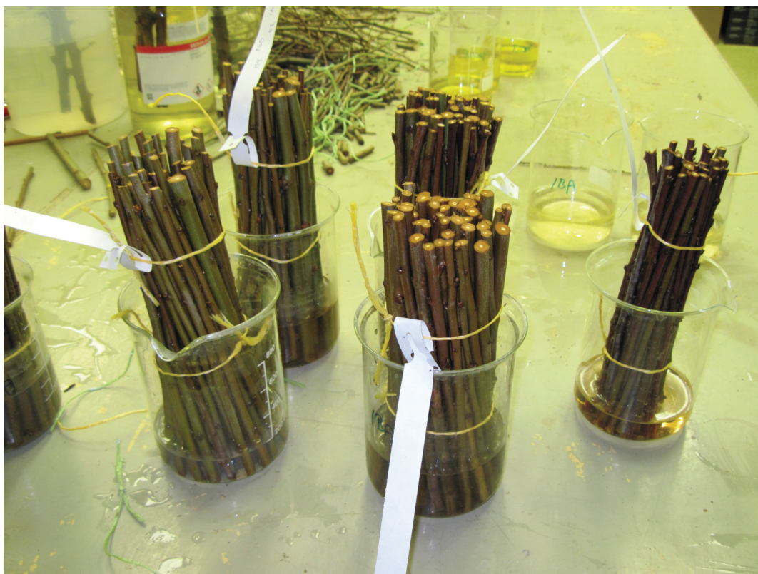
Obrázek P.4: Dřevité řízky namáčené do stimulátorů