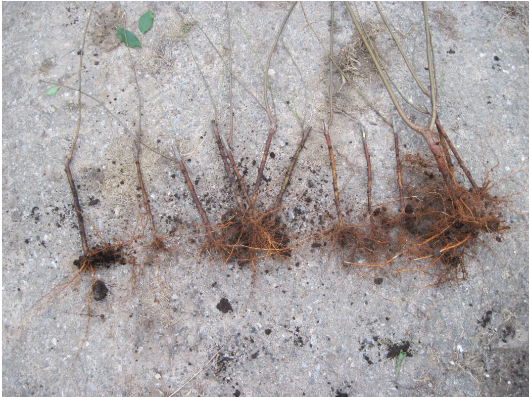
Obrázek P.15: Ukázka zakořenění – varianta IBA (pudr)/VVA-1