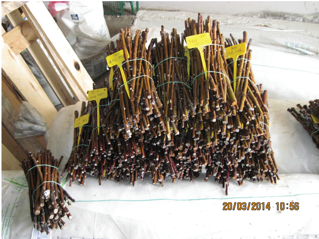
Obrázek P.9: Varianty nachystané na vyškolování