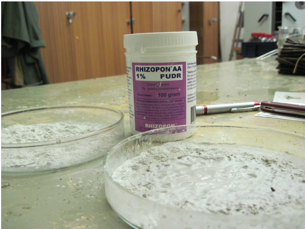
Obrázek P.2: Rhizopon AA (IBA pudr)