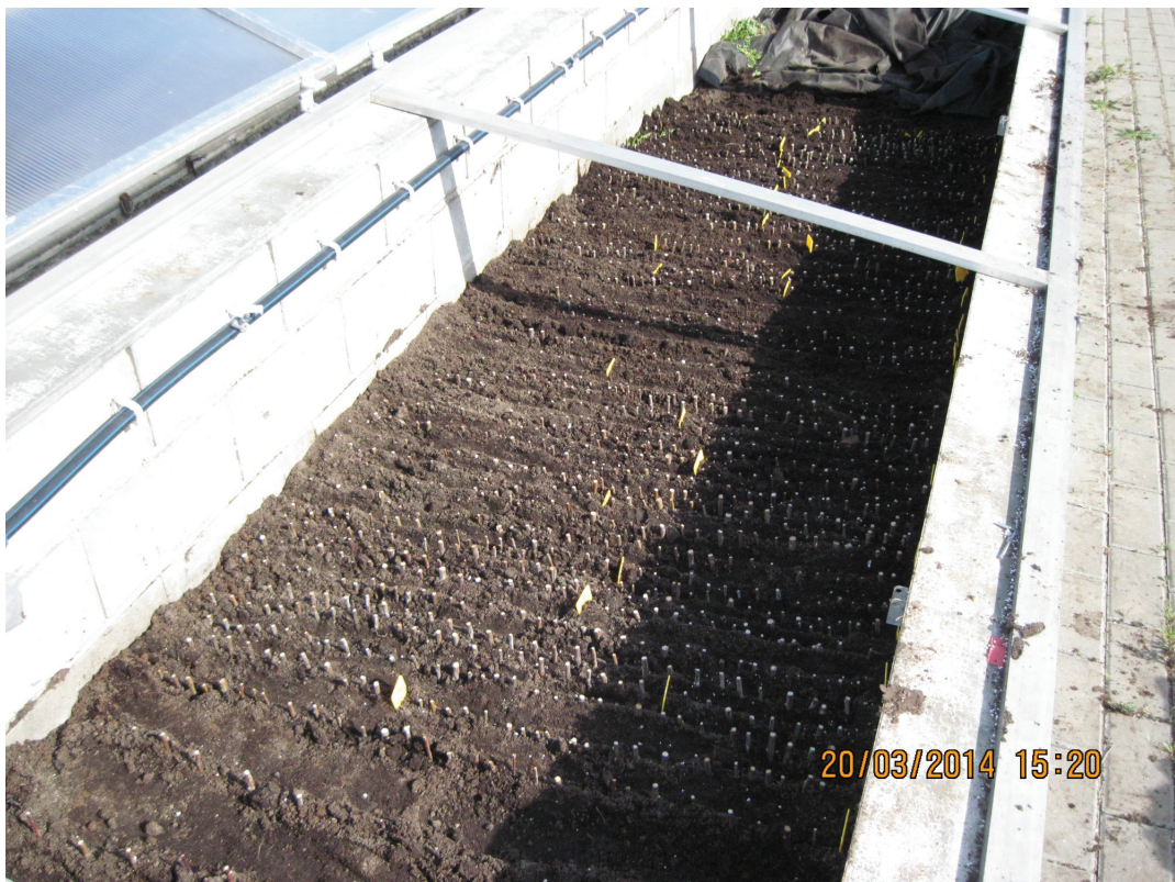
Obrázek P.10: Vyškolované řízky v pařeništi