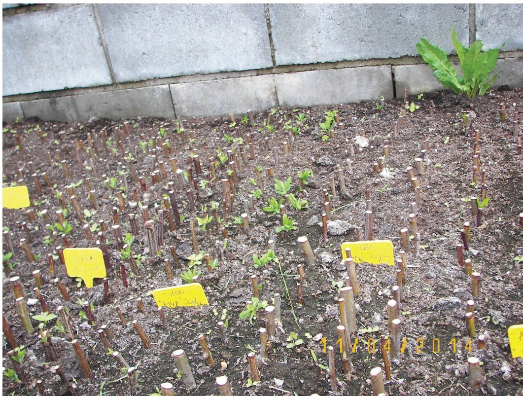
Obrázek P.11: Rašení (11. 4. 2014)