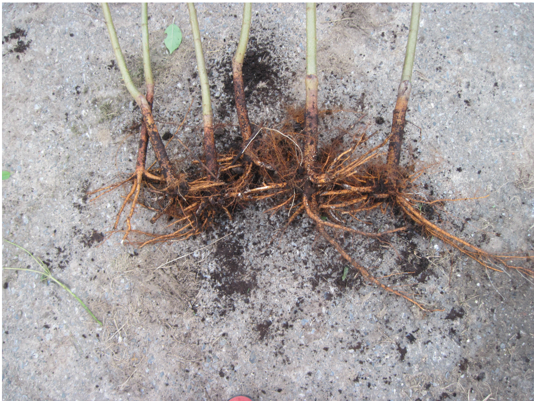
Obrázek P.16: Ukázka zakořenění – varianta IBA (pudr)/AP-1