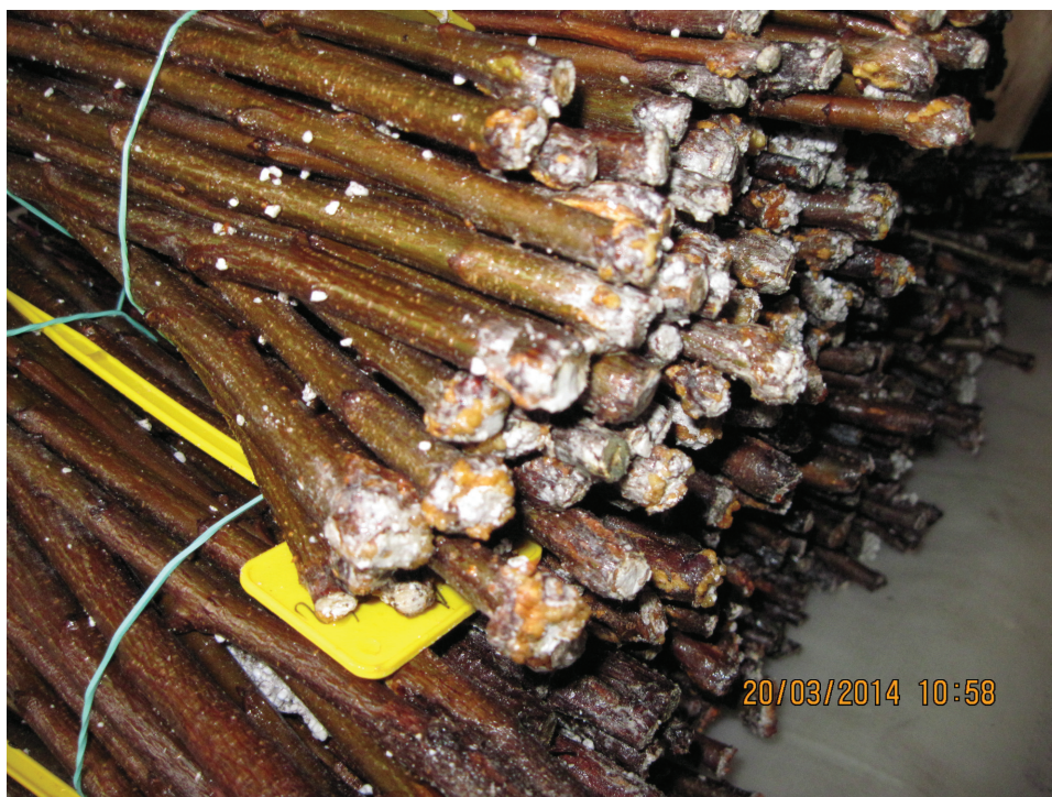
Obrázek P.7: Zakalusení řízků