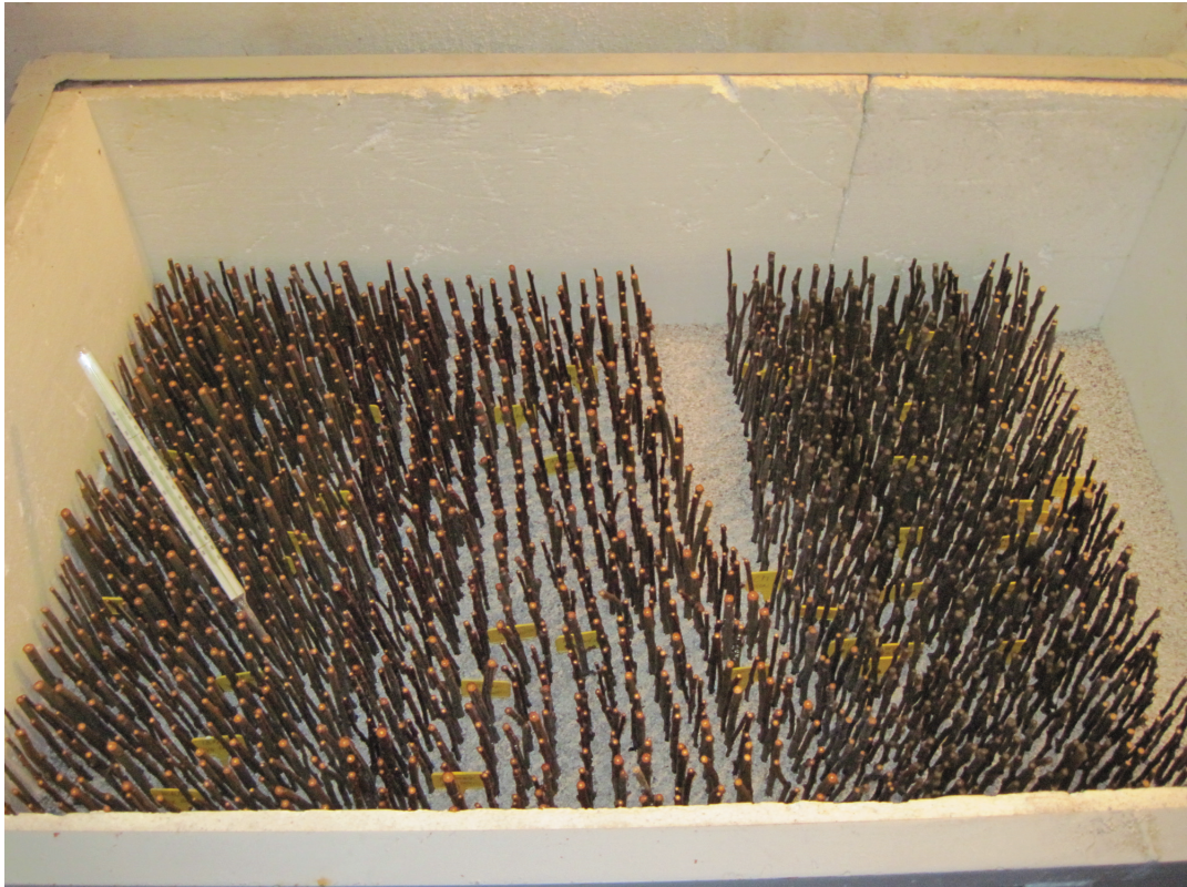
Obrázek P.5: Řízky založené ve stratifikační bedně