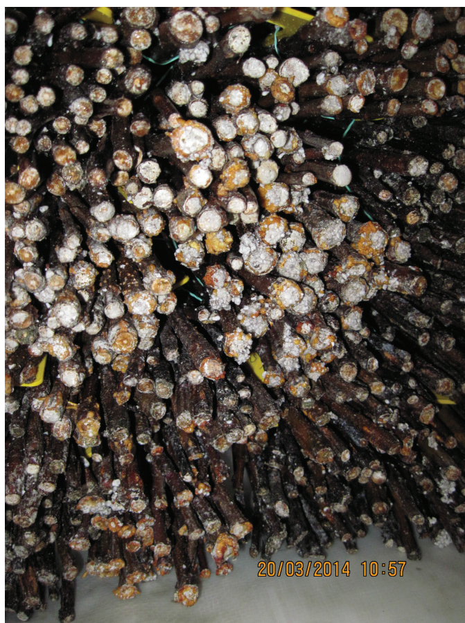
Obrázek P.8: Ukázka zakalusení