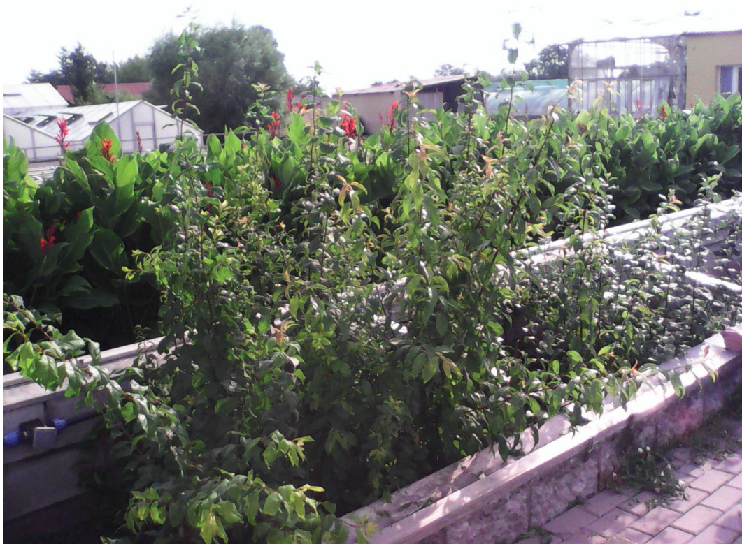
Obrázek P.13: Kontrola 6. 8. 2014