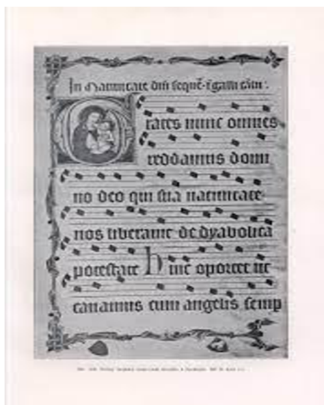
X. Ukázka z kancionálu Arnošta z Pardubic