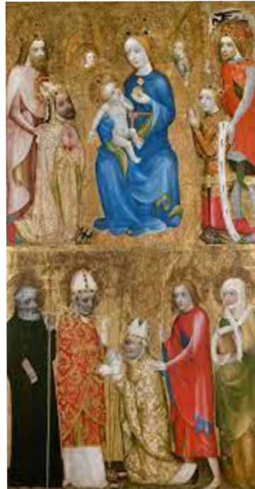
III. Votivní obraz Jana Očka z Vlašimi