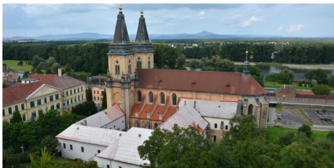
VI. Bývalý klášter v Roudnici nad Labem