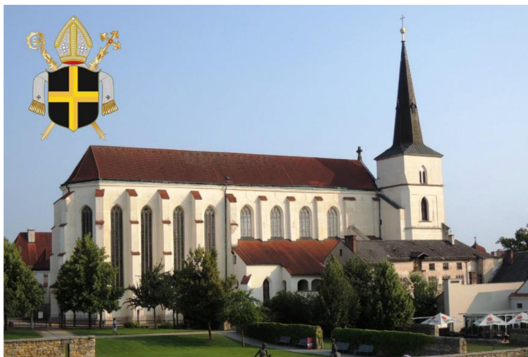
XII. Bývalý augustiniánský klášter v Litomyšli s kostelem Povýšení sv. Kříže