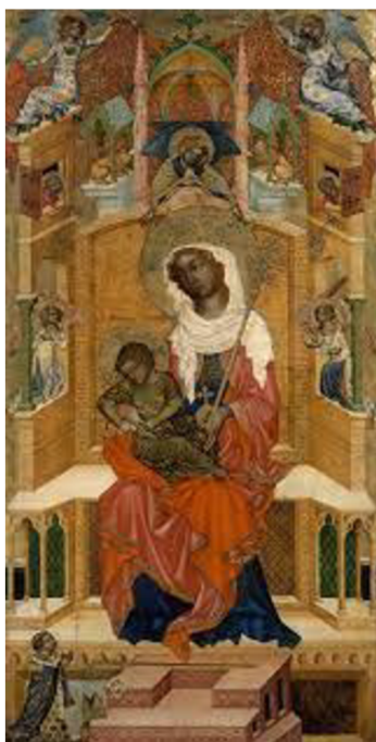
IX. Obraz Kladská Madona