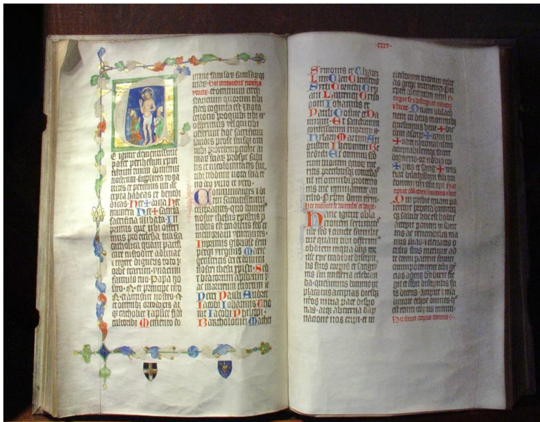
XI. Ukázka z pontifikálu Alberta ze Šternberka