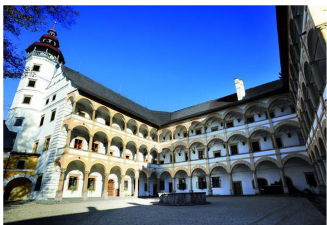
VII. Bývalý augustiniánský klášter ve Šternberku