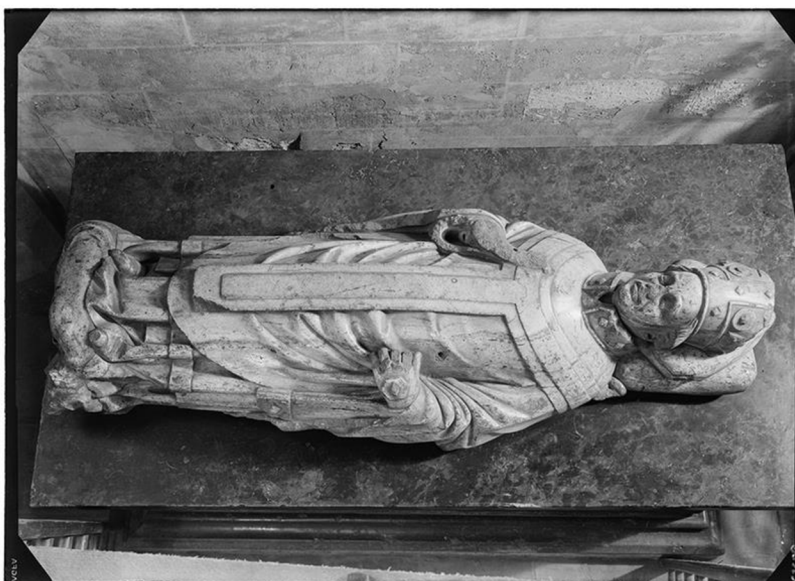
XIII. Tumba Jana Očka z Vlašimi v chrámu sv. Víta (Parléřovská hut')