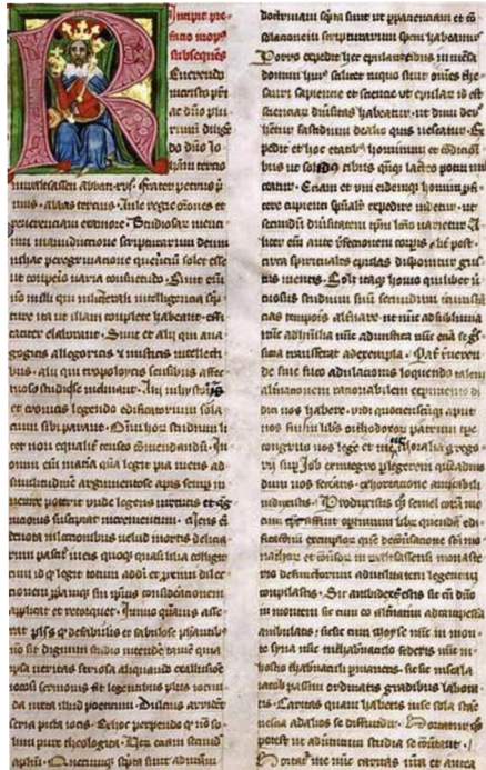
II. Miniatura krále Václava II. ve Zbraslavské kronice