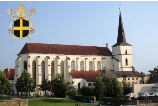
XII. Bývalý augustiniánský klášter v Litomyšli s kostelem Povýšení sv. Kříže