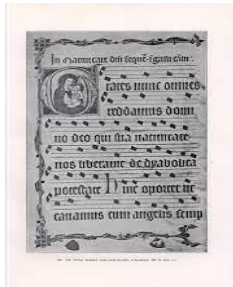
X. Ukázka z kancionálu Arnošta z Pardubic