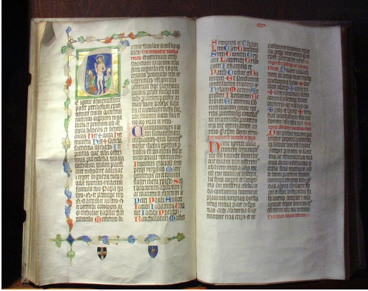
XI. Ukázka z pontifikálu Alberta ze Šternberka