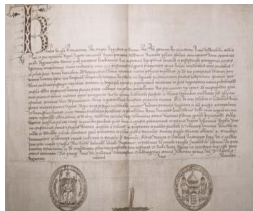
V. Zakládací listina Karlovy univerzity