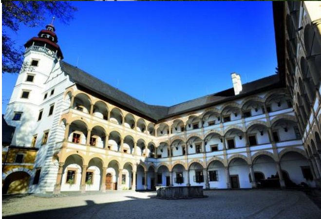
VII. Bývalý augustiniánský klášter ve Šternberku