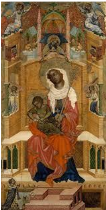
IX. Obraz Kladská Madona