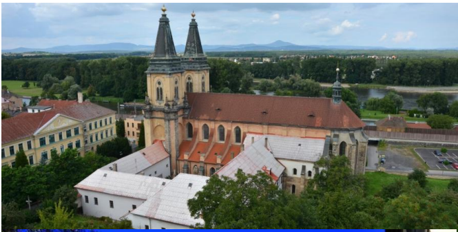
VI. Bývalý klášter v Roudnici nad Labem