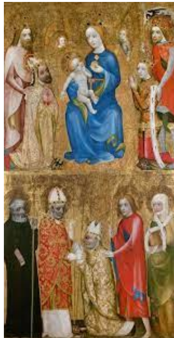
III. Votivní obraz Jana Očka z Vlašimi