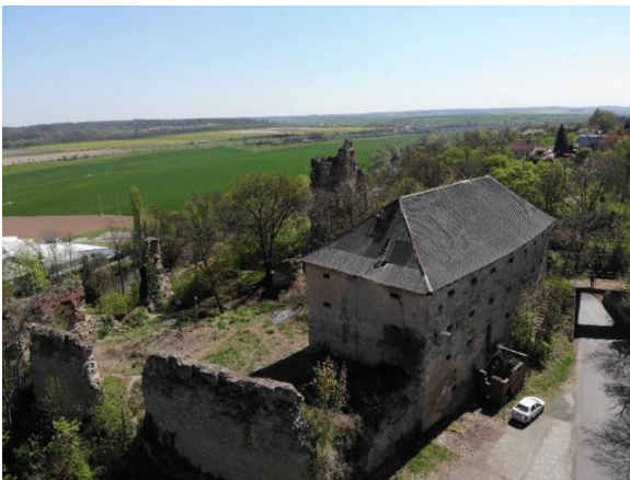
IV. Zřícenina hradu Dražice