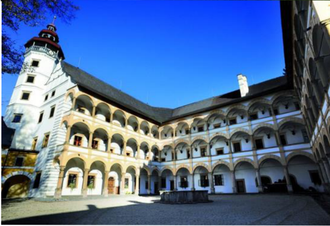
VII. Bývalý augustiniánský klášter ve Šternberku