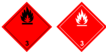
Obr. 1.3 Horľavé a kvapálne látky

Benzín, nafta, toulén, farbivá, lepidlá, laky, lakové farby, náterové roztoky, horľavé kvapalné pesticídy, uhľovodíky, alkoholické nápoje vo väčšom balení, uhľovodíky, étery, aldehydy, ketóny, výrobky z ropy a ďalšie