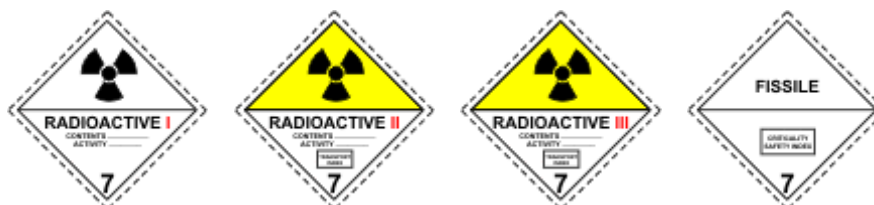
Obr. 1.11 Rádioaktívny materiál

Zdroj: [2] MÁLEK, Zdeněk a Miroslav TOMEK. Logistika přeprav nebezpečných věcí. Zlín: Univerzita Tomáše Bati, 2011. ISBN 978-80-7454-131-5.