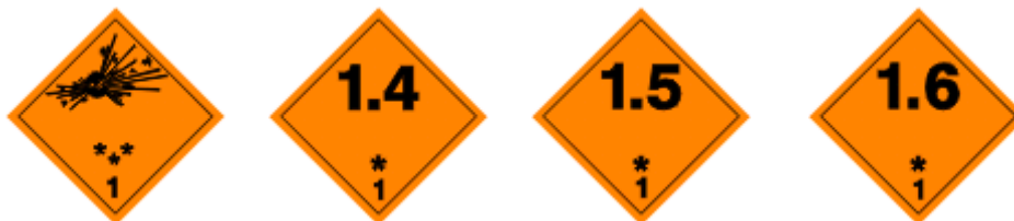
Obr. 1.1 Výbušné látky a predmety

dusičnan amónny, dusičnan močoviny, nitroglycerín, nitromočovina, ohňostrojové telesá, rôzne výbušniny, trhaviny, rozbušky, palivo do raketových motorov, hnacie náplne, pyrotechnické predmety a ďalšie.