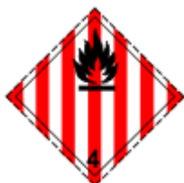
Obr. 1.4 Látky náchylné na samovoľné horenie, Horľavé tuhé látky

Bezpečnostné zápalky, síra, filmy na báze nitrocelulózy, celuloid, naftalén, červený fosfor, kaučuk, vodou navlhčené výbušné látky, zmesi nitrovanej celulózy a ďalšie