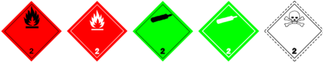
Obr. 1.2 Plyny, Zdroj

Dusivé, horľavé, jedovaté a žieravé plyny, aerosólové rozprašovače, malé nádrže obsahujúce plyny (plynné bombičky) adsorbované plyny a ďalšie