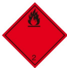
Obr. 1.14 Bezpečnostná značka pre triedu 2

Zdroj: [6] ADR – Bezpečná doprava nebezpečných vecí po silnici (CZ), Kolektív autorov, Vydávateľstvo – Bertlesman