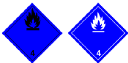
Obr. 1.6 Látky ktoré pri styku s vodou vyvíjajú horľavé plyny

Sodík, draslík, vápnik, cézium, lítium, rubídium, báryum, prášky lítia, hliníka, zinku, horčíka, karbidy vápnika a hliníka a ďalšie