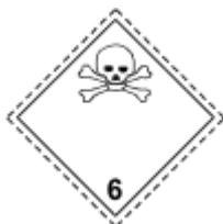
Obr. 1.9 Jedovaté látky

Kyanovodík a jeho roztoky, anilín, izokyanáty, fenol, zlúčeniny ortuti, selénu, osmia, vanádu, olova antimónu, bária, kadmia, tália, berýlia, fluoridy rozpustné vo vode, kvapalné a tuhé pesticídy, jedovaté tuhé a kvapalné farby a ďalšie