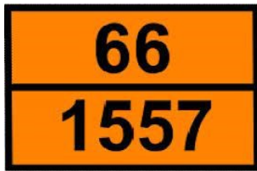
Obr.1.15 Príklad označenia vozidla identifikačným číslom nebezpečnosti.

Identifikačné číslo látky - UN - číslo je vždy štvormiestne a označuje konkrétnu látku podľa zoznamu OSN. Musí byť spoločne s identifikačným číslom nebezpečnosti uvedené na každom vozidle, používanom pre prepravu látok, ktoré spadajú do zoznamu látok, ktorých preprava sa riadi podľa ADR alebo RID. Príklad označenia vozidla prevážajúceho nebezpečnú látku, konkrétne s identifikačným číslom 1203 (benzín)