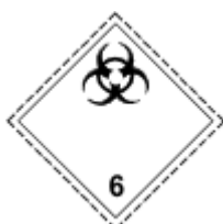
Obr. 1.10 Infekčné látky

Infekčné látky pôsobiace na ľudí a zvieratá, nešpecifikovaný klinický lekársky a triedený lekársky odpad a biologická látka kategórie B