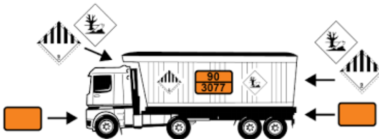
Obr.1.16 Príklad označenia vozidla prevážajúceho nebezpečnú látku, konkrétne s identifikačným číslom 3077

Zdroj: [2] MÁLEK, Zdeněk a Miroslav TOMEK. Logistika přeprav nebezpečných věcí. Zlín: Univerzita Tomáše Bati, 2011. ISBN 978-80-7454-131-5.