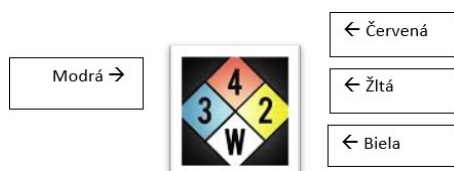
Obr.2.2 Diamant nebezpečnosti

Zdroj: [2] MÁLEK, Zdeněk a Miroslav TOMEK. Logistika přeprav nebezpečných věcí. Zlín: Univerzita Tomáše Bati, 2011. ISBN 978-80-7454-131-5.