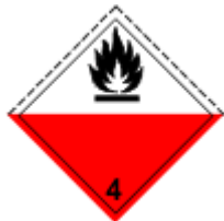
Obr. 1.5 Látky náchylné na samovoľné horenie

Uhlie, sadze, rybia múčka, fosfor biely a žltý, samozápalné alkyly a aryly kovov, vlákna a tkaniny impregnované olejom, celuloid - odpad a ďalšie