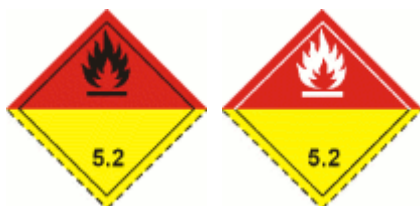
Obr. 1.8 Organické peroxidy

Organické peroxidy typu: A,B,C,D,E,F a G, kyselina peroxyoctová a ďalšie