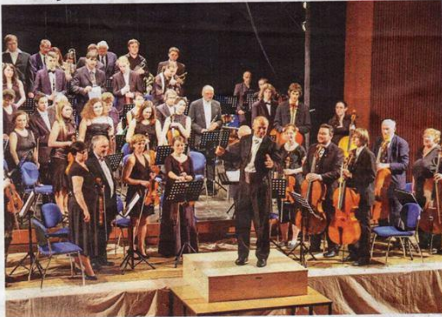
Podkrkonošský symfonický orchestr letos vystoupil například na Dvořákově festivalu v Lomnici.

Parta nadšenců rozdává lidem obří porce kvalitní hudby. Bez nároku na honorář.