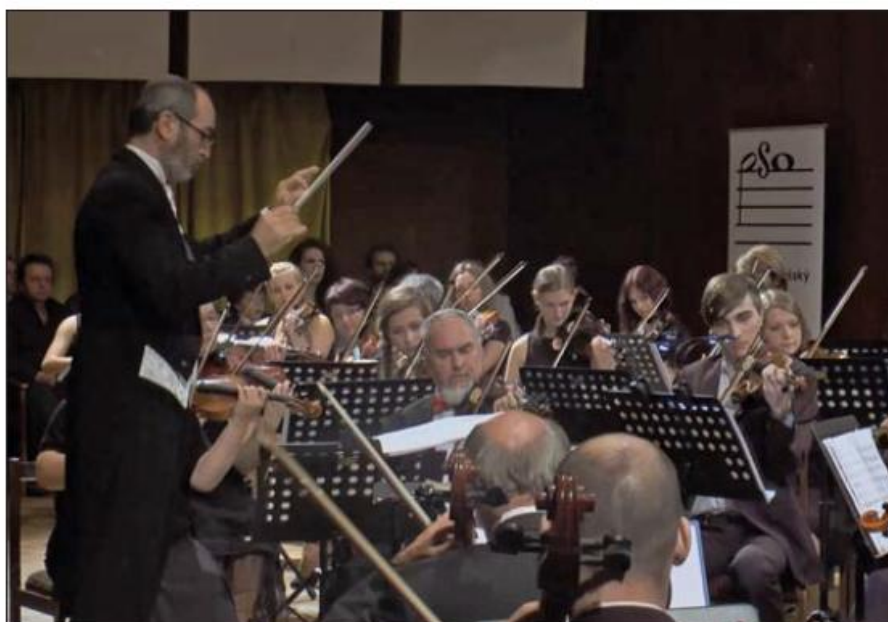
V rámci koncertu k výročí republiky provedl Podkrkonošský symfonický orchestr Dvořákovu Novosvětskou. Dirigoval Graziano Sanvito.

Příloha č. 5 - Semilské noviny roč. 2014/11 – Dvořákova Novosvětská zazní v Podkrkonoší