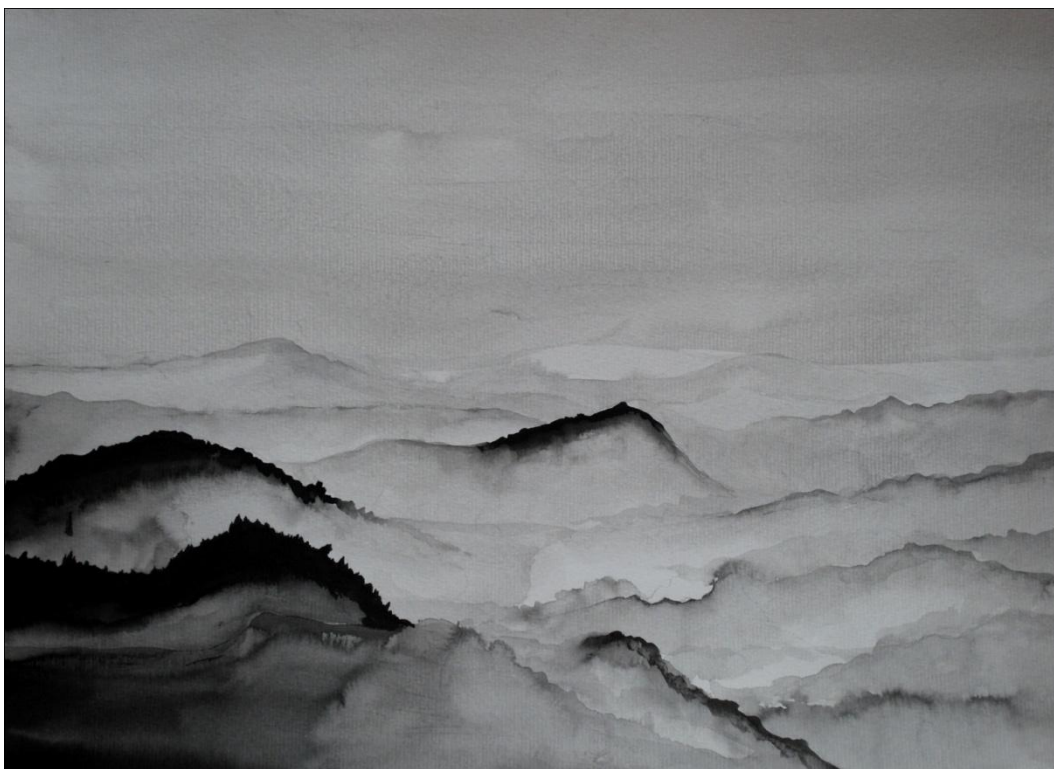
[16] Malá Skála v mlze , 2012, kresba tuší, papír, 42 x 29,7 cm