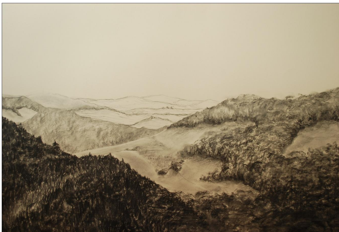
[10] Malá Skála , 2013, kresba uhlím, papír, 100 x 70 cm

Tato kresba je snad nejvzrušivější z celého cyklu. Ani tady ovšem nemůžu říci, že by mě výjev nějakým způsobem nenechal medítovat. Z levého dolního rohu vystupuje zalesněná hora, která v dolní části navazuje na kopec na pravé straně. Lesy tu mění svůj charakter - z jehličnatých se stávají listnaté, a také je patrné mírné řidnutí. Jak kopec klesá, objevují se na něm pole, která pokračují až do údolí. Na pozadí se objevují daleké hory, které jsem tentokrát nekreslila způsobem vzdušné perspektivy, ale jemnou lineární kresbou. Toto ztenčení do subtilní linky, myslím, funguje pro divákovy oko podobným způsobem jako vzdušná perspektiva, ale u tohoto konkrétního případu mi vyhovovalo více. Měla jsem potřebu dostatečně zvýraznit strukturu a výškové rozdíly krajiny, proto jsem horizont umístila poměrně vysoko.