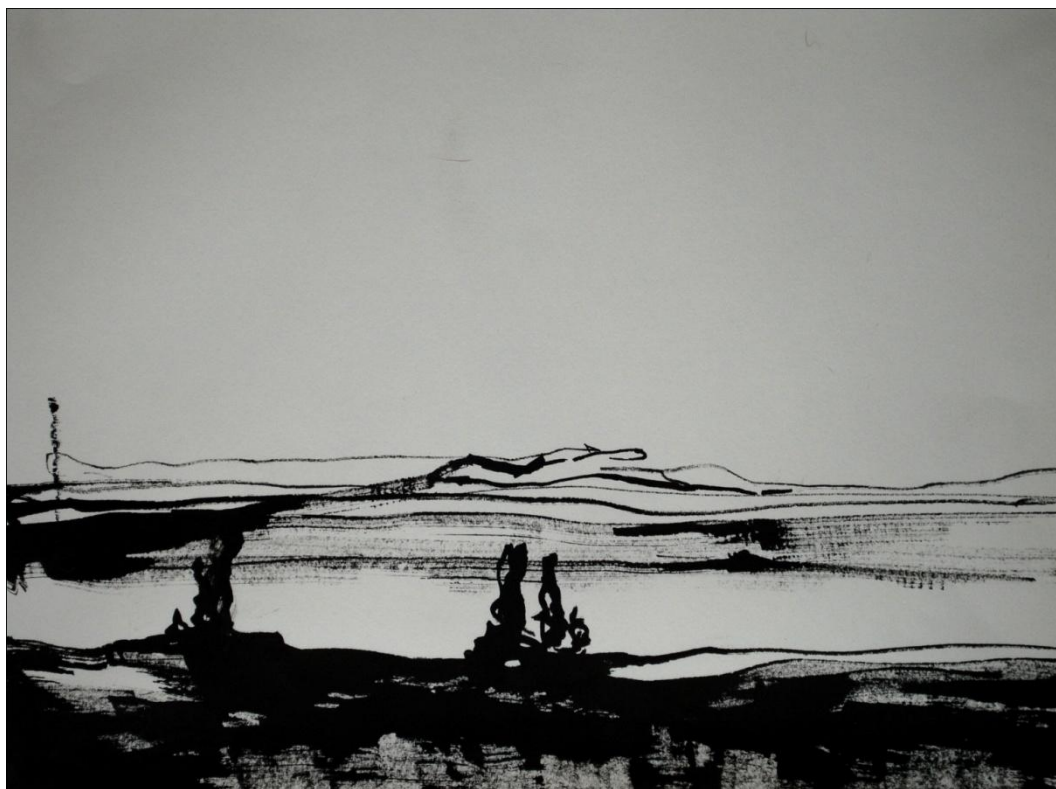
[17] Krajina II. , 2013, kresba tuší, papír, 29,7 x 21 cm