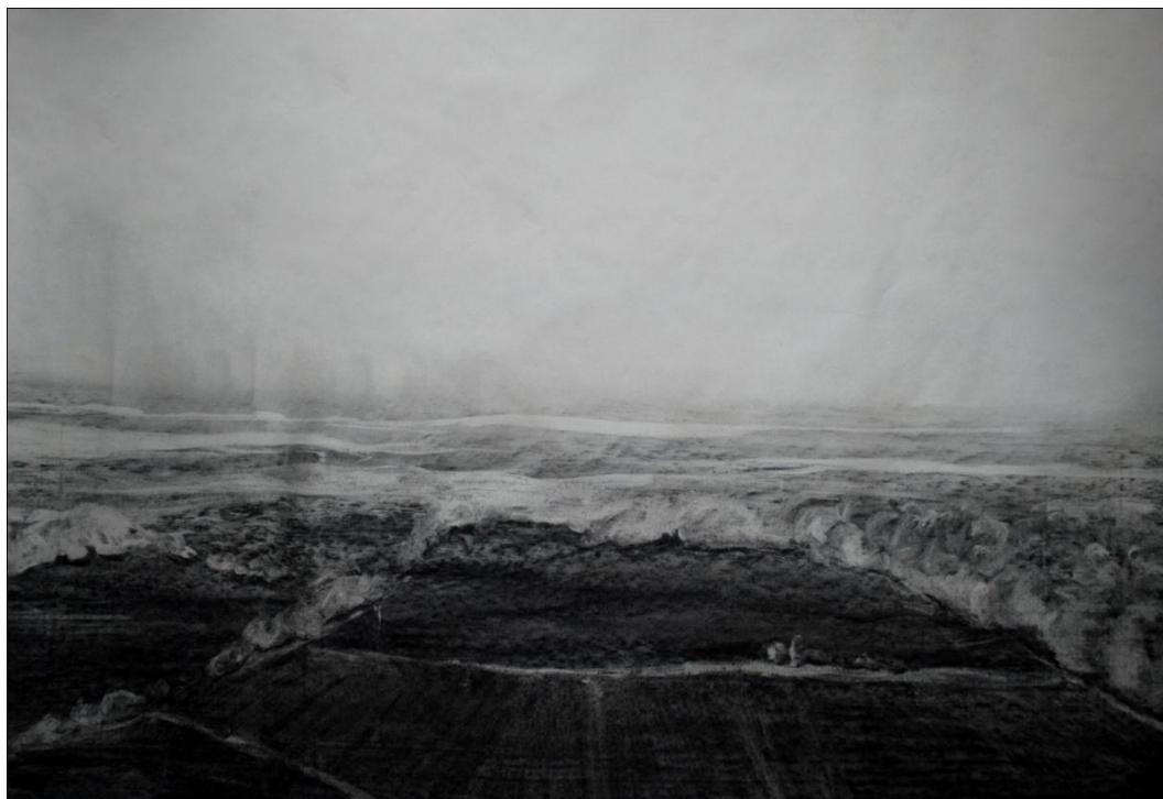
[13] Pod Kuňkou , 2013, kresba uhlím, balicí papír, 100 x 70 cm