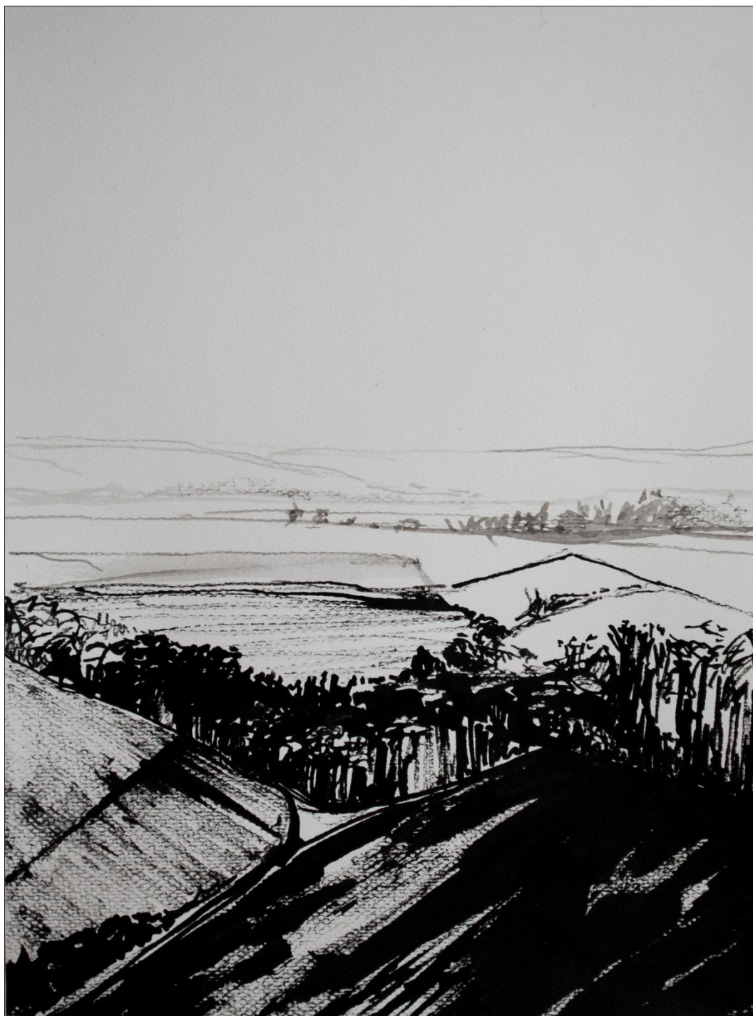
[20] Krajina V. , 2013, kresba tuši, papír, 21 x 29,7 cm