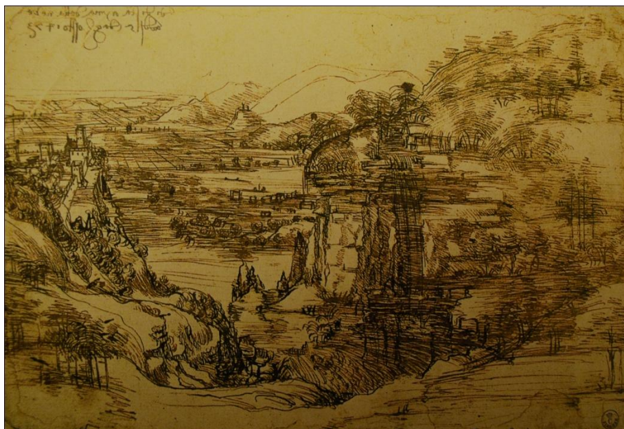
[2] Leonardo da Vinci, Pohled na údolí řeky Arno , kresba tuší, 1473

„Prvními umělci, kteří zobrazili samostatnou krajinu bez figurálního motivu, byli zřejmě Leonardo da Vinci (1452 – 1519) [2] a Albrecht Dürer (1471 – 1528) ve svých akvarelech. Za prvního skutečného krajináře bývá považován Joachim Patinir (1480 – 1584), ale ani jeho krajiny se ještě neobešly bez figurální stafáže. Velký zájem o krajinu mají také holandské malíři 16. století. A můžeme je považovat za průkopníky krajinomalby.“ 8