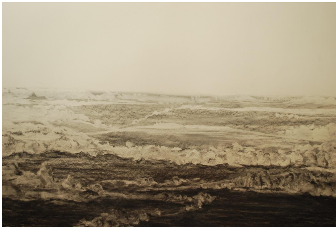
[8] Žleby , 2013, kresba uhlem, papír, 100 x 70 cm

Zde jsem použila pouze techniku vybírání pokreslené plochy plastickou gumou. Tímto způsobem se dá dosáhnout jasného pronikavého světla, které se v krajině vyskytuje hlavně za letních dnů. Řídila jsem se zde také pravidlem „co je vpředu, to je větší, co je vzadu, to je menší“, proto je stromoví v předním lánu mnohem mohutnější, než v zadním. Krajina ubíhá do ztracena jako na předešlém díle Pod Kunětickou horou. Kraj je rovinatý a nevyvolává tak žádné drama. Jen přední lesy vzbuzují mírné chvění, jakoby se pohybovaly ve větru. Výjev se ale směrem do dále uklidňuje.