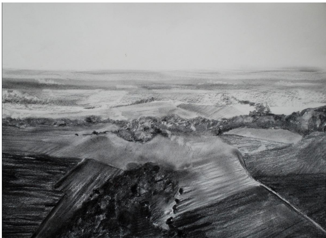
[14] Krajina , 2012, kresba uhlím, papír, 42 x 29,7 cm