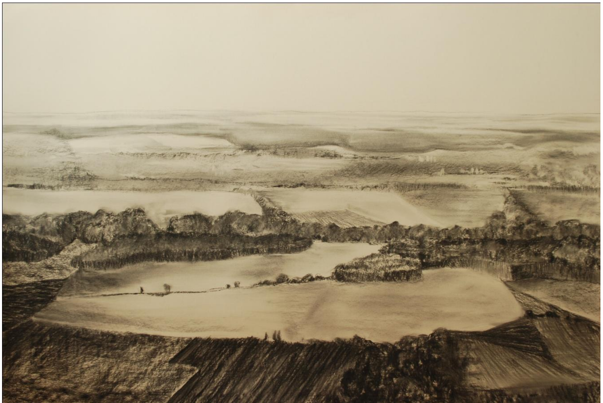
[7] Pod Kunětickou horou , 2013, kresba uhlím, papír, 100 x 70 cm

Tato kresba obsahuje pouze dva až tři plány. V prvním se nachází pole a lesy, které jsou tmavší, než plány ostatní. Hrubost zjemňuje světlá plocha, zhruba uprostřed, kterou narušuje mírně diagonální cesta a tři stromy vpředu. V zadních plánech už se spíše ocitáme na jemných pláních mizících do ztracena. Střídají se zde tmavé a světlé plochy polí a zarostlé polní cesty, které je oddělují. Progumováním jsem zvýraznila světla i hloubku kresby.