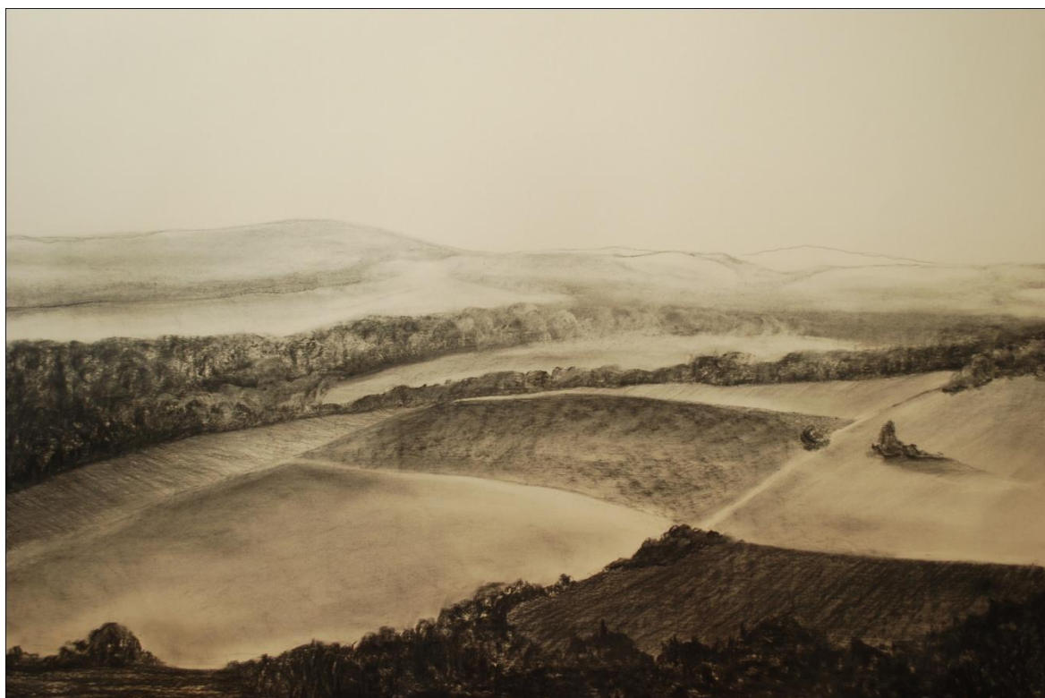
[11] Dlouhá Třebová , 2013, kresba uhlím, papír, 100 x 70 cm

V tomto kraji jde především o prázdnotu a rozlohu polí, které narušuje jen úzký pruh porostu. Je to líný letní den, kdy usazení ve stínu stromu u polní cesty sledujeme v příjemném bezčasí se táhnoucí plány polí, nízkých kopců a malinkatého městečka, které zcela splývá s přírodní masou. Pruh porostu se vyskytuje úplně vpředu a tvoří i rozhraní mezi předním a zadním plánem. Na něm se už objevují mírné kopce Orlických hor.