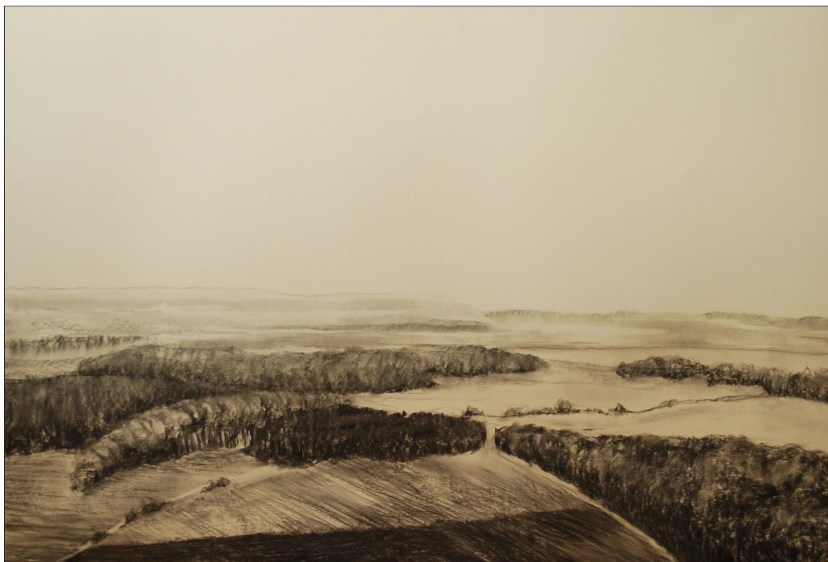
[9] Kunětice , 2013, kresba uhlím, papír, 100 x 70 cm

Na této kresbě jsem využila nižšího horizontu. Výška nebe se mi zdála být důležitější, než rozsáhlá pole v prvním plánu. Z pravého dolního rohu vybíhá masa lesů, která je přerušena průsmykem mezi stromy. Následně však linie stromoví opět tvoří neprůniknutelný prales. Skrz kraj vede diagonálně polní cesta místy obrostlá keří. Výjev opět mizí do ztracena. Na této kresbě ovšem můžeme zpozorovat už i mírné zvedání scenérie.