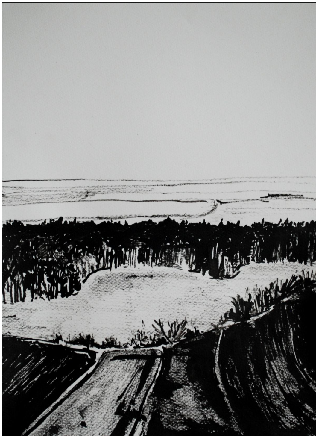
[19] Krajina IV. , 2013, kresba tuší, papír, 21 x 29,7 cm