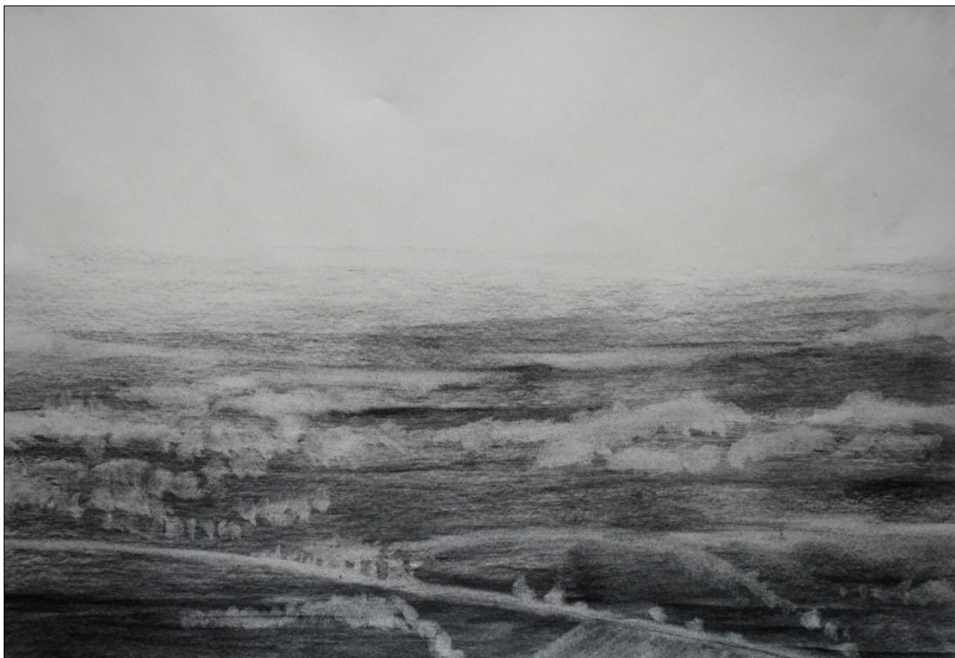
[15] Ze Svatého Kopečku , 2012, kresba uhlem, papír, 42 x 29,7 cm