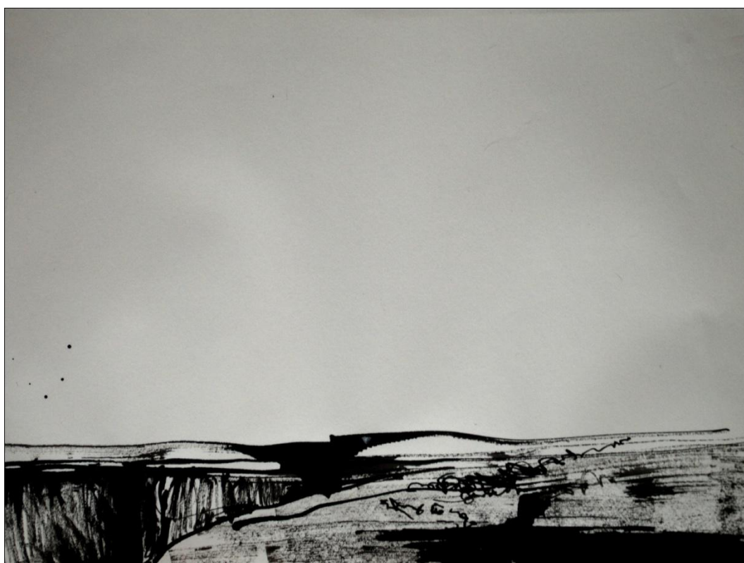
[18] Krajina III. , 2013, kresba tuší, papír, 29,7 x 21 cm