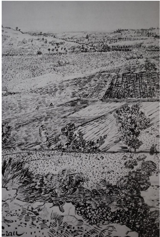
[5] Vincent van Gogh, Krajina , kresba rákosovým perem a černou křídou, detail, 1888, 490 x 610 cm