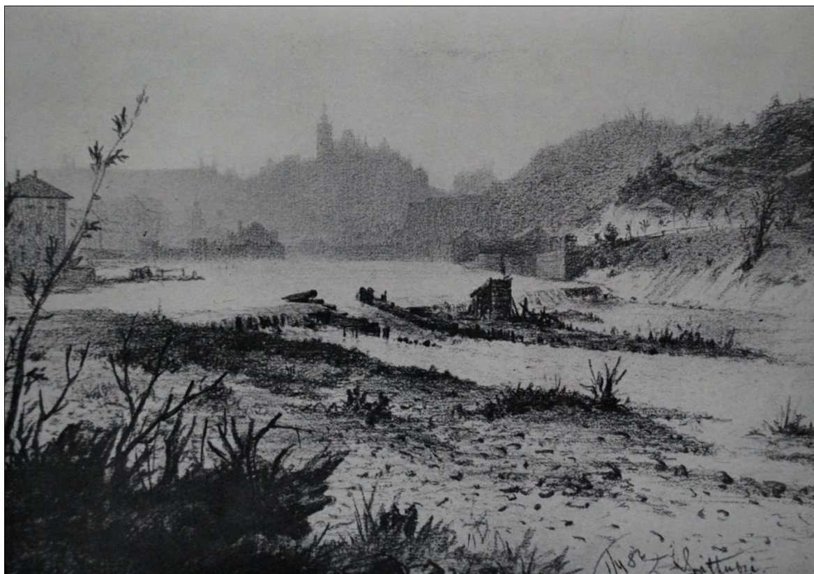
[4] Antonín Chittussi, Pohled se Štvanice k Hradčanům , kresba tužkou, 22 x 16 cm