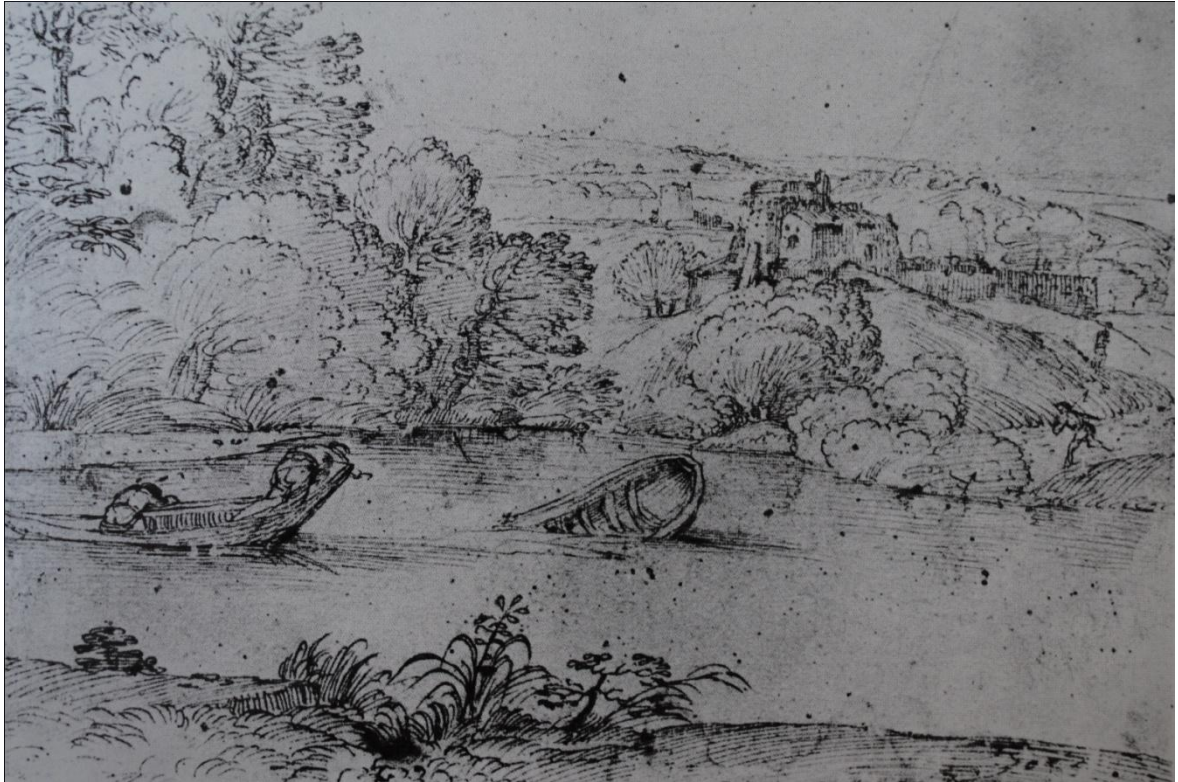
[3] Annibale Carracci, Krajina s řekou a dvěma čluny , kresba perem a hnědým inkoustem, 199 x 300 cm