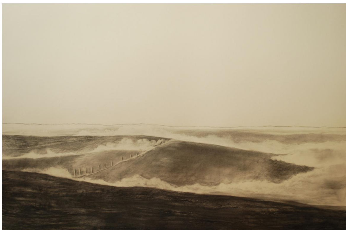
[12] Seč , 2013, kresba uhlem, papír, 100 x 70 cm

Tato krajina je snad moje nejoblíbenější. Kresba má jakýsi melancholický podtón. Stromy připomínají ranní mlhu, skrz kterou proniká slunce, líně se povaluje na kopcích a následně mizí do ztracena. Za horizontem prvního plánu se vzápětí zvedá další kopec, který přetíná plaňkový plot, snad tvořící zábranu pasoucímu se dobytku. Za tímto vrškem tušíme zadní plán, který je jen naznačen slabou linkou.