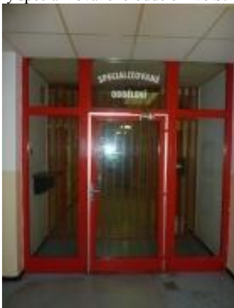
Obrázek č. 3 – prostory specializovaného oddělení ve Stráži pod Ralskem