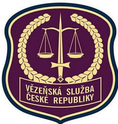
Obrázek 1: znak VSČR