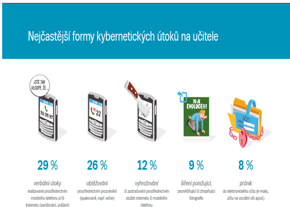
Obrázek č. 1: Nejčastější formy kybernetických útoků na učitele

„Oběťmi kybernetického útoku se stalo 21,73 % českých učitelů (6,19 % v posledních 12 měsících a 14,68 % dříve než v posledních 12 měsících. Mezi nejčastější formy incidentů patřily verbální útoky realizované prostřednictvím mobilního telefonu či internetu a obtěžování prostřednictvím prozvánění. Výzkum zachytil také vyhrožování učiteli či jeho zastrašování, případně šíření ponižující či zesměšňující fotografie.“ uvedl vedoucí výzkumného týmu Kamil Kopecký. (E-bezpečí, 2018, [online])