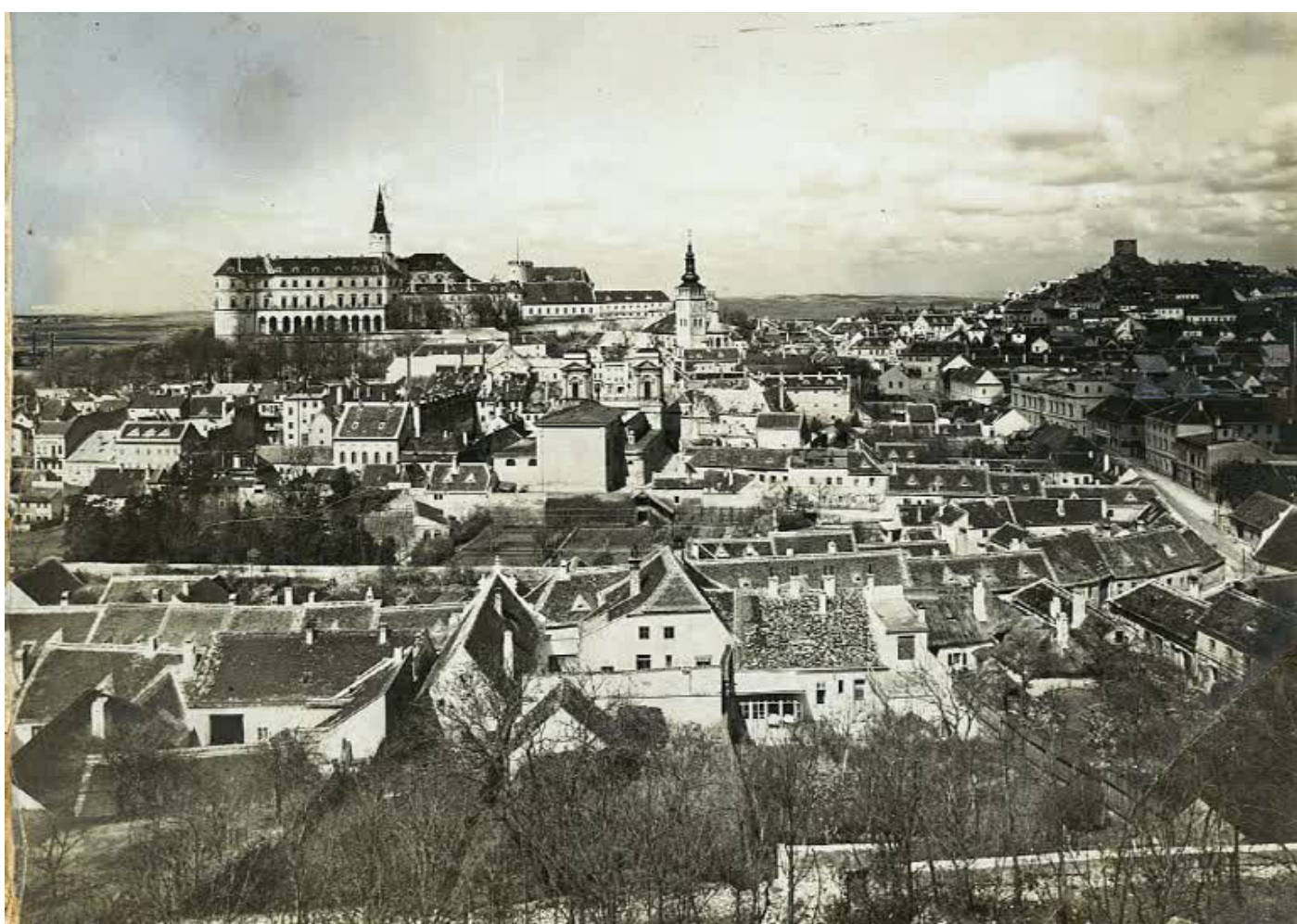
Historický atlas měst České republiky, sv. 25. Mikulov