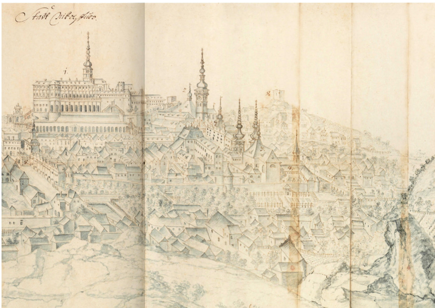
Historický atlas měst České republiky, sv. 25. Mikulov