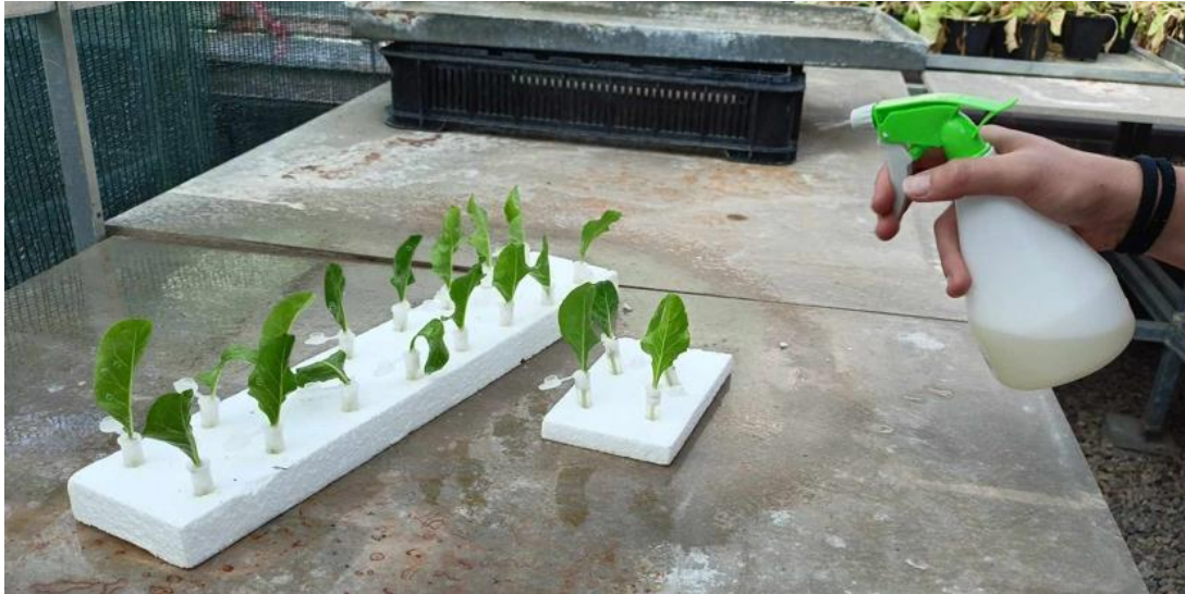
Obrázek 4 Aplikace přípravku postřikovačem

Po aplikaci přípravků byly listy se mšicemi na polystyrenových deskách umístěny po 20 kusech v jednom boxu na dobu 24 hodin do místnosti, ve které byl nastavený světelný režim na střídání dne a noci v poměru 14 hodin světla a 10 hodin tmy, s teplotou 26 °C za světla a 22 °C za tmy při vlhkosti 60 % ± 7 %.