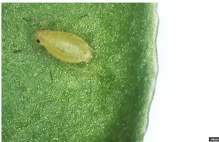
Obrázek 2 Myzus persicae nanesená na list

Mšice broskvoňové ( Myzus persicae ) byly získány z Výzkumného ústavu rostlinné výroby, následně byly chovány na mladých rostlinách řepy v přenosných nylonových síťových boxech o rozměrech 90x60x60 cm.