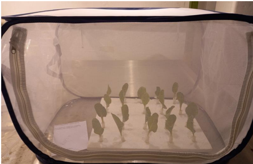
Obrázek 5 Umístění v boxu po aplikaci postřiku

Po aplikaci přípravků byly listy se mšicemi na polystyrenových deskách umístěny po 20 kusech v jednom boxu na dobu 24 hodin do místnosti, ve které byl nastavený světelný režim na střídání dne a noci v poměru 14 hodin světla a 10 hodin tmy, s teplotou 26 °C za světla a 22 °C za tmy při vlhkosti 60 % ± 7 %.