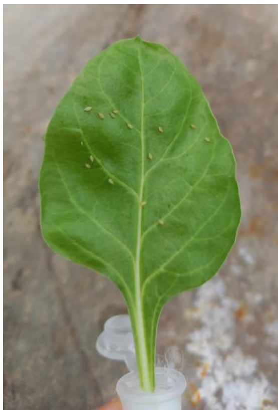
Obrázek 3 Mšice po nanesení na mladý list krmné řepy

Mšice z chovných boxů byly na vybrané listy nanášeny jednotlivě pomocí malého štětce namočeného ve vodě. V rámci pokusu bylo nanášeno 15 mšic o velikosti 2 až 3 mm na svrchní stranu jednoho listu.