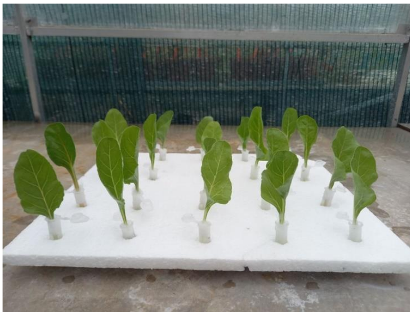
Obrázek 1 Mladé listy řepy umístěné na polystyrenové desce

Pro potřeby pokusu byly využívány listy z rostlin řepy obecné krmné ( Beta vulgaris var. rapacea ), které byly vysety v termínech 22. 2. 2023 a 22. 3. 2023. Rostliny byly uchovávány ve skleníku s teplotou 20 °C s přirozeným světelným režimem, kde byly denně zalévány. Z rostliny byly následně využívány mladé listy o velikosti přibližně 14 cm 2 , které se po nanesení mšic a vybraných přípravků vzájemně nedotýkaly a byly natočeny jedním směrem.