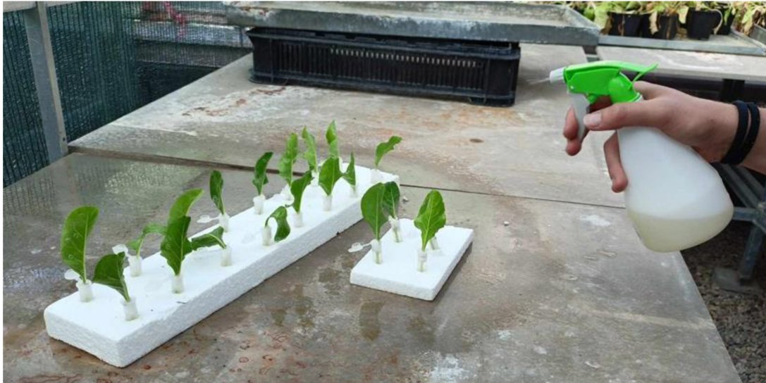
Obrázek 4 Aplikace přípravku postřikovačem

Po aplikaci přípravků byly listy se mšicemi na polystyrenových deskách umístěny po 20 kusech v jednom boxu na dobu 24 hodin do místnosti, ve které byl nastavený světelný režim na střídání dne a noci v poměru 14 hodin světla a 10 hodin tmy, s teplotou 26 °C za světla a 22 °C za tmy při vlhkosti 60 % ± 7 %.