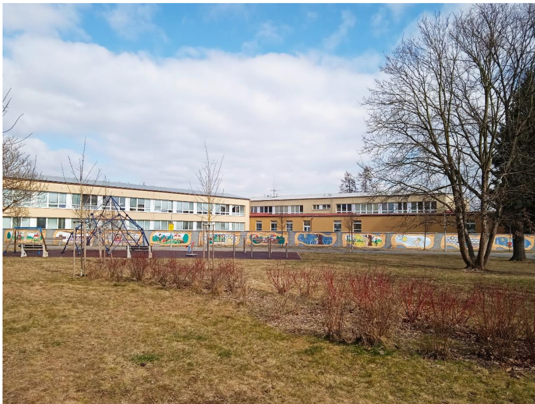
Příloha 12 – Základní škola v Chropyni na ulici J. Fučíka