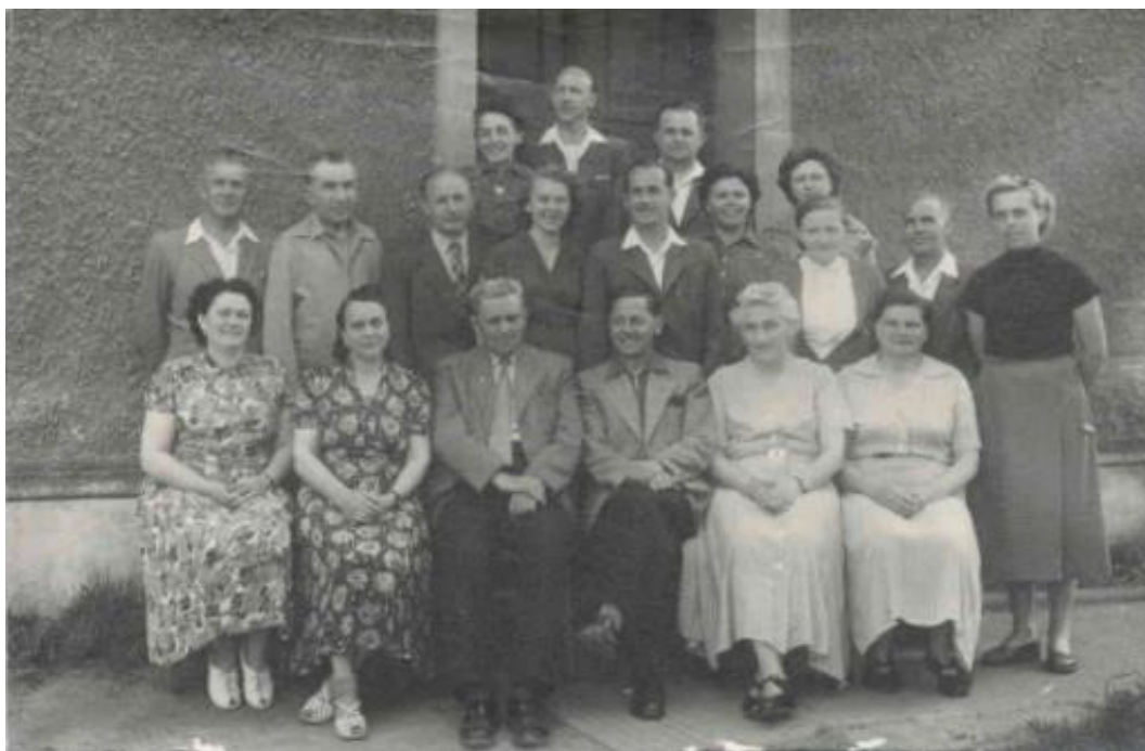
Příloha 20 – Pedagogický sbor ve školním roce 1958/1959