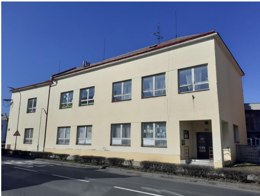
Příloha 8 – Stará škola