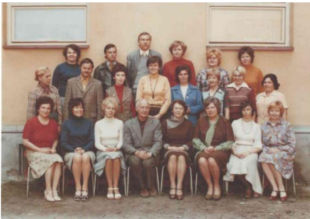
Příloha 30 – Pedagogický sbor ve školním roce 1981/1982