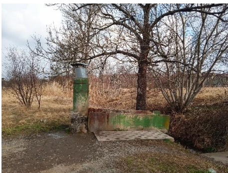
Zámek Chropyně, nám. Svobody 30, Chropyně