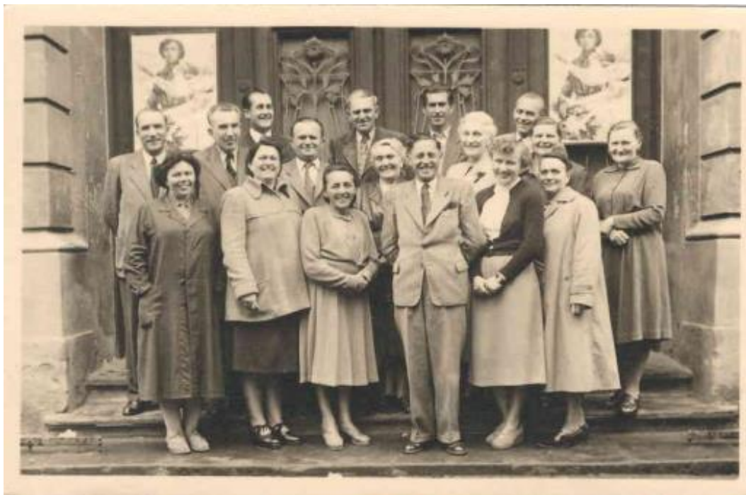
Příloha 18 – Pedagogický sbor ve školním roce 1956/1957