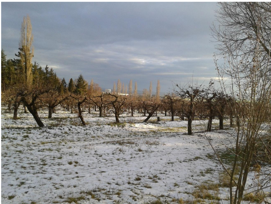
Ovocný sad na západní straně Ústředního hřbitova v Brně