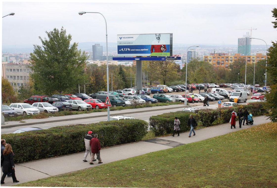
Parkoviště na severní straně Ústředního hřbitova v Brně