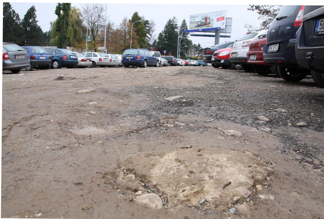
Povrch parkoviště na severní straně Ústředního hřbitova v Brně