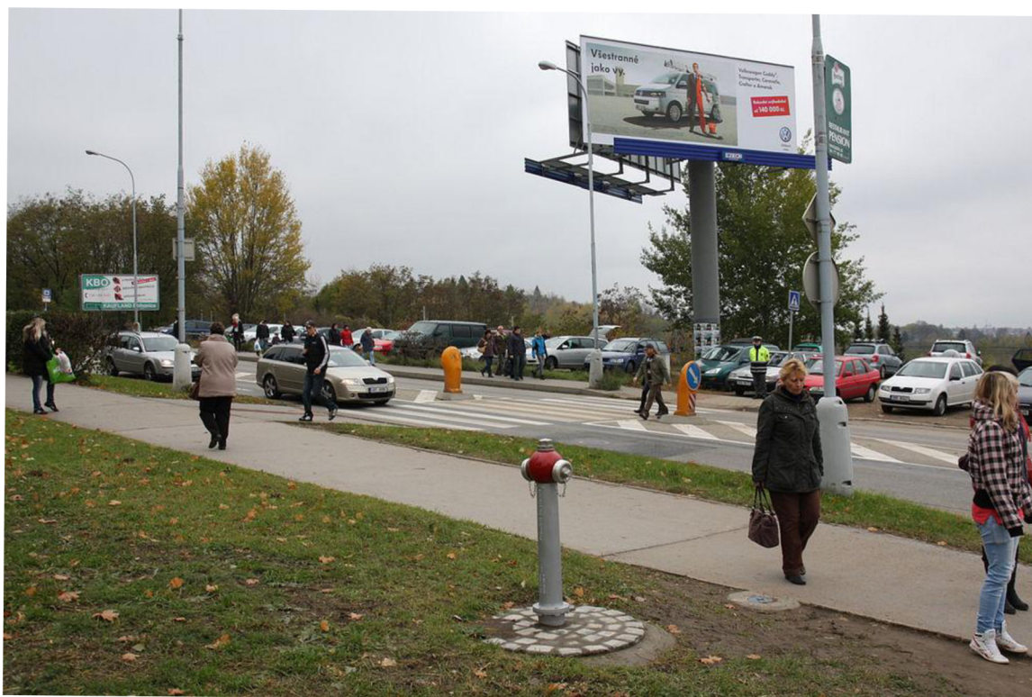
Přechod pro chodce na severní straně Ústředního hřbitova v Brně