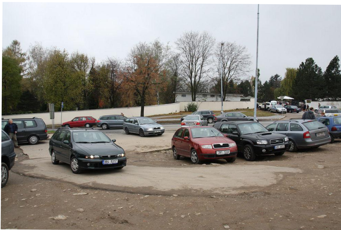
Vjezd a výjezd na parkoviště Ústředního hřbitova v Brně