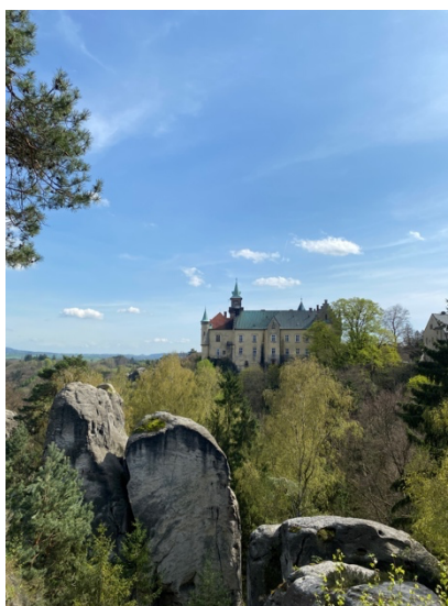
Obrázek 3 Mariánská vyhlídka s výhledem na Zámek Hrubá Skála (2024)