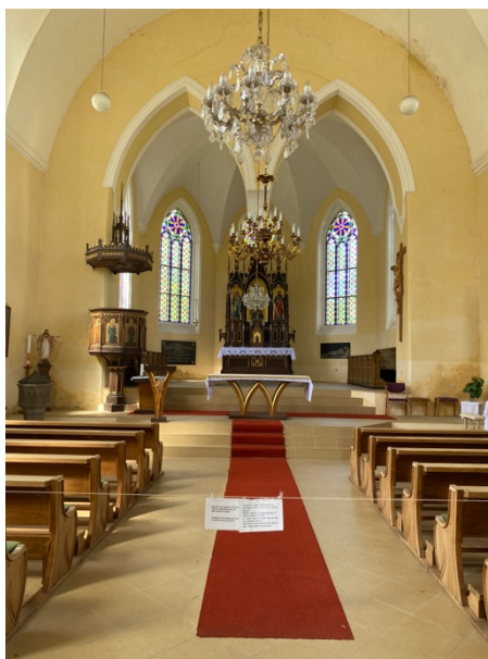
Obrázek 6 Kostel sv. Josefa (2024)