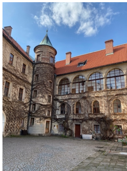
Obrázek 1 Nádvoří Zámku Hrubá Skála (2024)