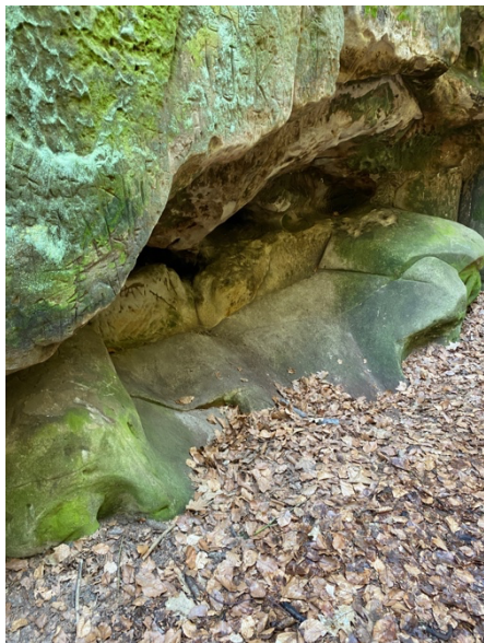
Obrázek 5 Adamovo lože (2024)