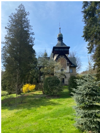
Obrázek 2 Řezníčkova vila v obci Hrubá Skála (2024)