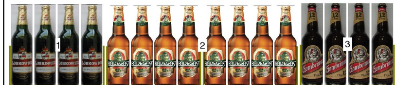
po 5: police výška 0,12m hloubka 0,81m