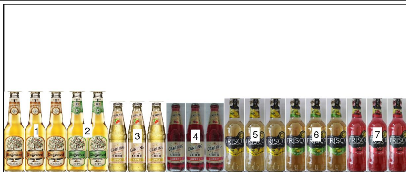
po 1: police výška 1,68m hloubka 0,67m