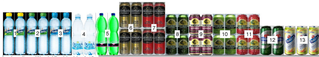
po 3: police výška 0,37m hloubka 0,45m