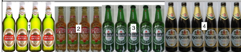
po 2: police výška 1,32m hloubka 0,67m