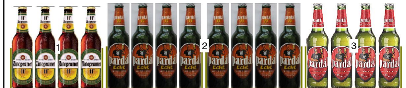
po 5: police výška 0,12m hloubka 0,81m