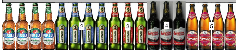
po 4: police výška 0,60m hloubka 0,67m