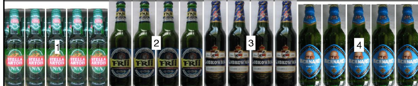
po 3: police výška 0,96m hloubka 0,67m