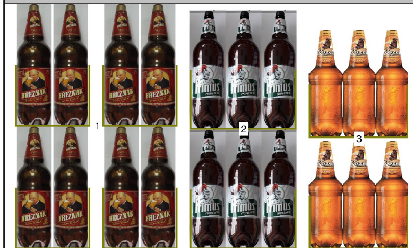
po 2: police výška 0,12m hloubka 0,81m