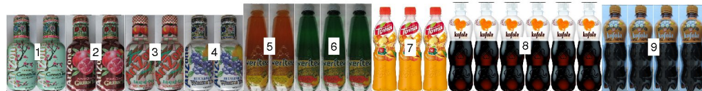
po 2: police výška 0,73m hloubka 0,45m