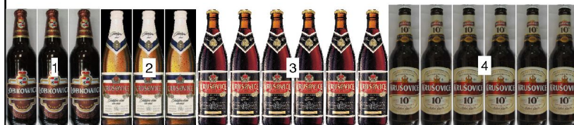
po 4: police výška 0,54m hloubka 0,67m