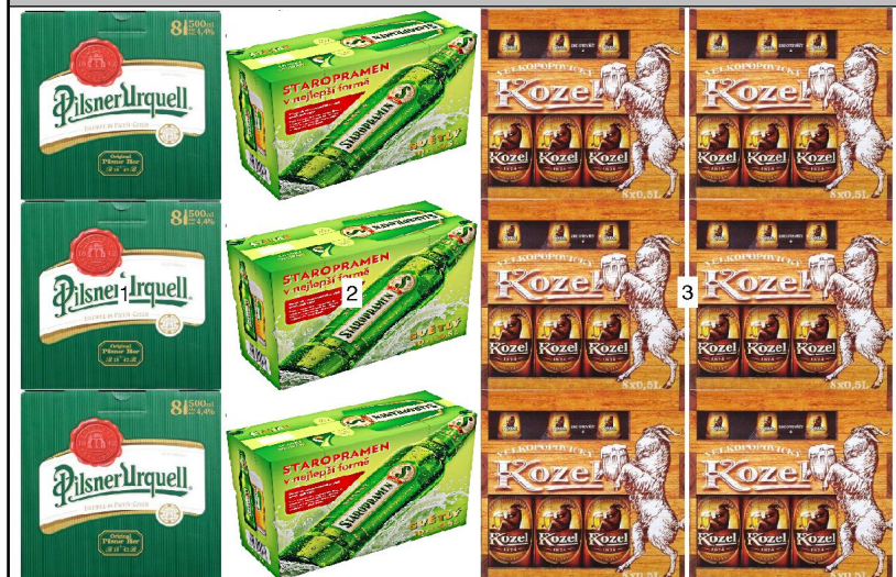
po 4: police výška 0,12m hloubka 0,81m