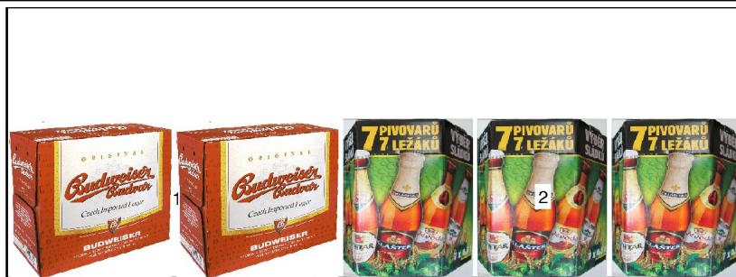
po 1: police výška 1,74m hloubka 0,67m