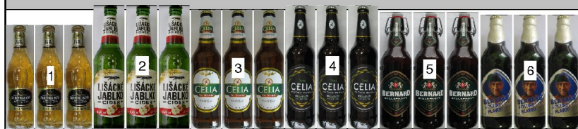
po 2: police výška 1,32m hloubka 0,67m