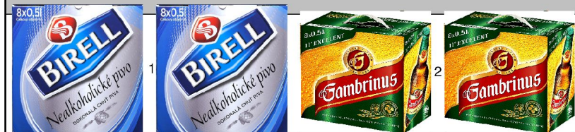
po 2: police výška 1,38m hloubka 0,67m