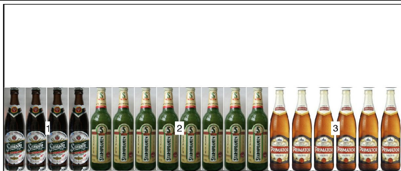
po 1: police výška 1,68m hloubka 0,67m