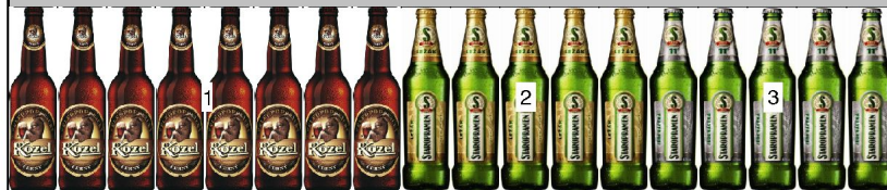
po 3: police výška 0,96m hloubka 0,67m