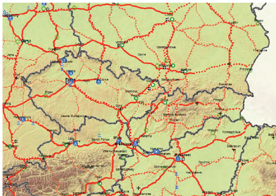
Obr. 3.2: Sieť TEN-T pre cestnú dopravu [2]

Transeurópska dopravná sieť má za úlohu vytvoriť infraštruktúru pre správne fungovanie trhu z hľadiska konkurencieschopnosti Európskej únie. Podporuje právo občana EÚ na voľný pohyb v rámci území členských štátov a snaží sa zabezpečiť hospodársku, sociálnu a územnú súdržnosť. Stavba I/43 Troubsko/D1 Bořitov má byť súčasťou Baltsko-jadránskeho koridoru (viď. úsek Katovice- Ostrava- Brno- Viedeň). [2]