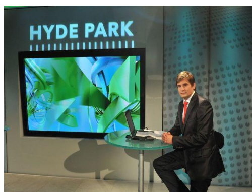
Obrázek 8: Studio Hyde Parku

Interaktivita představuje nový trend ve vysílání televize, který vzniká reflexí druhé komunikační strany. Přímo do živého vysílání vstupují lidé, kteří reagují, komentují a vyjadřují souhlas či nesouhlas s nějakým názorem. Jedná se například o zapojení telefonních vstupů od diváků neboli recipientů, kteří vysílání vytvářejí spolu