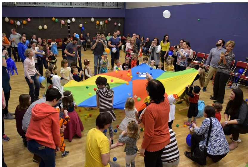
Karneval Ratoleš - autor: Jana Matušková