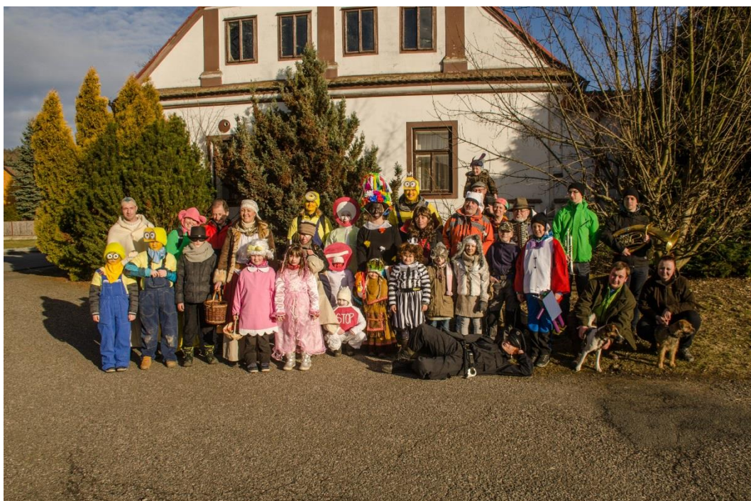
Masopust v Křivcích – autor Simona Gavláková