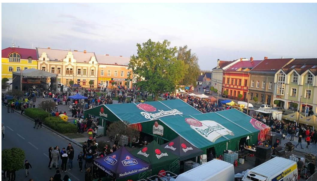
Pálení čarodějnic – autor Libor Koldinský