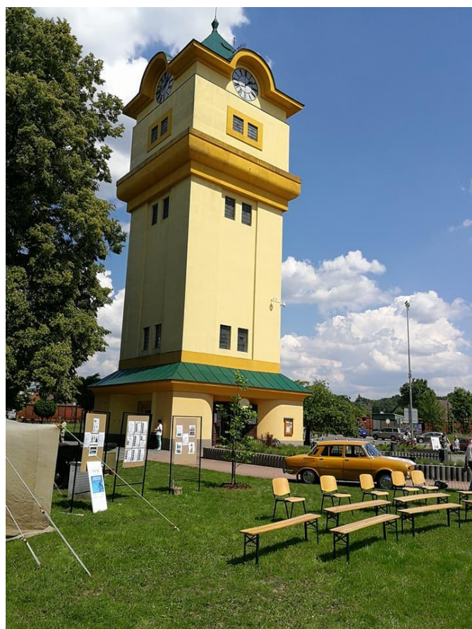
Vodárenská věž - autor: Libor Koldinský