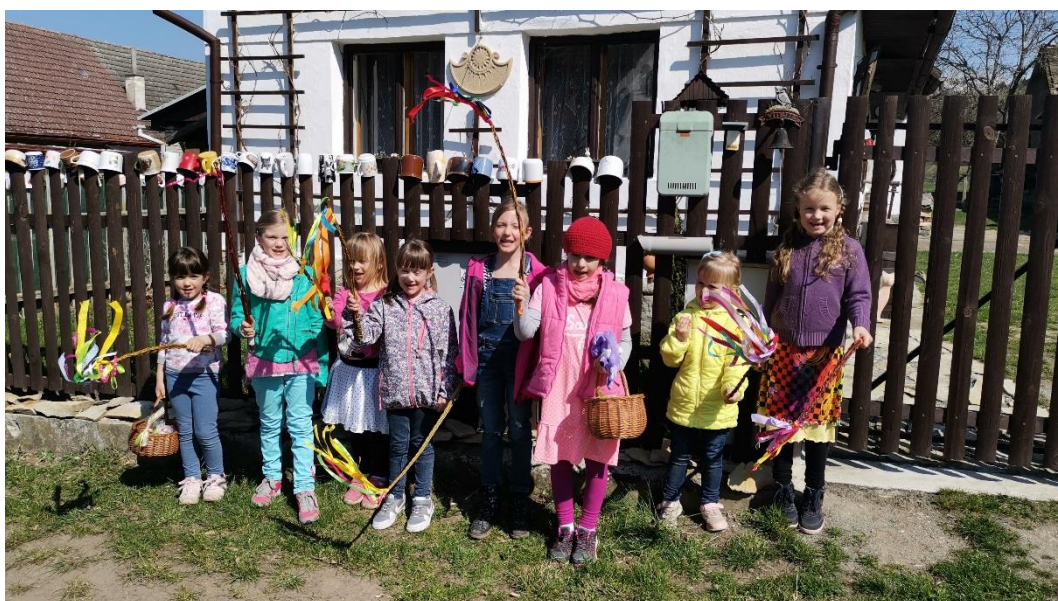
Holčičí koleda v Křivicích – autor: Simona Gavláková