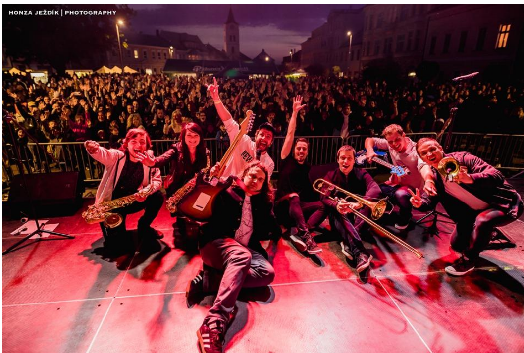
Band-a-SKA - autor: Honza Ježdík