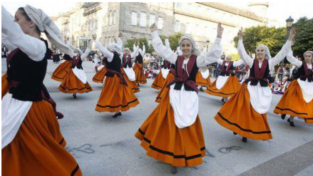
Obrázek 5 La Muiñeira