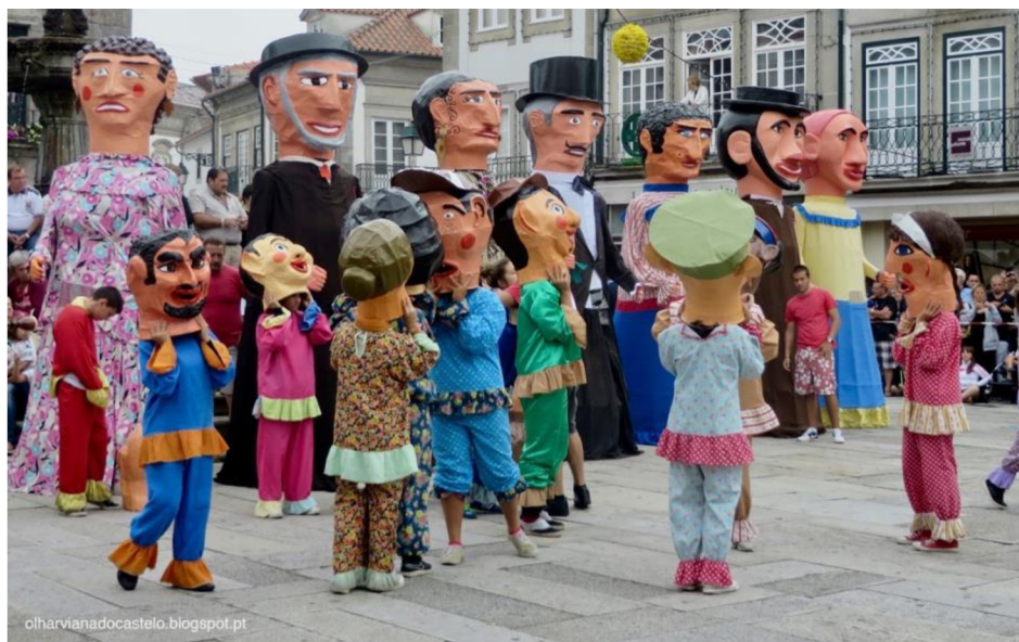
Obrázek 6 „Gigantones" a „Cabeçudos" na festivalu ve Viana do Castelo