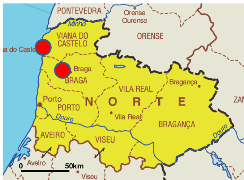
Obrázek 4 Území severního Portugalska s označenými místy výzkumu

Výzkum probíhal především ve městech Braga a Viana do Castelo. Obě města představují historicky významnou oblast, kde se Galicijci nacházeli a do dnes nacházejí. Právě Braga byla v historii hlavním městem tehdejšího Galicijského království a je zde k vidění dlouhá katolická tradice, o které svědčí i zdejší nejstarší portugalská diecéze. V Braze se také nachází univerzita, jejíž součástí je i „O Centro de Estudos Galegos“, neboli centrum galicijských studií, které zajišťuje výuku galicijské literatury a kultury v různých stupních. Zároveň se podílí na organizaci mnoha aktivit na podporu spolupráce mezi Galicií a severním Portugalskem.