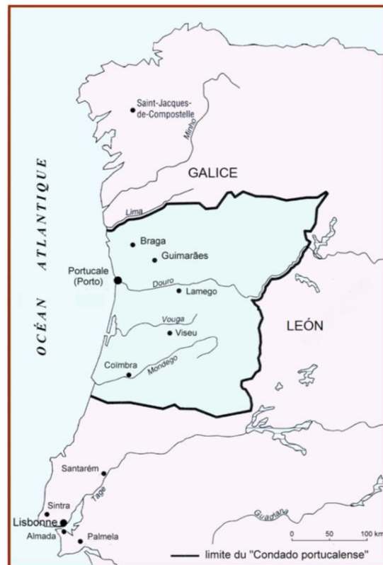
Obrázek 1 Condado Portucalense