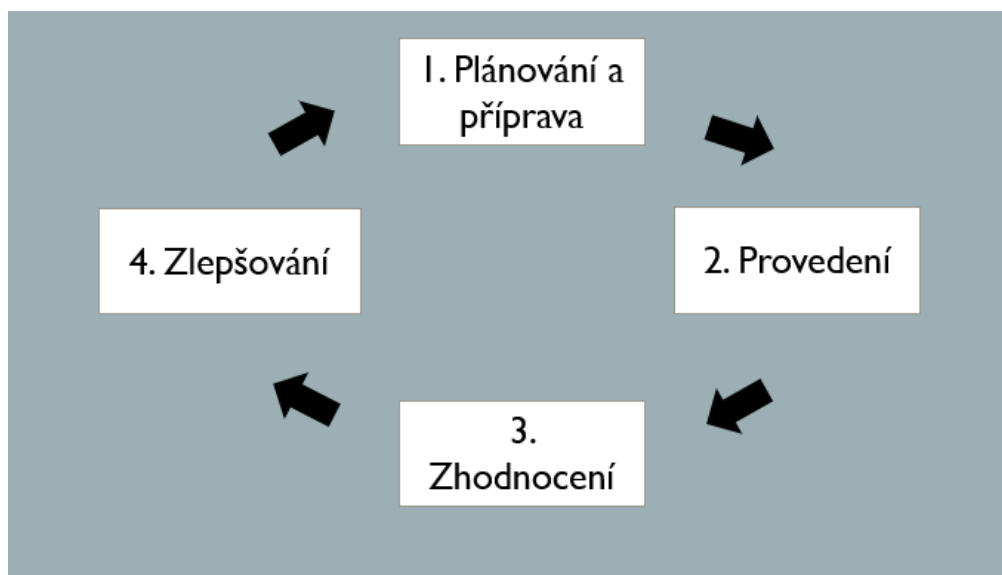
Obrázek 3: Cyklus a jednotlivé fáze implementace CSR v podniku