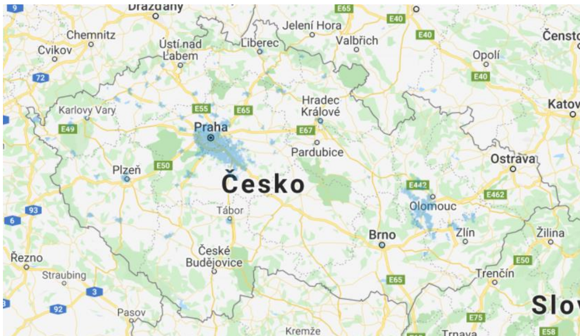
Obrázek 3: Mapa pokrytí 5G společností O2 (O2, 2021)

Na obrázku č. 3 můžeme vidět pokrytí území České republiky mobilním internetem 5G od společnosti O2. Stejně jako na obrázku č. 2, mezi hlavní oblasti širokoplošného pokrytí, kde se lze na 5G síti připojit, jsou velká města. Dále se společnost soustředila i na hranici mezi Prahou a Středočeským krajem, kde lze spatřit také plošné pokrytí a území kolem města Olomouc. Jiné části České republiky jsou ale úplně bez pokrytí.