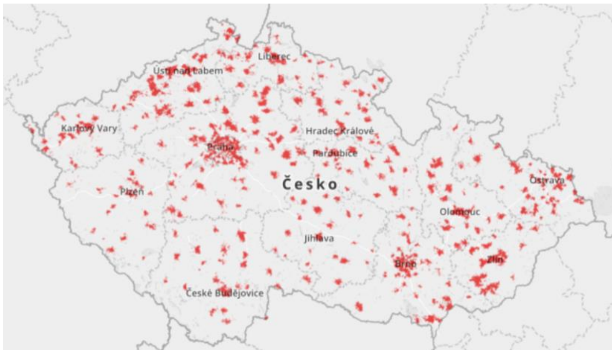
Obrázek 4: Mapa pokrytí 5G společností Vodafone (Vodafone, 2021)

republiky, a to i přes to, že síť staví sama. Vodafone Czech Republic a.s. je již ve fázi, kdy pokrývá i menší města. Během března 2022 například Jistebnici, která má cirká 2 000 obyvatel, v okrese Tábor.