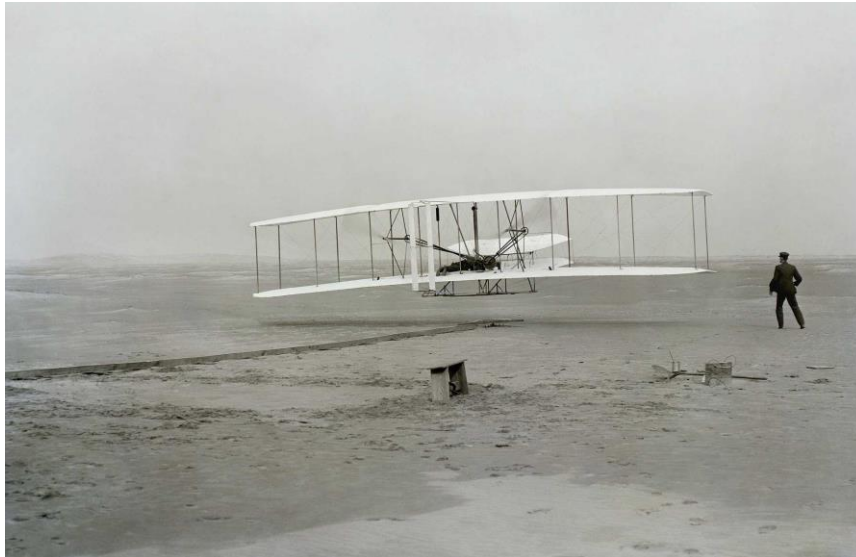
Obrázek 1: Letoun bratří Wrightů - Flyer I [19][19]

Historii letectví neseme v sobě jako fascinující příběh pokroku a odvahy, zvláště pro odborníky provozující leteckou zabezpečovací techniku. Počínaje prvním pilotovaným letem bratří Wrightů (obr. 1) v roce 1903 se letectví stalo klíčovým prvkem globalizace a moderního světa.