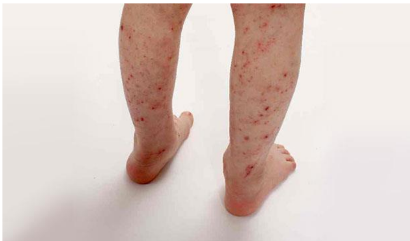
Obrázek č. 3 Atopický ekzém

Dalšími typy ekzému mohou být například kontaktní dermatitida, která reaguje na látky, které není schopno tělo přijmout. Další atopií je dyshidrotická dermatitida, kterou můžeme vidět na dlaních a nohách. Posledním typem je numulární dermatitida, která je velmi častá u mužů a projevuje se hlavně v zimě (heathline.com, 2018).