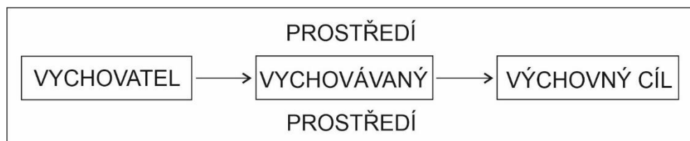
Schéma 1 Výchovní proces

Podle Krause (1999) lze proces výchovy znázornit následujícím schématem: