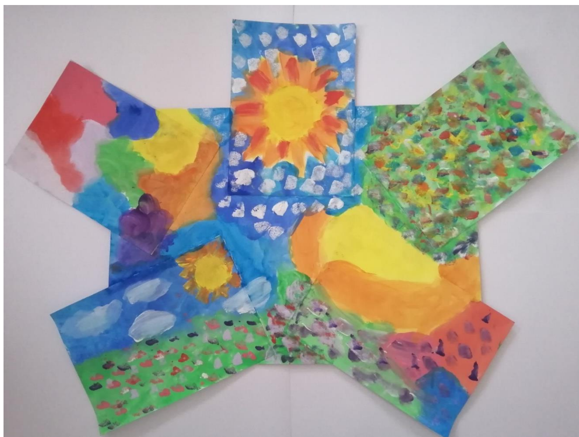
Obrázek č. 4: autoři: všichni