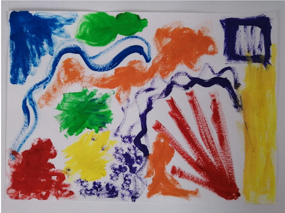
Obrázek č. 3: autoři: Tomáš a Martin