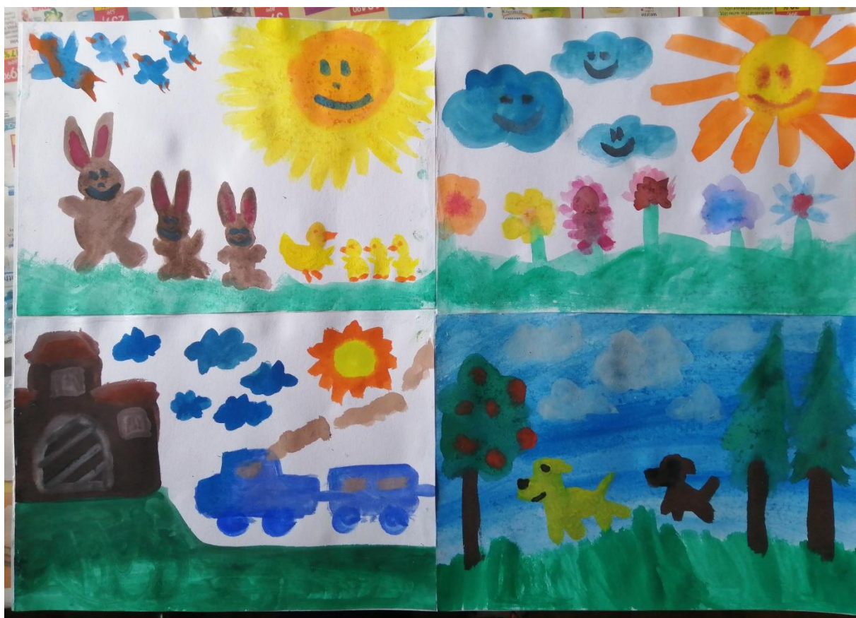
Obrázek č. 9: autoři: všichni