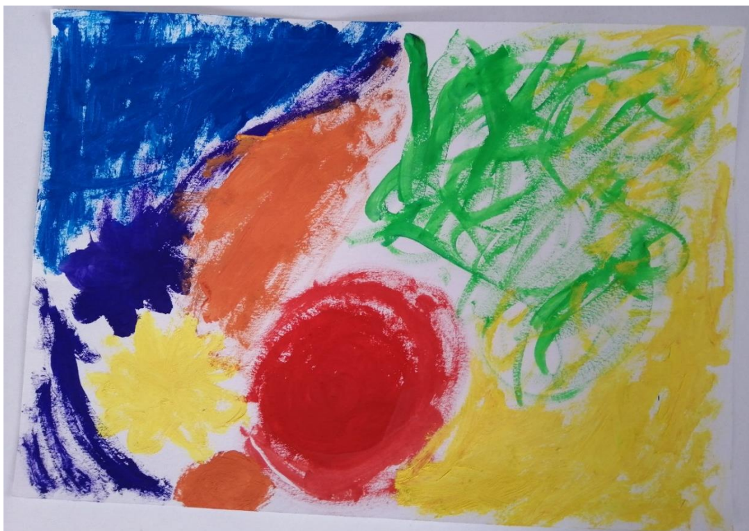
Obrázek č. 2: autoři: Kája a Eliška