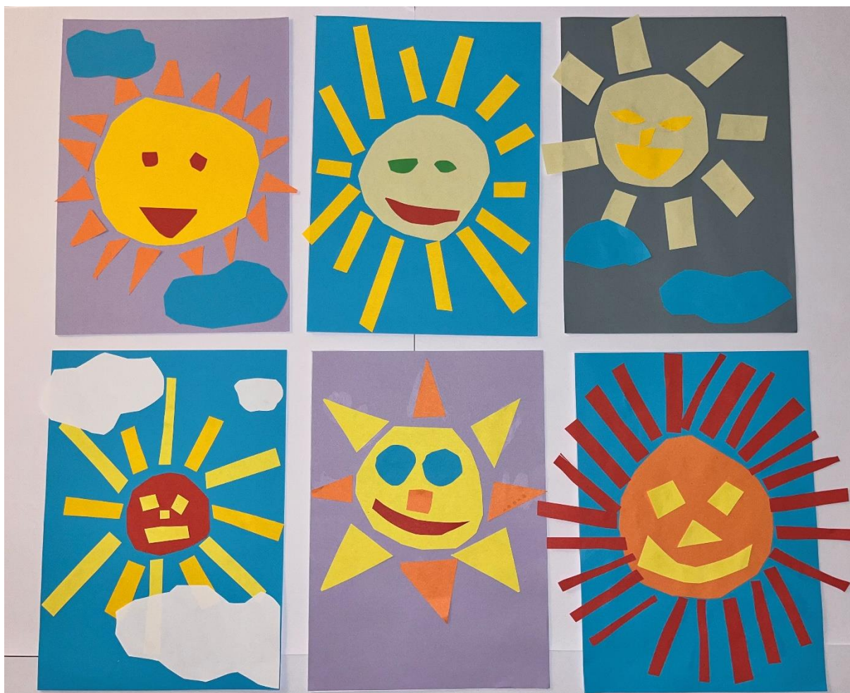
Obrázek č. 10: autoři: všichni