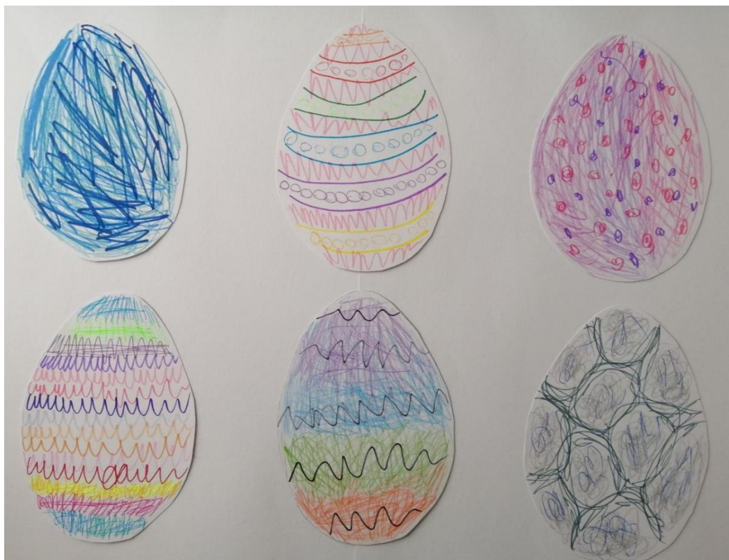
Obrázek č. 6: autoři: všichni