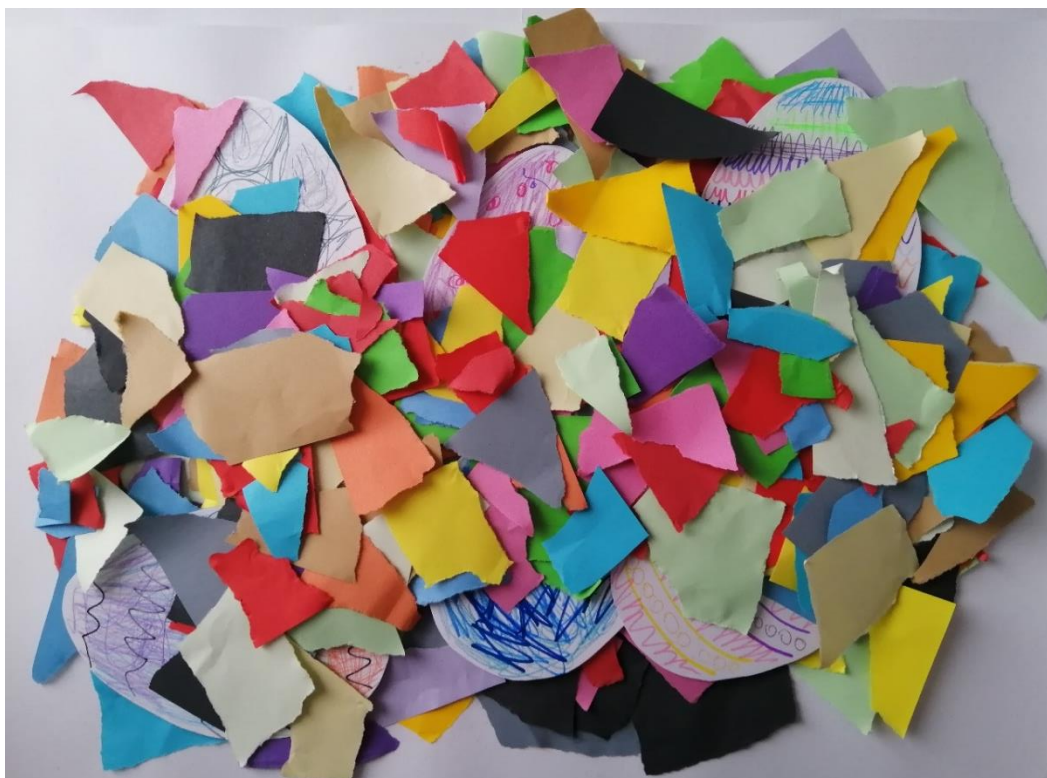
Obrázek č. 7: autoři: všichni