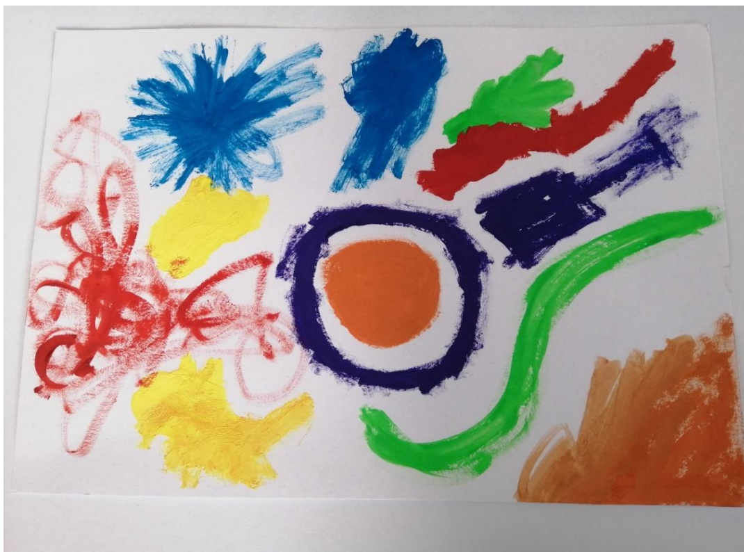
Obrázek č. 1: autoři: Ema a Peta