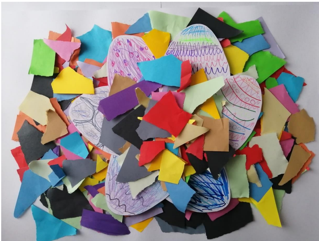
Obrázek č. 8: autoři: všichni