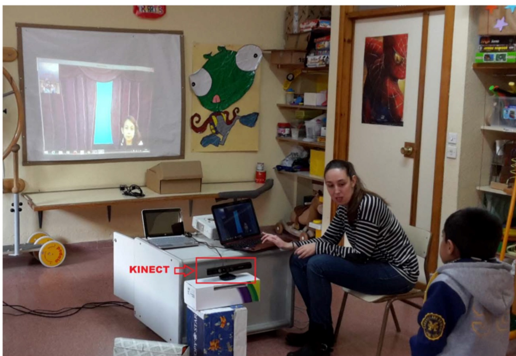
Obrázok 2. Testovanie zariadenia Kinect pred terapiou (Martín-Ruiz, 2016).

Pohyby sú detekované 3D snímaním vystúpených bodov na tvári a 3D zobrazení polohy hlavy. Samotná hra funguje na princípe prekonávania niekoľkých testov, kde dieťa rozpozná pohyb a snaží sa ho správne vykonať. Kinect pri tom kontroluje správnosť pohybov v orofaciálnej oblasti. Ak dieťa dokončí test, môže prejsť na ďalšiu úroveň (Obrázok 3) (Martín-Ruiz, Máximo-Bocanegra, & Luna-Oliva, 2016).