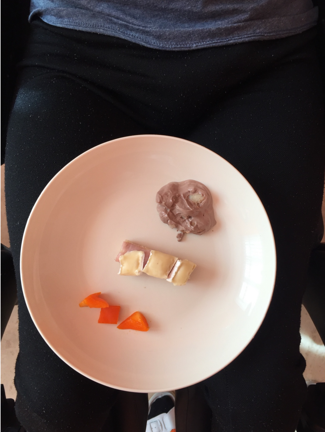
Obrázok 4. Potraviny, ktoré pacientka konzumovala pri vyšetrení