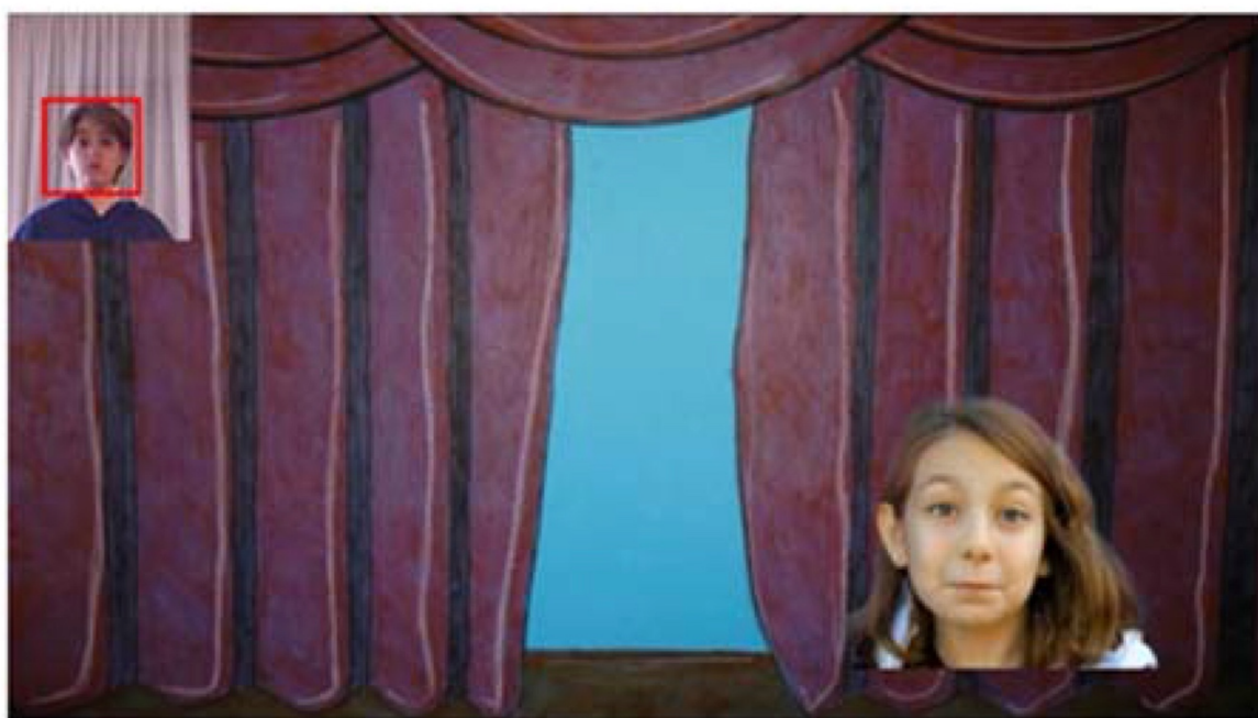
(a) Game eyebrows start

Pohyby sú detekované 3D snímaním vystúpených bodov na tvári a 3D zobrazení polohy hlavy. Samotná hra funguje na princípe prekonávania niekoľkých testov, kde dieťa rozpozná pohyb a snaží sa ho správne vykonať. Kinect pri tom kontroluje správnosť pohybov v orofaciálnej oblasti. Ak dieťa dokončí test, môže prejsť na ďalšiu úroveň (Obrázok 3) (Martín-Ruiz, Máximo-Bocanegra, & Luna-Oliva, 2016).