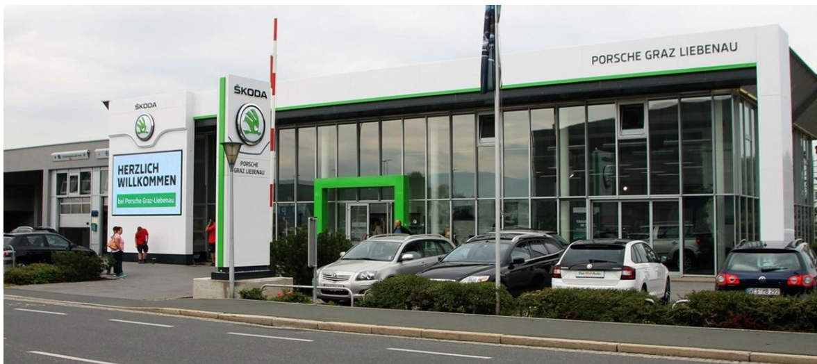
Obr. 7 Dealerství Graz – Libenau před rebrandingem