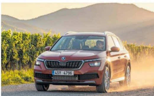
Der Dritte im Bunde: Škoda stellt seinen SUV mit dem Kamiq einen ansehnlichen kleinen Bruder zur Seite.

Dieser Designphilosophie folgt auch der brandneue Kamiq, der nach Kodiaq und Karoq als drittes Modell das SUV-Angebot der Tschechen abrundet. Mit gut 4,26 Metern Länge ist er der Junior im SUV-Dreigesirte, dennoch steht er erstaunlich erwachsen auf den bis zu 18 Zoll großen Rädern. Škoda ordnet den Kamiq dem City-SUV zu, die mit erhöhter Sitzposition zu wahren Zulassungstiteln geworden sind. Ein Plus an Be-