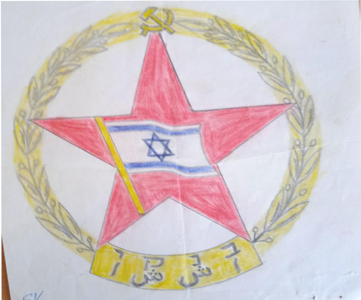
Příloha č. 12: Kresba odznáčku pro komunistickou mládež Izraele.