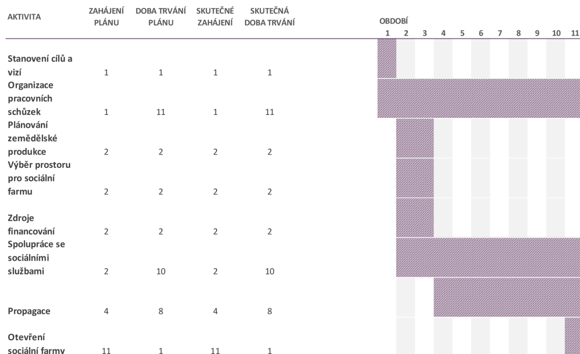
Obrázek 1 Ganttův diagram