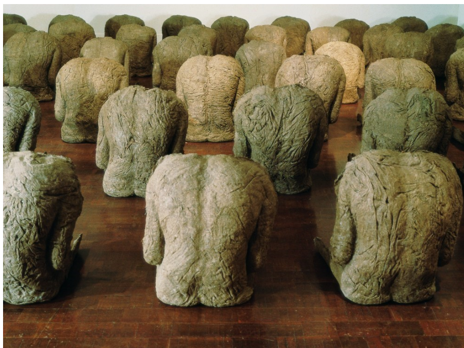
Obr. 3 Magdalena Abakanowicz - Záda