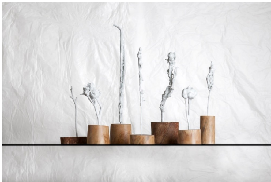
Obr. 5 Pavla Vachunová - Čarovný les

A mne právě oslovilo její odlévání organických přírodních materiálů, které namáčí do licí břechky a následně je vypálí. Vznikla tak například práce nazvaná Čarovný les, kdy využívá ve své tvorbě i určitý princip náhody, kdy jí nejde primárně o tvar, jelikož někdy ho nelze úplně ovlivnit. Tento princip využívala například i k výrobě šperků.