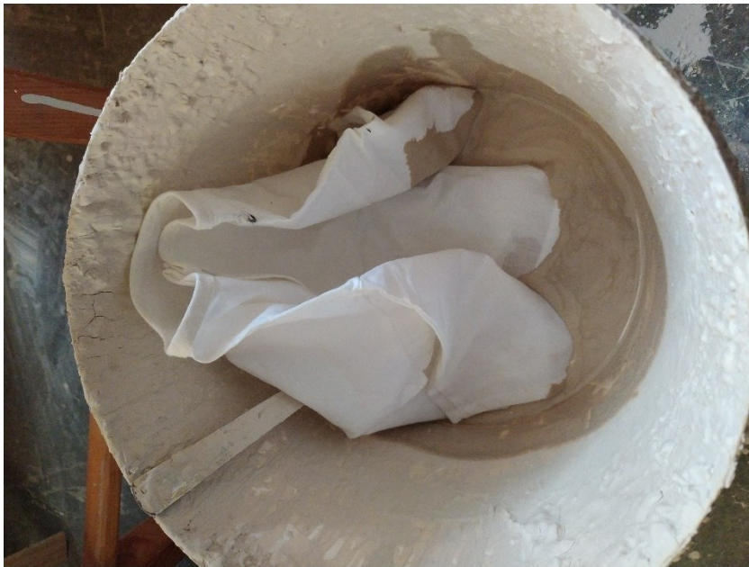
Obr. 11 Namáčení plátěné košilky do porcelánové břečky

Po jemném zavadnutí jsem postup zopakovala, jelikož jsem při technických zkouškách zjistila, že je potřeba alespoň dvou tenkých vrstev materiálu.