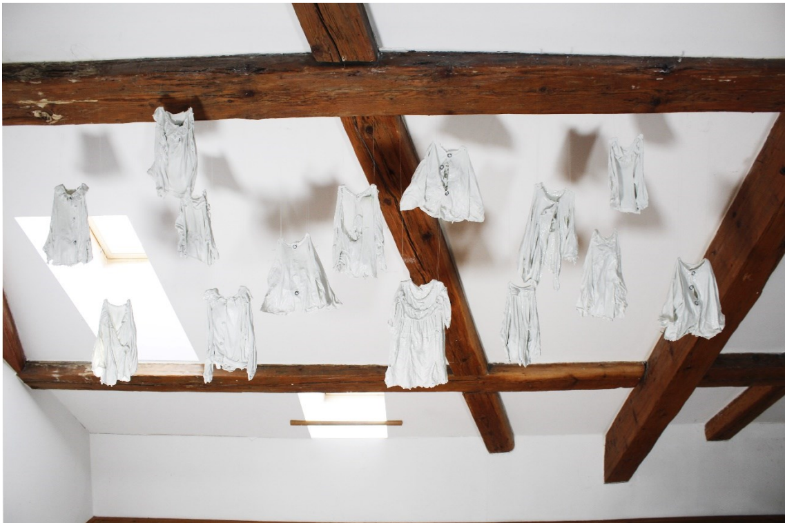
Obrazová příloha – Jaroslava Vitteková, 2020