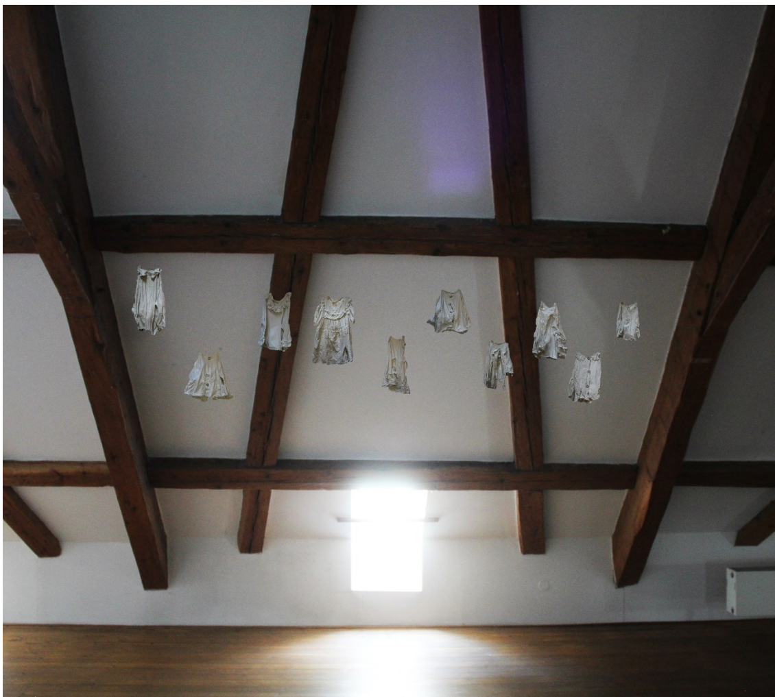
Obr. 17 Návrh na instalaci 2

Druhým konceptem bylo zavěšení do více řad, čímž by více zaplnil prostor. Nakonec jsem zvolila tento princip, jelikož takhle na mne působí mnohem lépe. Není to tak strojené a samotný prostor je vyváženější. I samotné košilky mají pro sebe určitý prostor, takže mnohem více vynikají jednotlivé struktury.