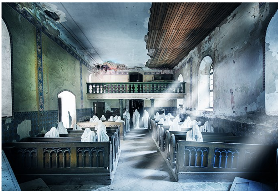
Obr. 2 Instalace Jakuba Hadravy v Lukové