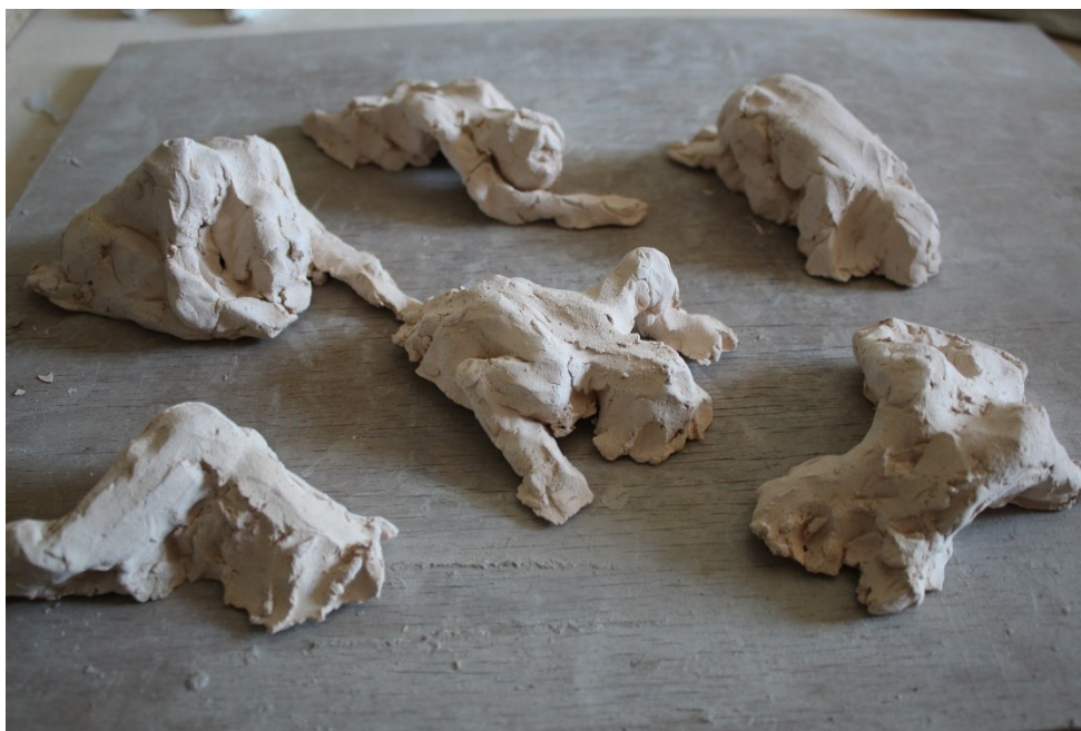
Obr. 7 Návrh Zrození Adama

Proto jsem původně pracovala s myšlenkou na použití hlíny, ze které by se vynořovala nebo, do které se vnořovala figura. Hledala jsem kompozici, kdy je už postava poznatelná, zároveň však není příliš konkrétní. Moment, kdy se z neživého stává živé.