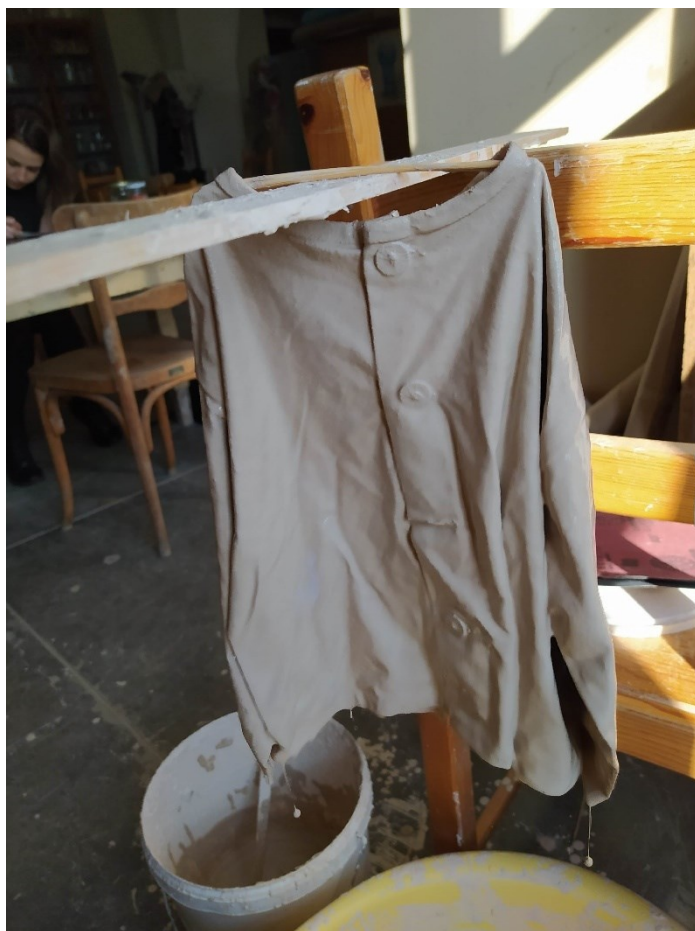
Obr. 12 Zavěšení košilky