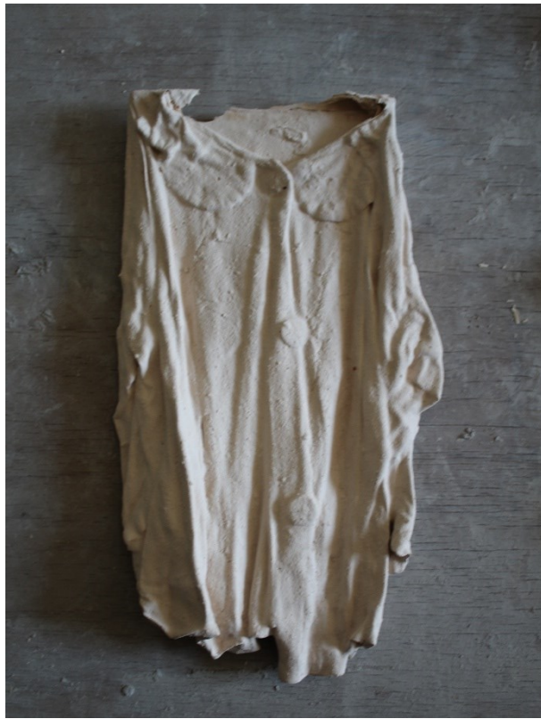
Obr. 9 Zkouška materiálu