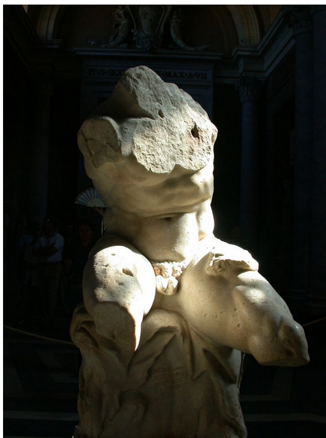
Obr. 1 Belvedérské torzo