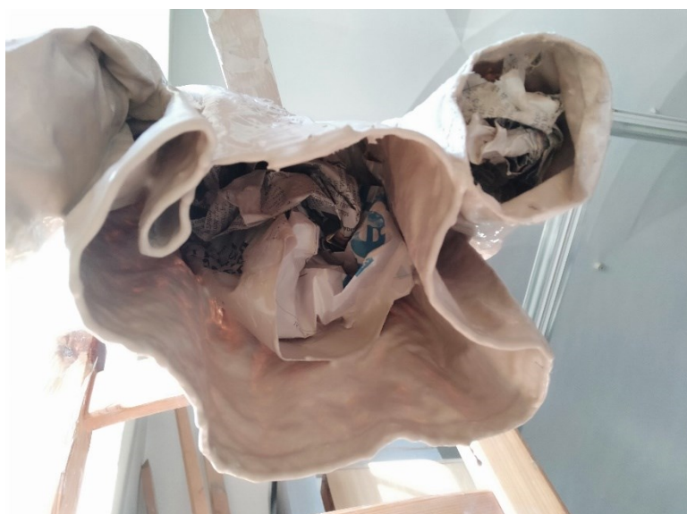
Obr. 13 Vycpávání novinami