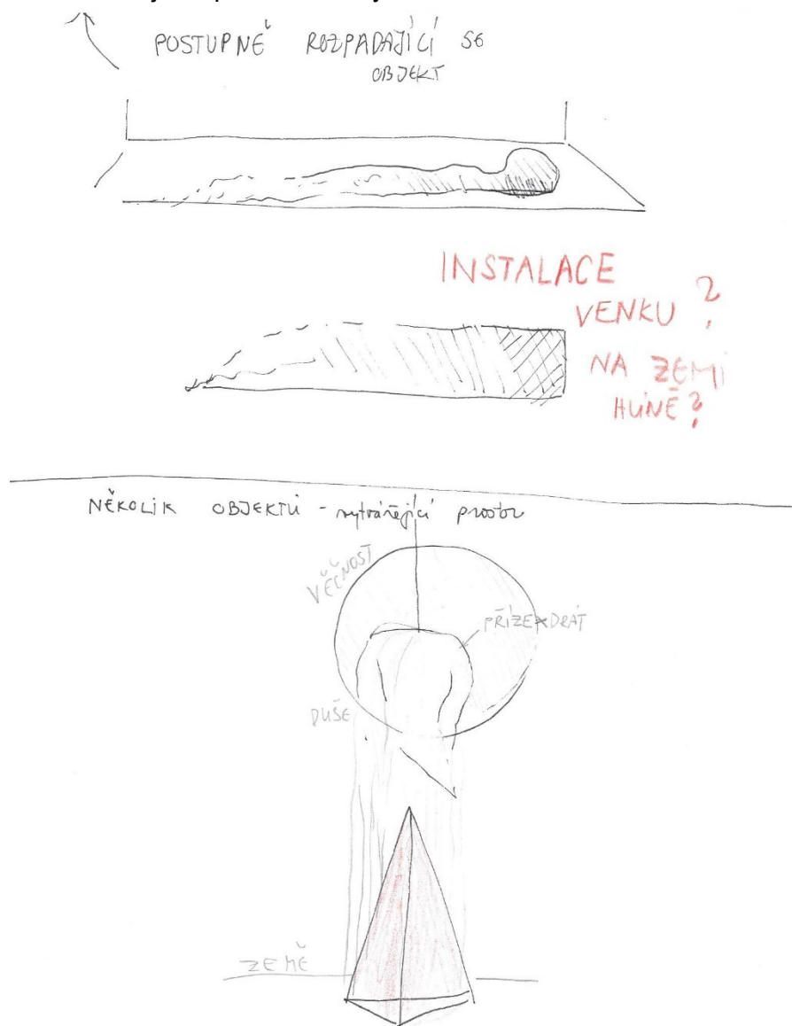
Obr. 8 Návrh na objekty z nevypálené hlíny

Také jsem zkoušela vzít si čistě motiv hlíny, který nejen v návaznosti na předchozí biblický příběh v sobě skrývá symboliku života i smrti. Tu jsem chtěla tvarovat do různých podob a nechat ji nevypálenou. Například tvarově minimalistický jehlan, ke kterému mě inspirovaly špičky obelisků, který by komunikoval se zavěšeným textilním objektem odkazujícím k posmrtnému životu. Tento návrh však pro svou nekonkrétnost zůstal jen v podobě kresby.