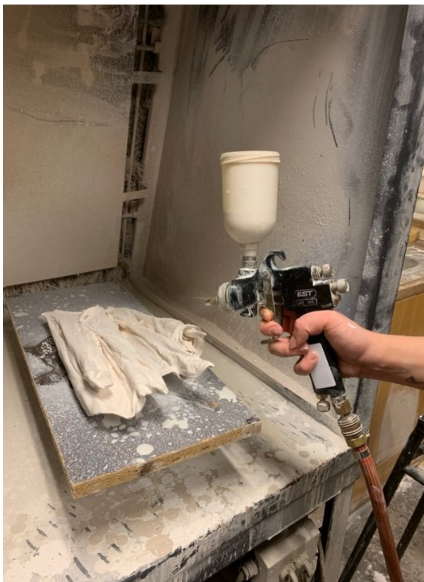
Obr. 15 Nanášení glazury stříkací pistolí