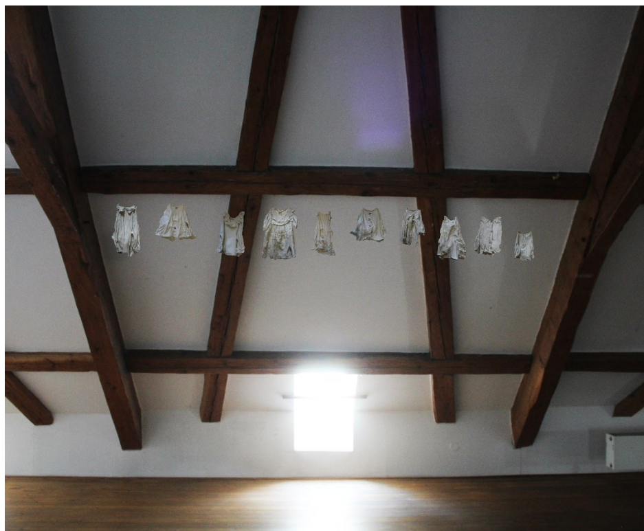
Obr. 16 Návrh na instalaci 1

Při konkrétním přemýšlení nad instalací jsem přemýšlela nad dvěma variantami. První z nich byla koncepce do jedné linie, kdy by se výška zavěšení odchylovala jen velmi zlehka, aby vytvořila takové nepatrné vlnění.