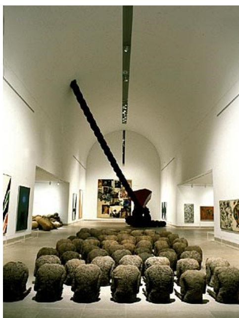
Obr. 4 Magdalena Abakanowicz - 80 zad