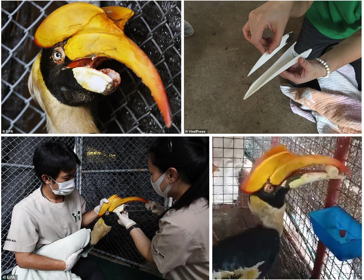
Obr. 13: Dvojoborožec indický v západním Thajsku v rehabilitačním centru (Randall 2020).