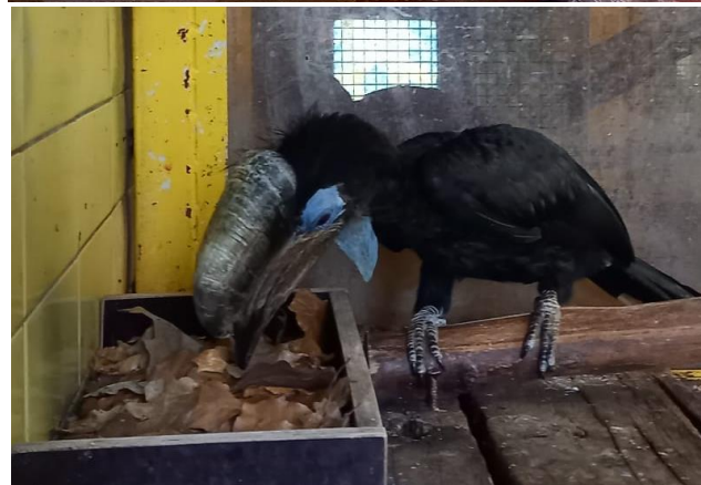
Obr. 7: Potravní enrichment v zoo Liberec u zoborožce šedolícího, zoborožce kaferského a zoborožce hrubozobého ( Ceratogymna atrata )