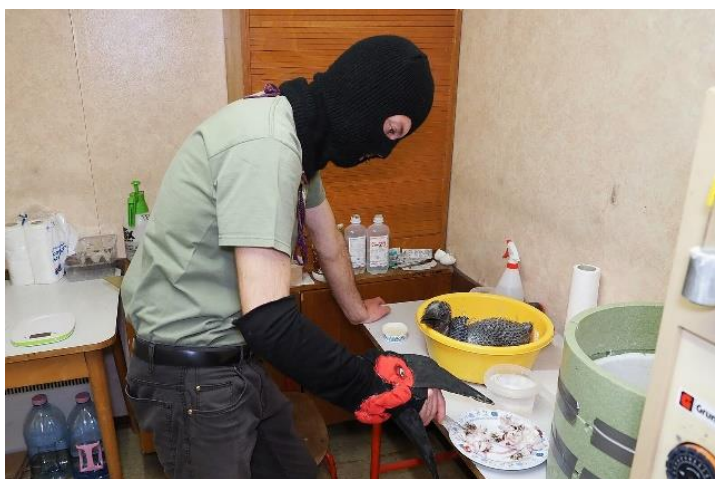
Obr. 11: Krmení mláděte zoborožce kaferského v Zoo Olomouc

Zásadním procesem u ptačích mláďat je tzv. imprinting neboli vtištění, který způsobuje, že si mládě během sensitivní periody zafixuje podobu svého rodiče. Při ručním odchovu je tak velmi důležité, aby nedošlo k imprintingu ošetřovatelů (abnormální imprinting), v takovém případě může dojít k odmítnutí socializace, interakce a následně páření se svým vlastním druhem. Míra vtištění a možnost překonání nepřirozeného vtištění se liší v závislosti na jednotlivých druzích (Anderson Brown & Robbins 1994; Veselovský 2005; Bielby 2022; IUCN 2023). V některých případech může dojít při kontaktu s vlastním druhem i k agresi nebo zabítí (Galama et al. 2002). K minimalizaci rizika abnormálního imprintingu je možné podniknout několik kroků (Tsuji 1996; Potůček 2018; IUCN 2023; Štraub & Čihák 2023):