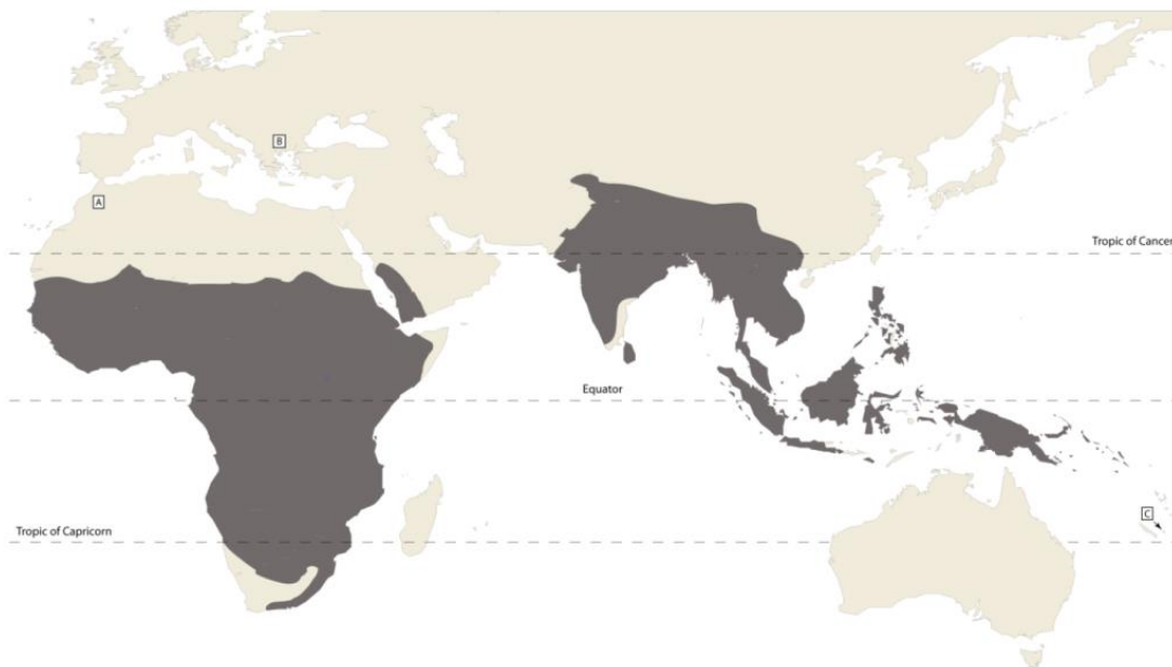
Obr. 1: Rozšíření zoborožců ve světě, písmena jsou označeny areály již vyhynulých druhů (A– Bucorvus brailloni , B– Euroceros bulgaricus , C– Rhyticeros sp. ) (Gonzalez 2012).

Rozšíření zoborožců je téměř výhradně v tropickém pásmu Afriky a Asie (mezi 30 ° N a 30 ° od rovníku), přičemž většina druhů obývá velké plochy lesů, na kterých jsou závislí a několik afrických druhů žije na suchých savanách Afriky. Jeden druh – zoborožec guinejský ( Rhyticeros plicatus ) – obývá oblast Nové Guiney a Šalamounových ostrovů (Dimitrijevič 1991; Galama et al. 2002; Witman & LaGreco 2020; Beilby 2022). Rozšíření zoborožců je možné vidět na obrázku 1 (Gonzales 2012).