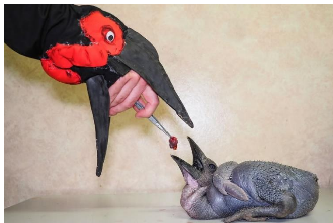
Obr. 10: Krmení mláděte zoborožce kaferského v Zoo Olomouc (IDNES 2024)

Ke krmení se obvykle používají pinzety s tupým koncem (příklad krmení ukazuje obrázek 10). Zprvu se podávají menší kusy krmiva, poté se postupně sousta zvětšují. Krmivo je vhodné nejprve ponořit do vody a poté vložit hluboko do zobáku, zvyšuje se tím pravděpodobnost, že mládě sousto nevyzvrací. Při krmení je zapotřebí dbát opatrnosti, aby nedošlo k poranění mláděte pinzetou nebo ke znečištění. Mláďata mají z počátku slabé svaly, což způsobuje kývání hlavy při krmení,