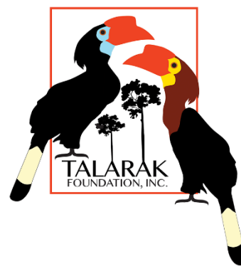
Obr. 3: Logo organizace Talarak působící na Filipínách.