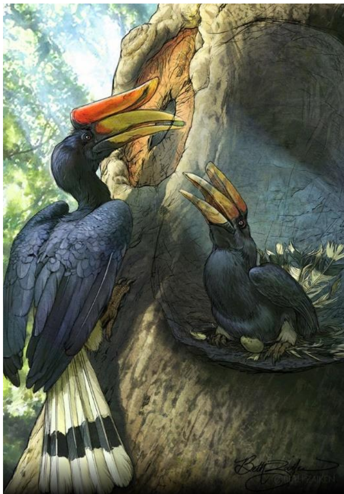
Obr. 2: Krmení samice v hnízdě – Dvojzoborožec nosorožčí ( Rhinoceros hornbill ) (The Minnesota Zoo 2024)

Samice snáší první vejce v časovém předstihu a začíná ho inkubovat dříve, než snese zbytek vajec – výsledkem je asynchronní líhnutí mláďat (Beilby 2022). Všechna vejce zoborožců mají vždy bílou barvu (Mace & Azua 1997; Kemp 1995). Mláďata jsou po vylíhnutí zcela závislá na péči samice (jsou tzv. altriciální) (Kemp 1995; Mace & Azua 1997; Witman & LaGreco 2020). V mnoha případech ze snůšky přežívá jen jedno nejsilnější mládě. Význam samotné přítomnosti samice v hnízdě je stále předmětem diskuzí, nicméně Beilby (2022)