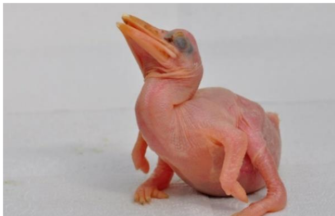
Obr. 9: Mládě dvojzoborožce indického v Zoo Zlín (Potůček 2018).

Podstatnou součástí péče o mláďata je pečlivé vedení záznamu o ručním odkrmování a hmotnosti za účelem zajištění možnosti opakovat postup, sdílet data nebo sledovat změny, které vedou k úspěchu. Mláďata jsou vážena každé ráno před prvním krmením. Každodenní vážení pokračuje až do opeření (Witman & LaGreco 2020).